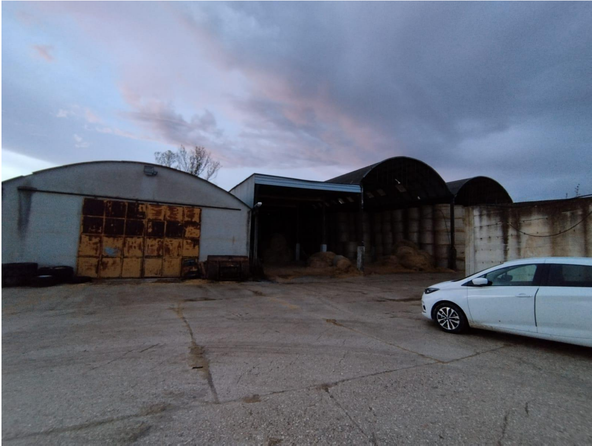
VISTA N.3 F.9 p.lla 146 sub 4 (Rif. Plan.2 ricovero attrezzi agricoli cat.D/10)