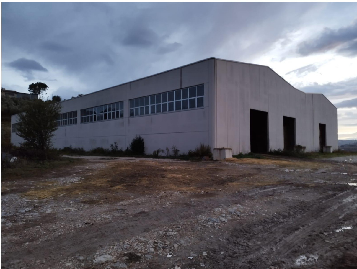
VISTA N.5 p.lla 146 sub 3 capannone costruito nel 2006