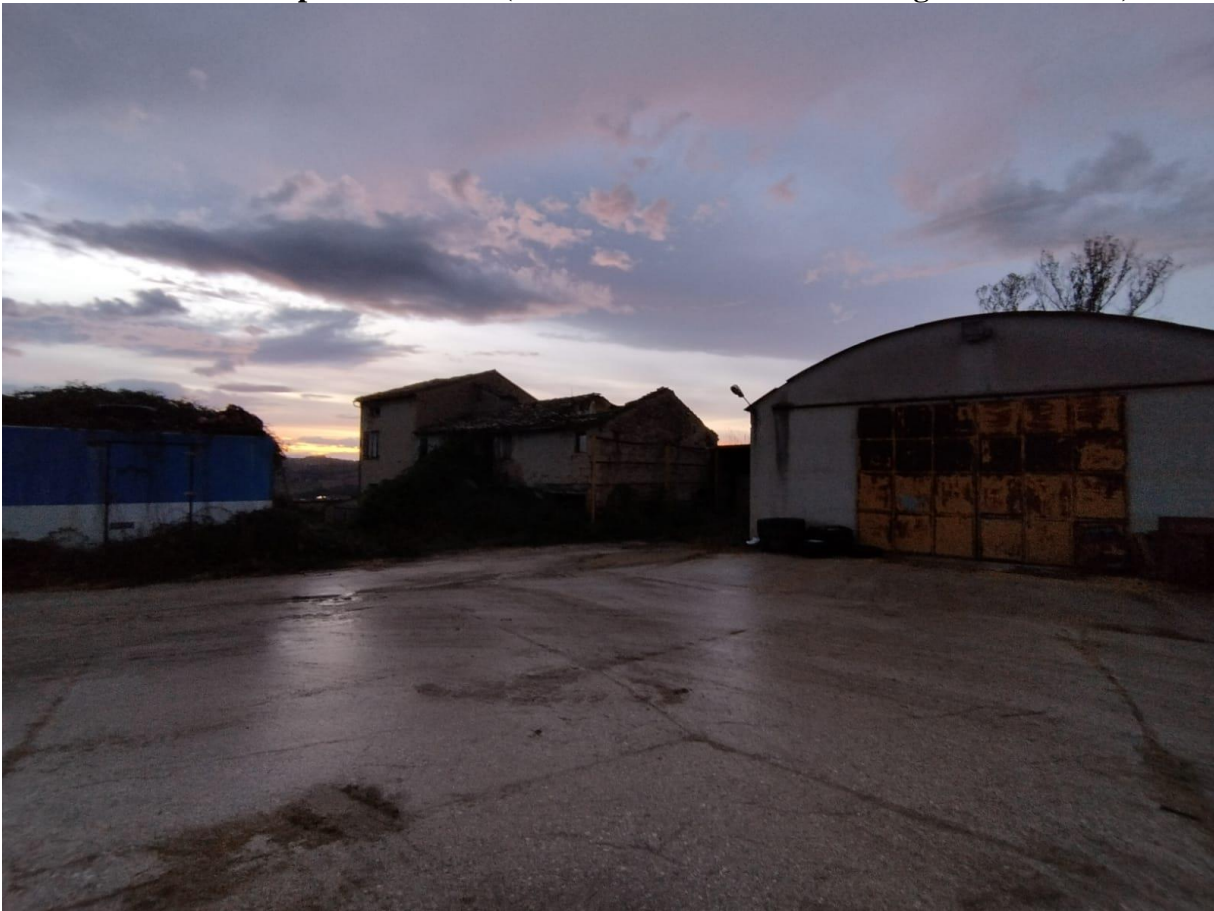
VISTA N.4 p.lla 146 sub 4 (Rif. Plan.2 ricovero attrezzi agricoli cat.D/10 e sub. 5-6-7-8-9 unità collabenti)