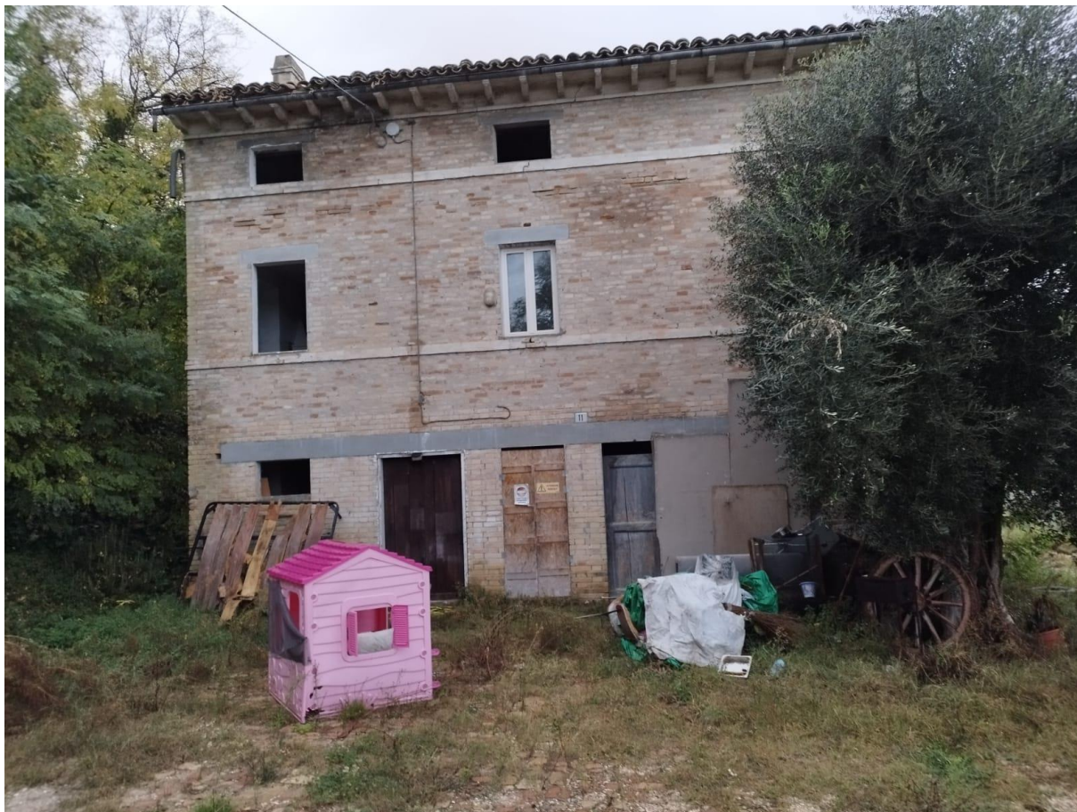
VISTA N.1 Vista esterna fabbricato F.10 PLLA 177 sub. 3 e 4 con ordinanza di inagibilità per terremoto;