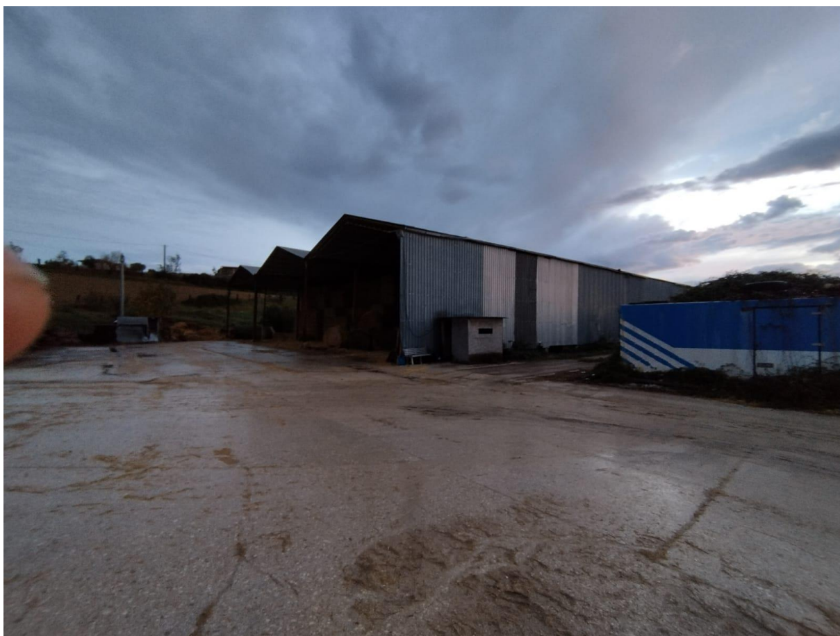
VISTA N.2 F.9 p.lla 146 sub 4 (Rif. Plan.1 ricovero attrezzi agricoli cat.D/10)

STUDIO TECNICO ING. FRANCESCO CICCALÈ VIALE DELLA REPUBBLICA 18 - 63814 TORRE S. PATRIZIO (FM) Tel e fax: +390734510184 CELL. +393332523636, C.F.: CCCFNC63L06L279Q P.I.: 01516120449 E-MAIL: francescobiccale1@gmail.com