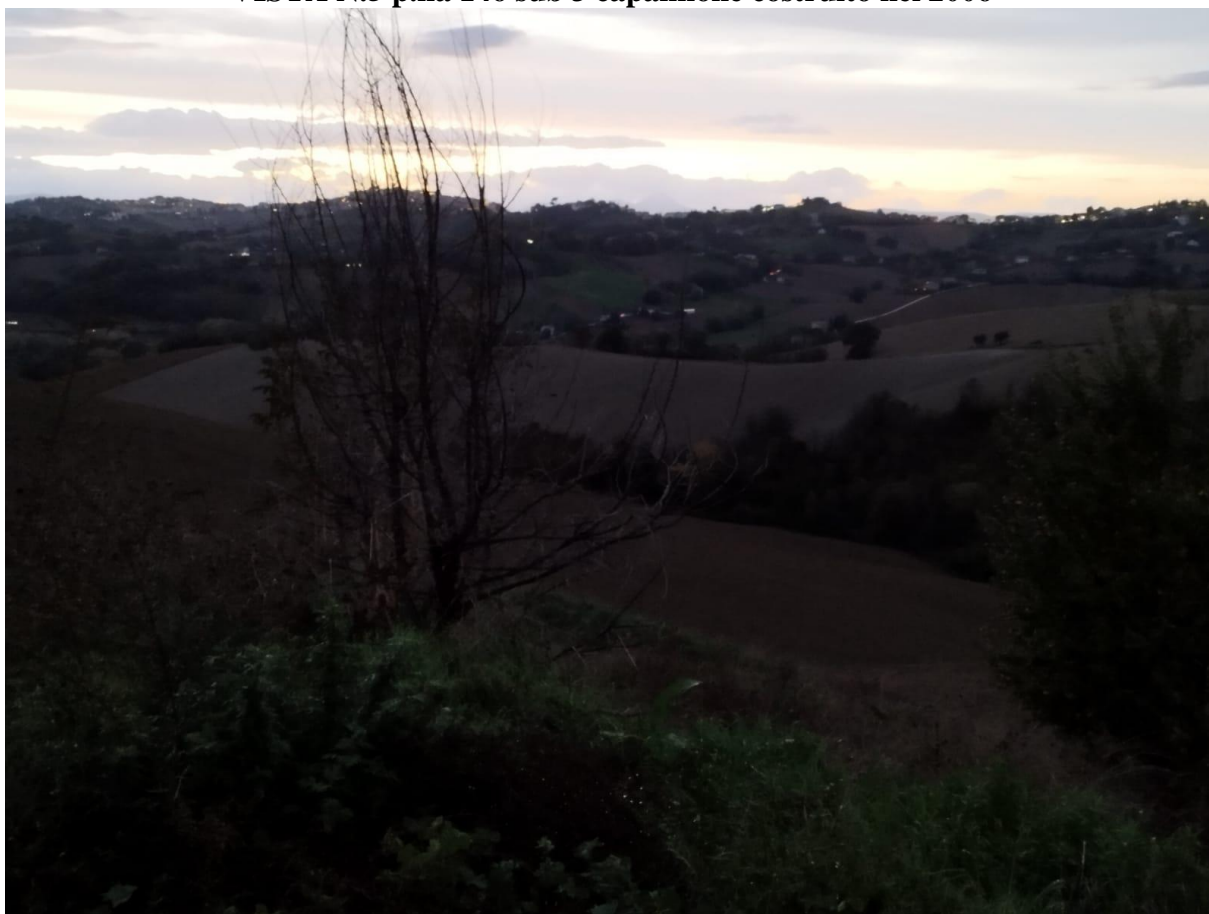
VISTA N.6 Terreni F.9

STUDIO TECNICO ING. FRANCESCO CICALÈ VIALE DELLA REPUBBLICA 18 - 63814 TORRE S. PATRIZIO (FM) Tel e fax: +390734510184 CELL. +393332523636, C.F.: CCCFNC63L06L279Q P.I.: 01516120449 E-MAIL: francescocalè1@gmail.com