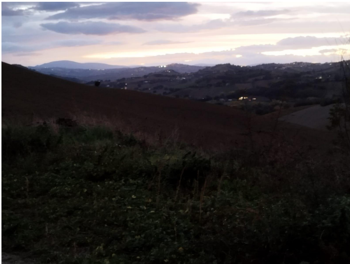
VISTA N.7 Altra vista terreni F.9