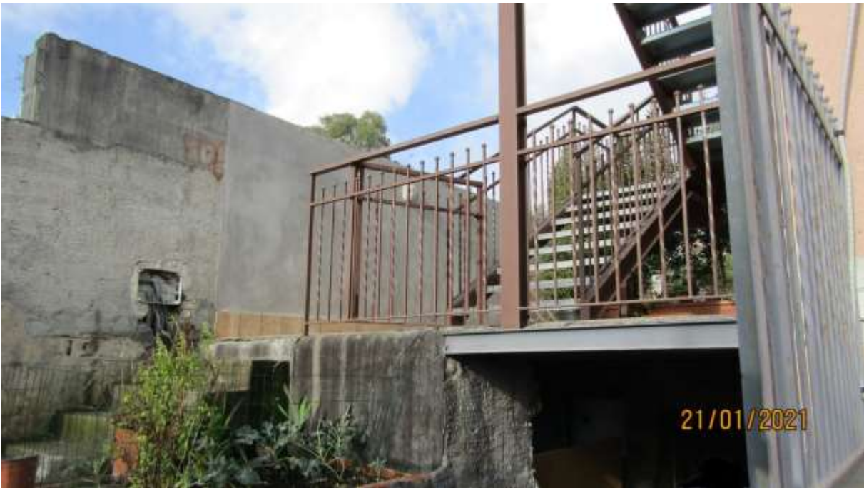
FO-L1-4 -SCALA ESTERNA DI COLLEGAMENTO DAL PIANO TERRA AL PIANO SEMINTERRATO ED AL PIANO PRIMO