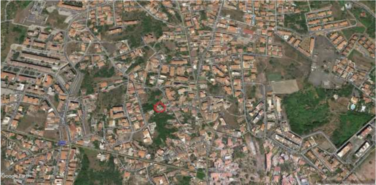
EMPIRICA RAPPRESENTAZIONE DELLA UBICAZIONE DEL CORPO DI FABBRICA OGGETTO DI INDAGINE RISPETTO ALL'AREALE DI RIFERIMENTO SUL FOTOGRAMMA AEREO TRATTO DAL PORTALE GRATUITO GOOGLE EARTH