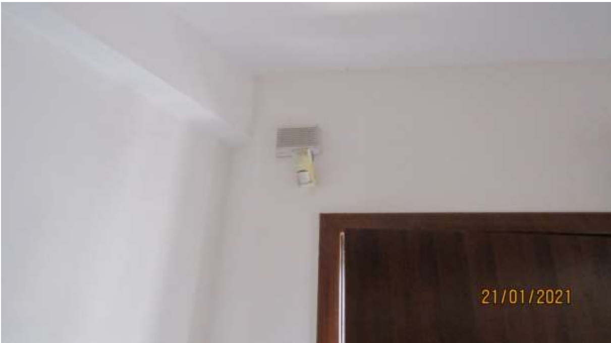
FO-L1-23 SPECIFICHE RIFINITURE ED ACCESSORI APPARTAMENTO AL PIANO TERRA SUBALTERNO 2