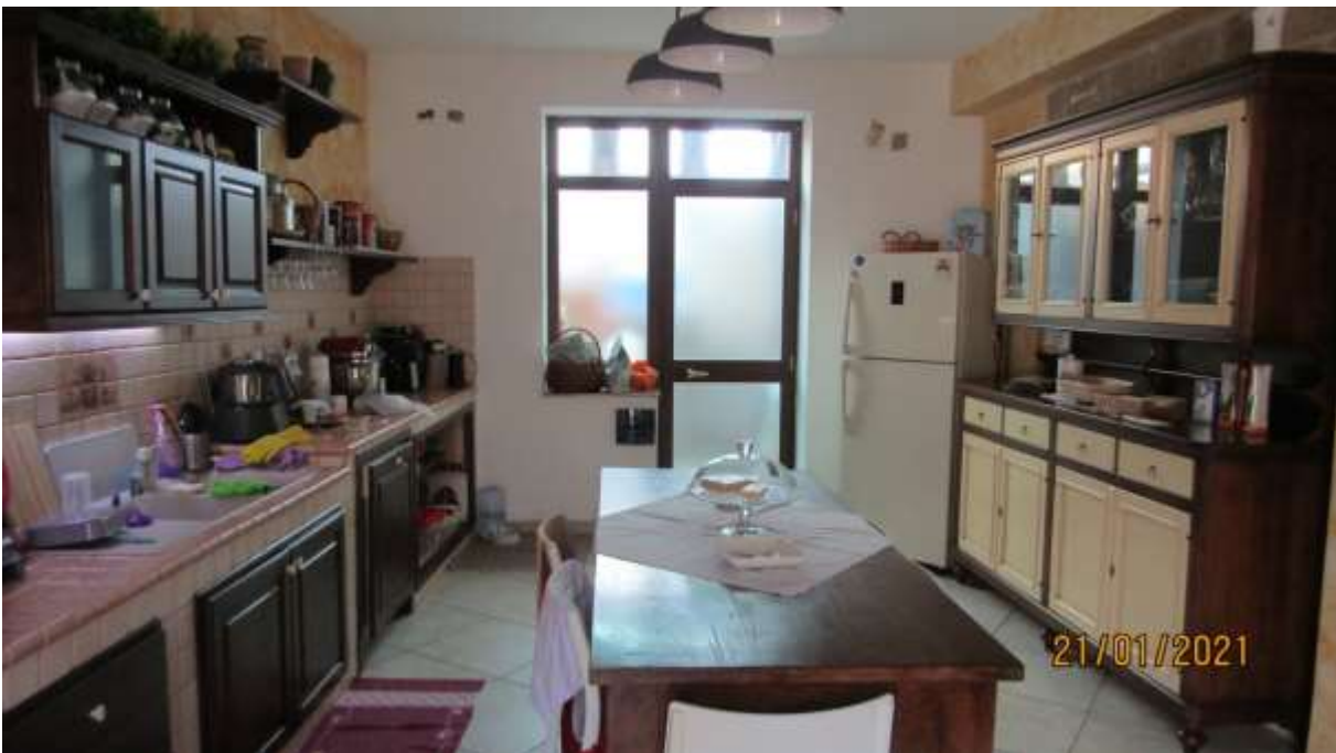
FO-L1-18 ZONA CUCINA APPARTAMENTO AL PIANO TERRA SUBALTERNO 2