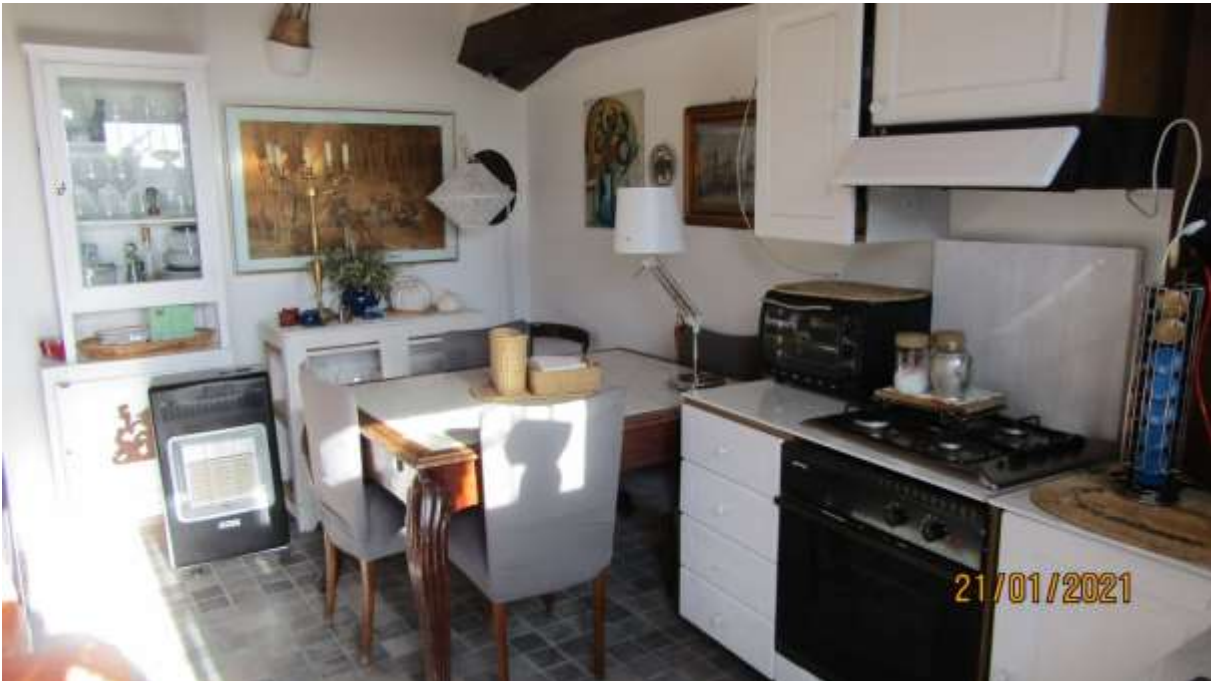
FO-L1-33 INTERNO APPARTAMENTO LATO EST PIANO PRIMO SUBALTERNO 3