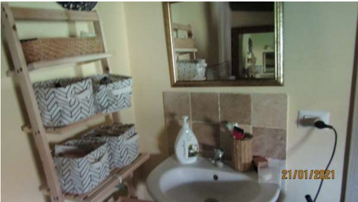
FO-L1-39 WC- APPARTAMENTO LATO EST PIANO PRIMO SUBALTERNO 3