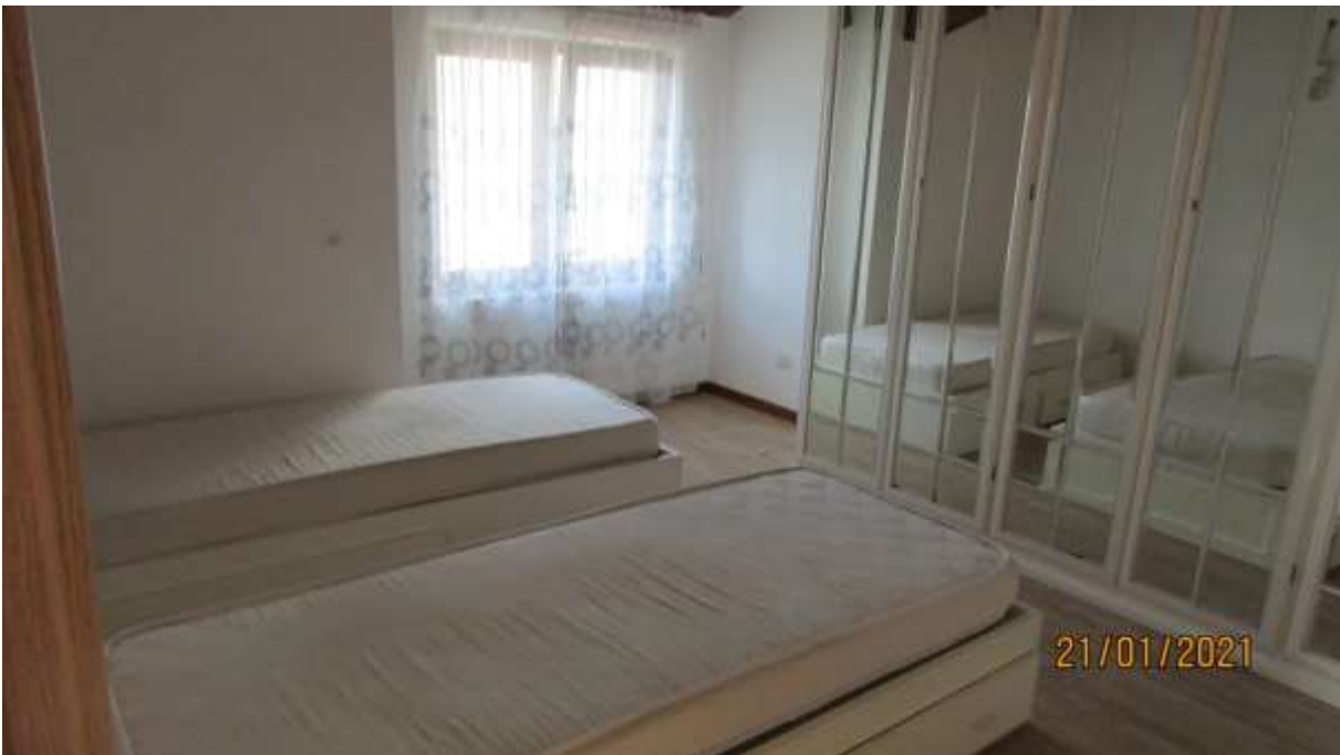
FO-L1-29 INTERNO APPARTAMENTO LATO OVEST PIANO PRIMO SUBALTERNO 3