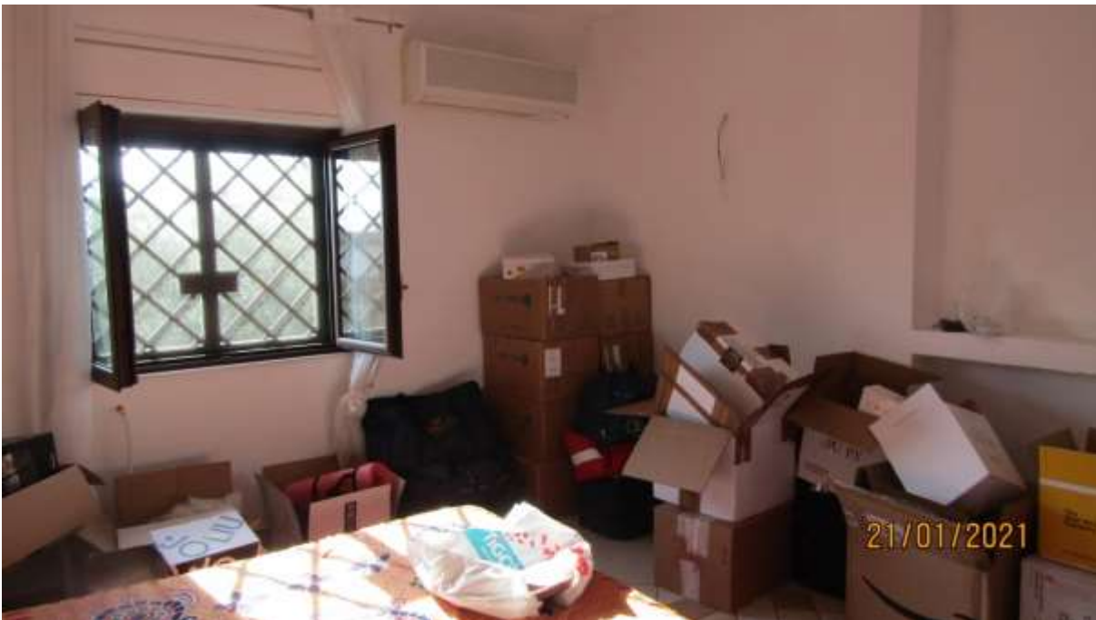
FO-L1-20 VANO APPARTAMENTO AL PIANO TERRA SUBALTERNO 2