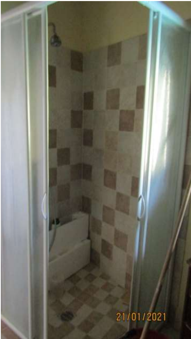
FO-L1-40 WC- APPARTAMENTO LATO EST PIANO PRIMO SUBALTERNO 3