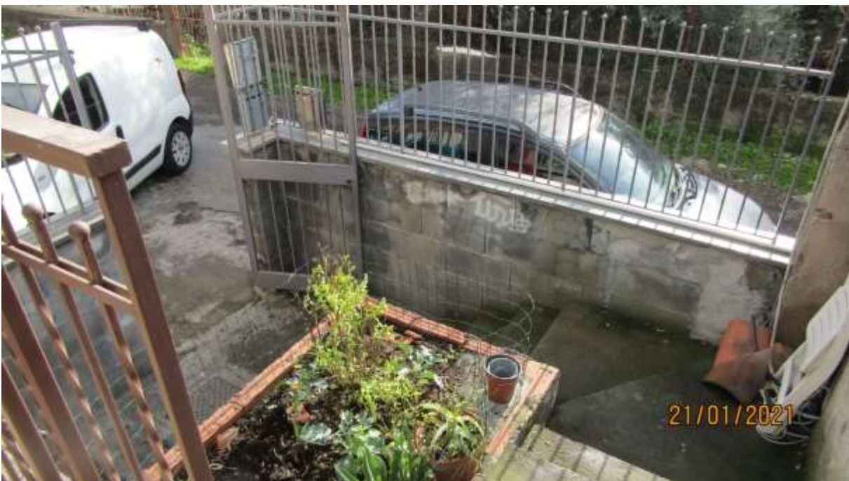
FO-L1-25 SCALA DI ACCESSO ESTERNA AL PIANO PRIMO SUBALTERNO 3