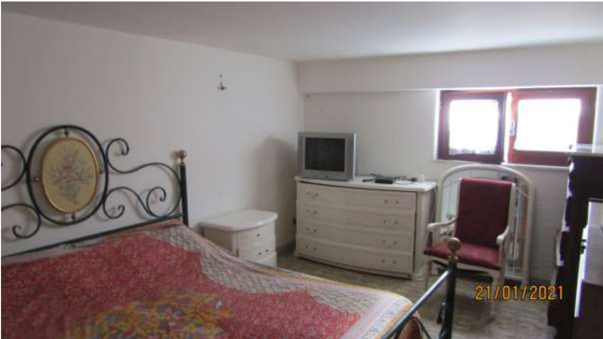
FO-L1-8 –LOCALE AL PIANO SEMINTERRATO SUBALTERNO 2