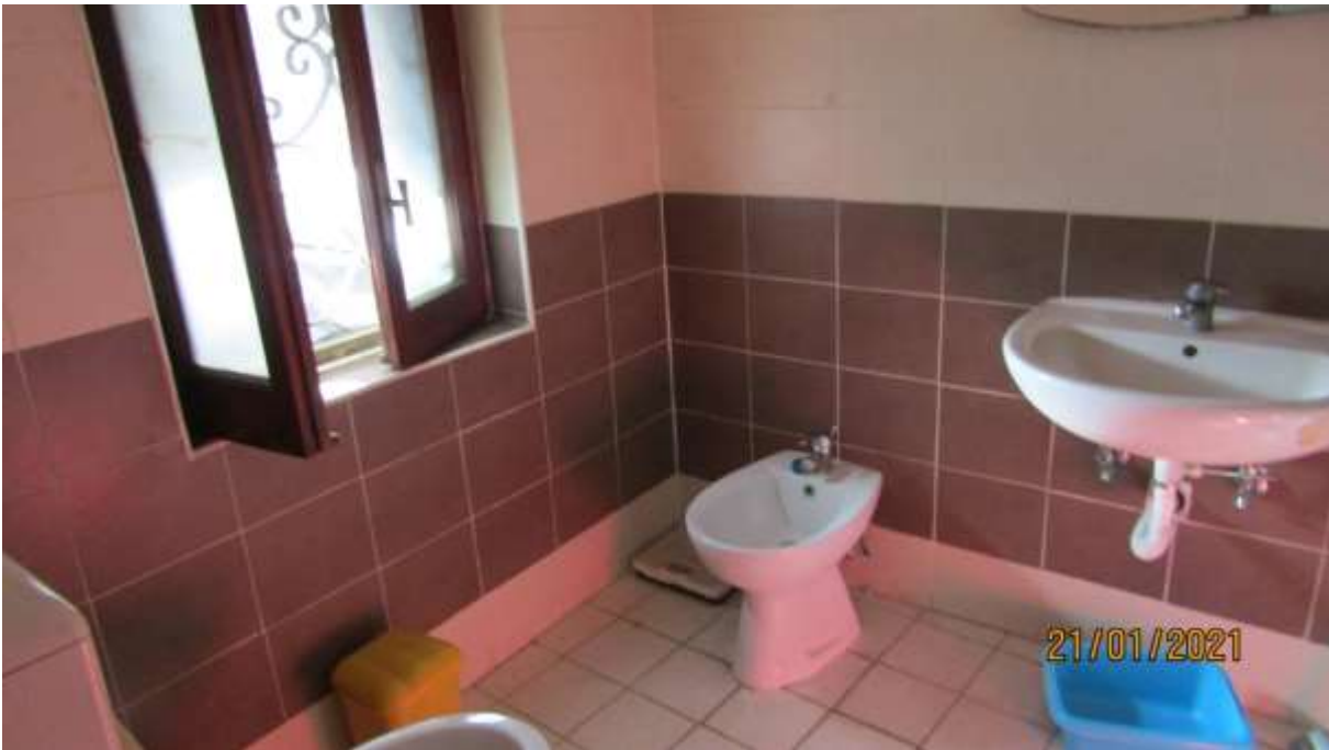
FO-L1-9 –LOCALE WC AL PIANO SEMINTERRATO SUBALTERNO 2