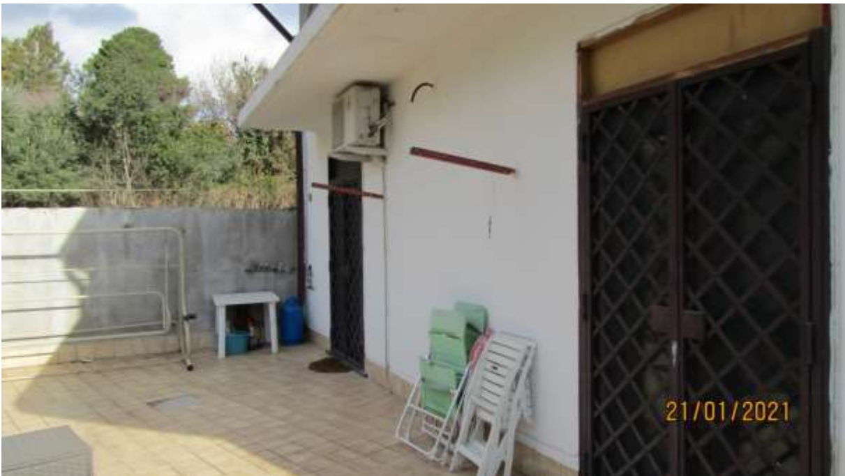
FO-L1-12 –TERRAZZO LATO OVEST DI PERTINENZA APPARTAMENTO AL PIANO TERRA SUBALTERNO 2