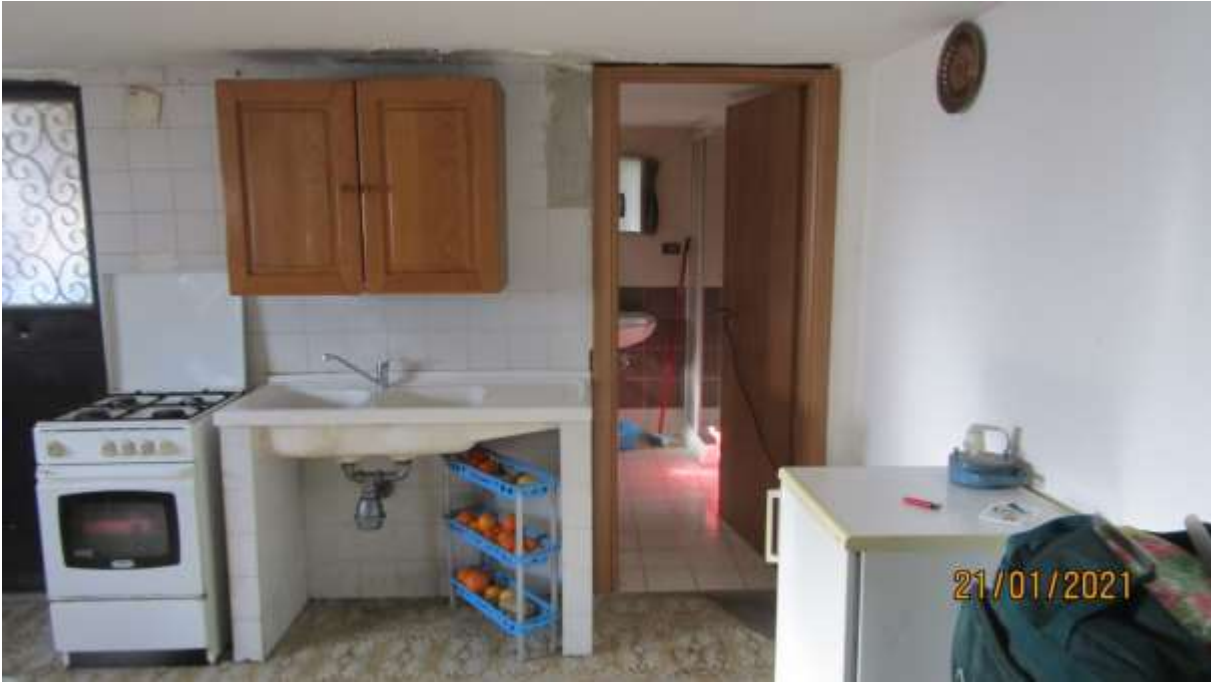
FO-L1-7 –LOCALE AL PIANO SEMINTERRATO SUBALTERNO 2