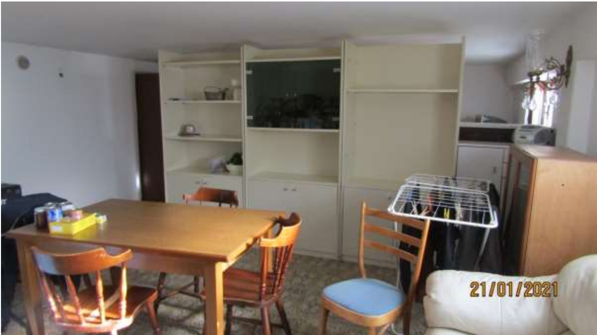
FO-L1-6 –LOCALE AL PIANO SEMINTERRATO SUBALTERNO 2