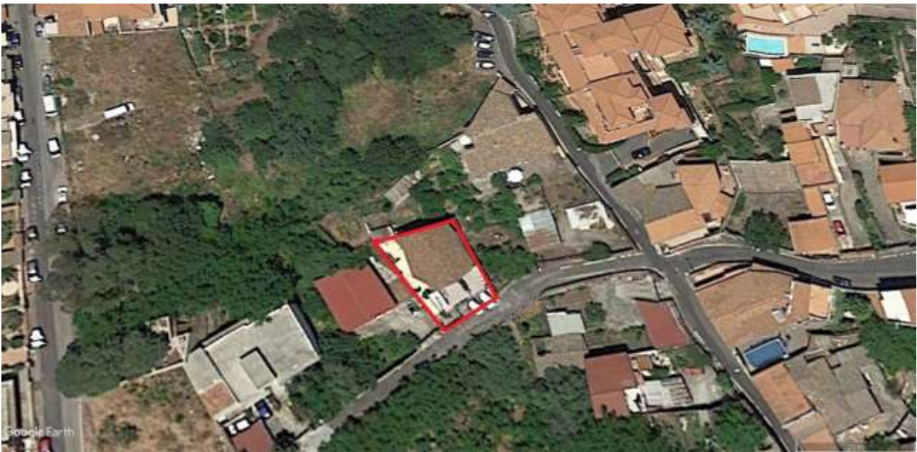
EMPIRICA RAPPRESENTAZIONE DELL'AREA OCCUPATA DAL CORPO DI FABBRICA OGGETTO DI INDAGINE SUL FOTOGRAMMA AEREO