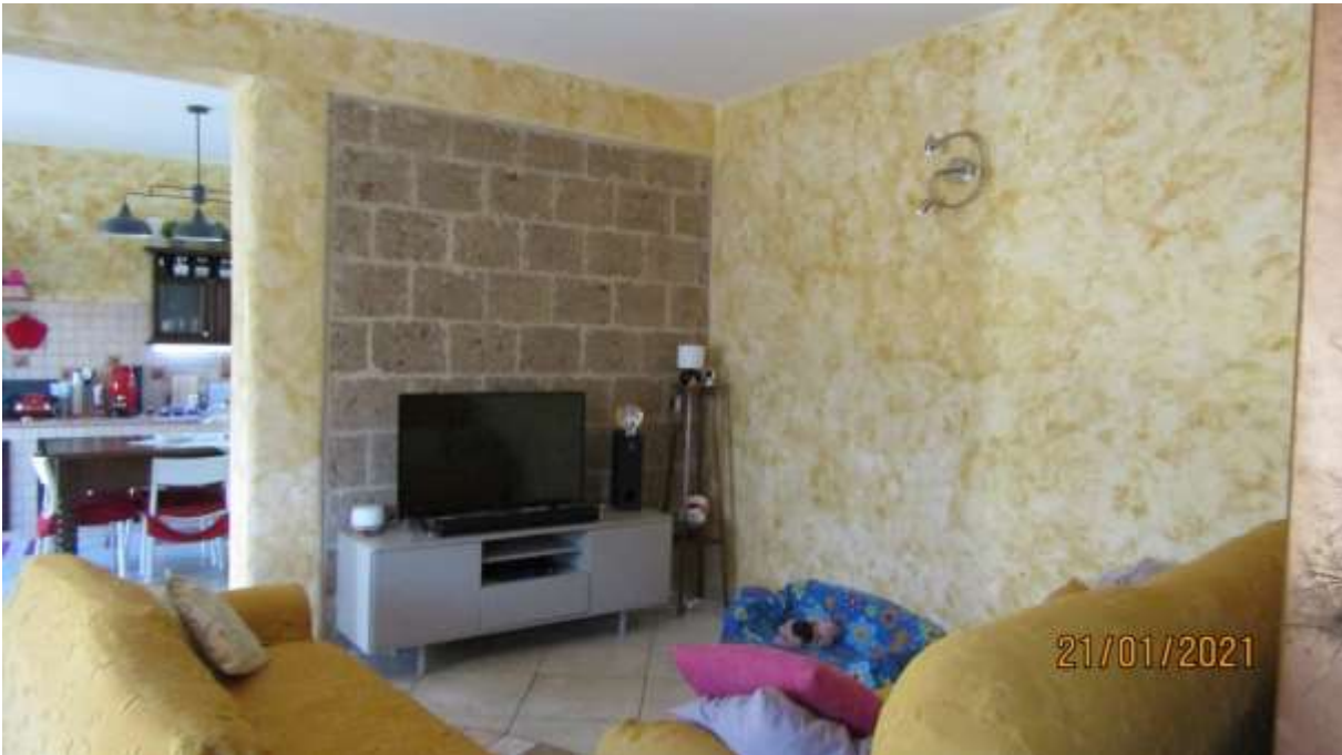
FO-L1-16 –INTERNO APPARTAMENTO AL PIANO TERRA SUBALTERNO 2