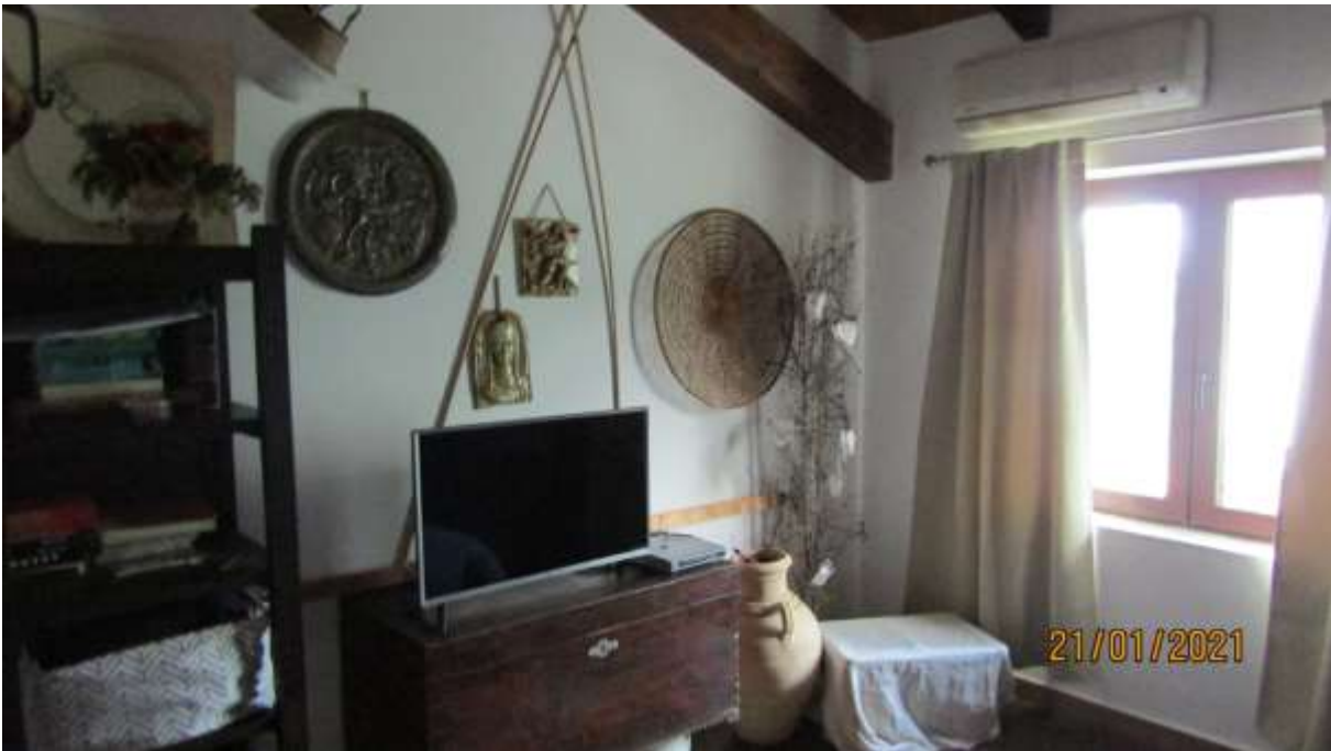
FO-L1-36 INTERNO APPARTAMENTO LATO EST PIANO PRIMO SUBALTERNO 3