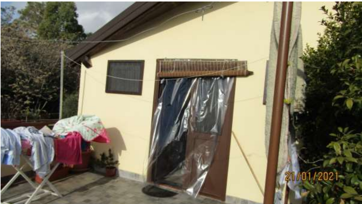
FO-L1-27 APPARTAMENTO LATO OVEST PIANO PRIMO SUBALTERNO 3