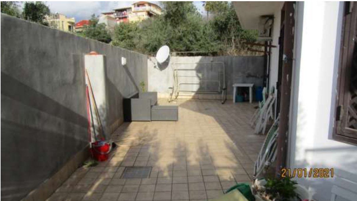
FO-L1-11 –TERRAZZO LATO OVEST DI PERTINENZA APPARTAMENTO AL PIANO TERRA SUBALTERNO 2