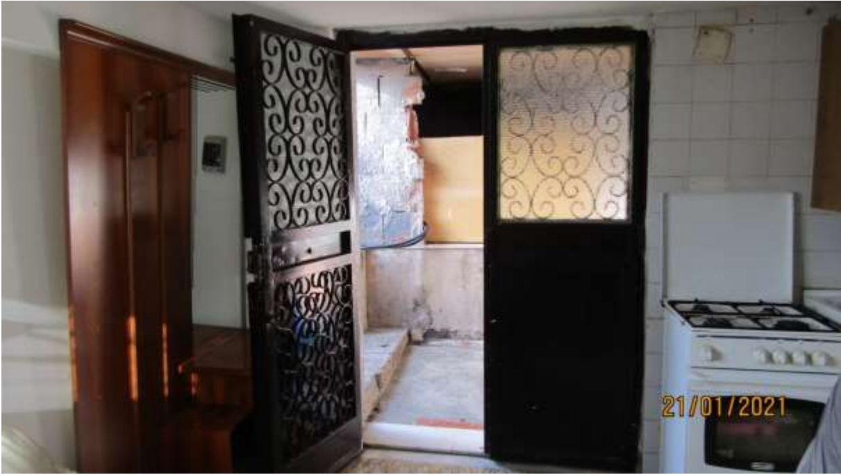
FO-L1-5 –INGRESSO AL PIANO SEMINTERRATO SUBALTERNO 2