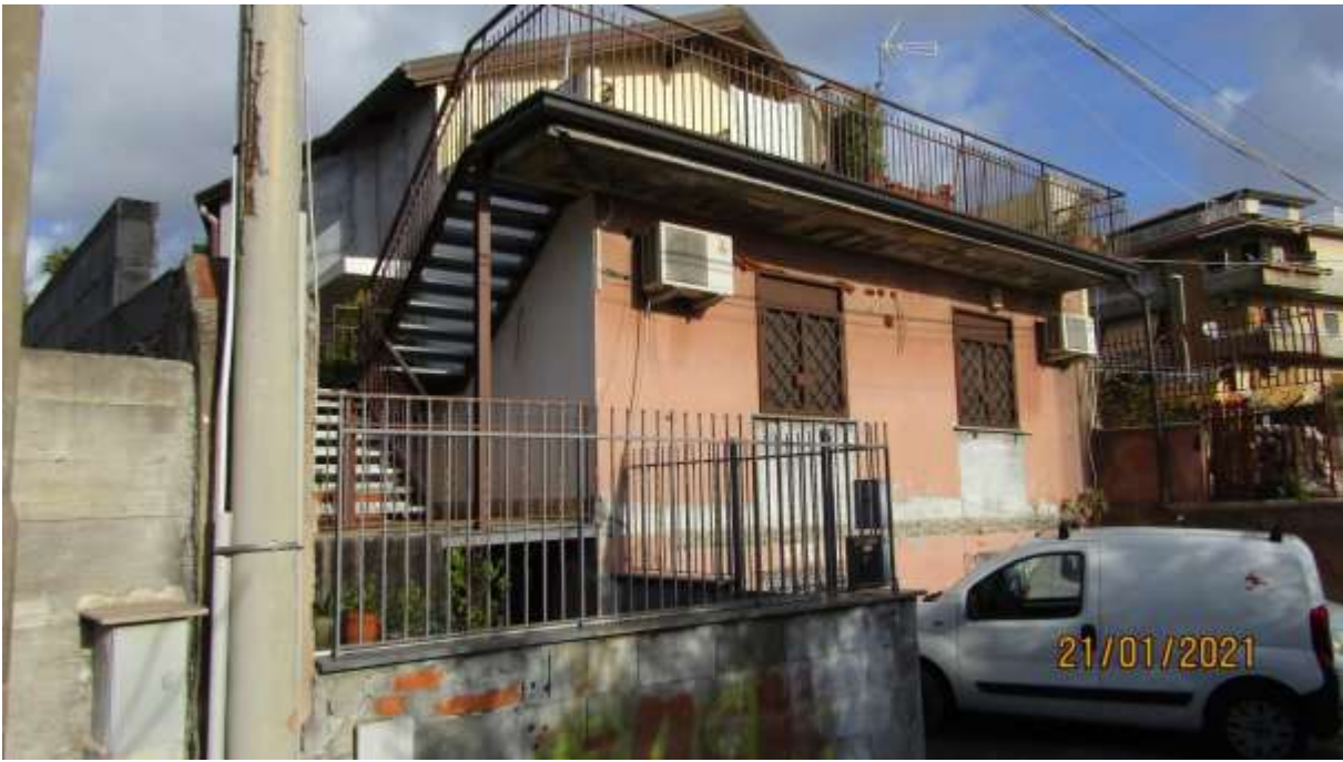
FO-L1-1 – ESTERNO DEL CORPO DI FABBRICA