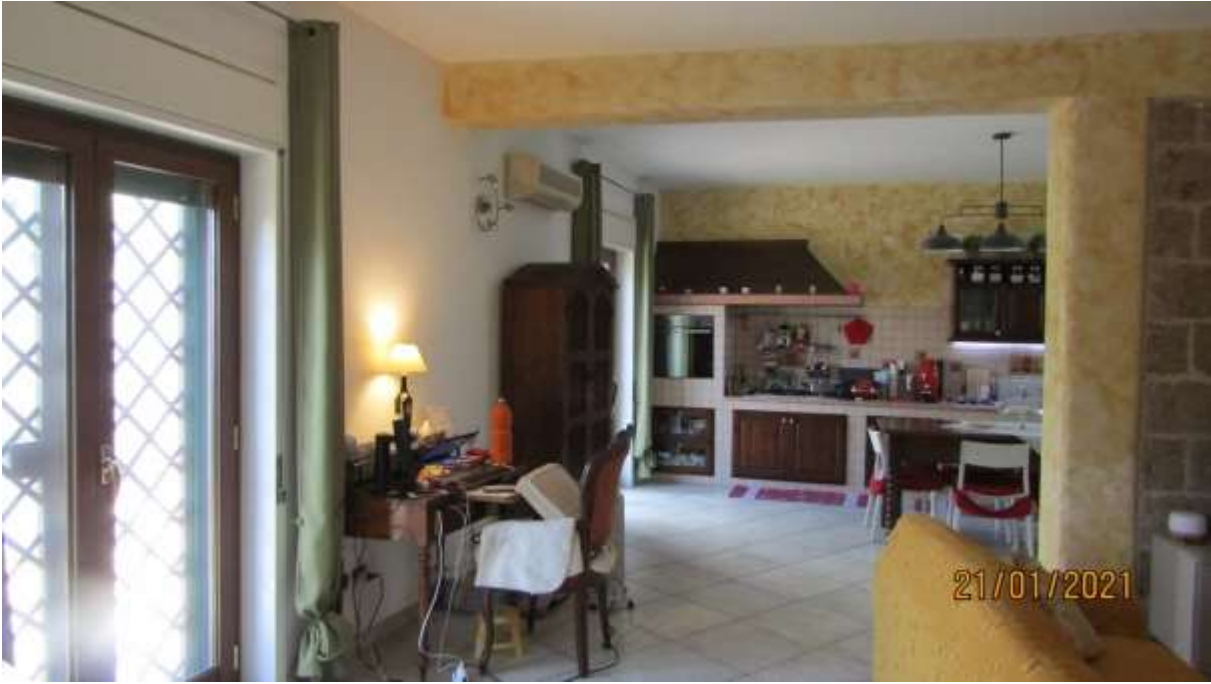
FO-L1-15 –INTERNO APPARTAMENTO AL PIANO TERRA SUBALTERNO 2