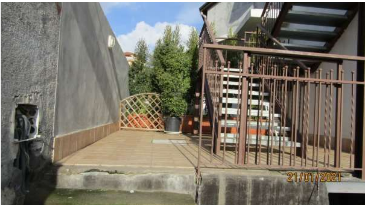
FO-L1-10 –PIANEROTTOLO AL PIANO TERRA DI INGRESSO ALL'APPARTAMENTO AL PIANO TERRA SUBALTERNO 2