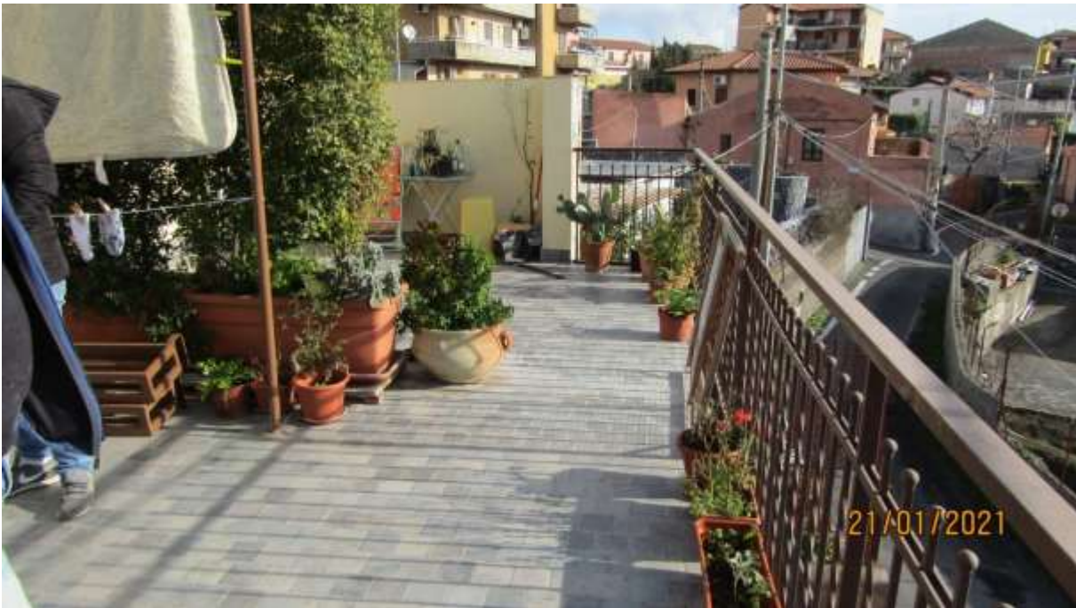
FO-L1-26 TERRAZZO LATO SUD PIANO PRIMO SUBALTERNO 3