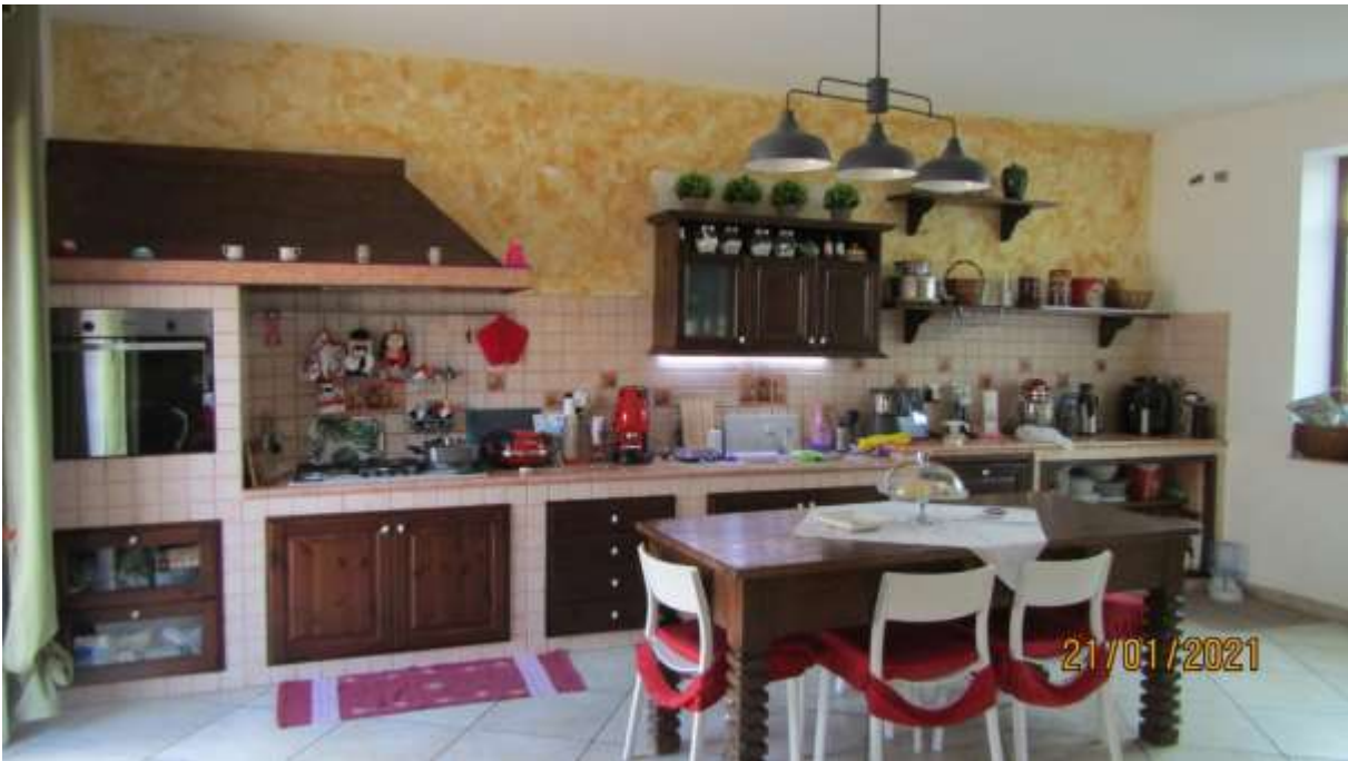
FO-L1-17 –ZONA CUCINA APPARTAMENTO AL PIANO TERRA SUBALTERNO 2