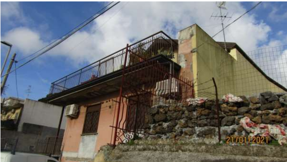
FO-L1-2 – ESTERNO DEL CORPO DI FABBRICA