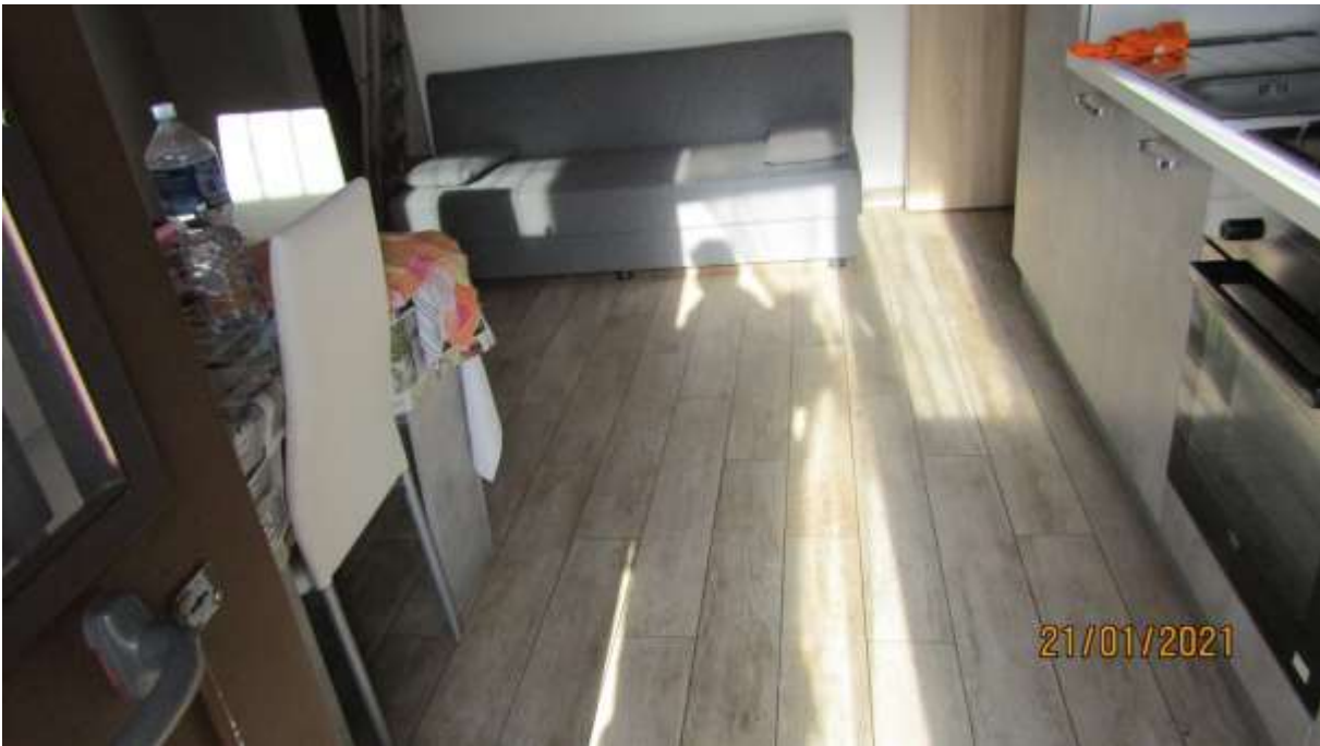
FO-L1-30 INTERNO APPARTAMENTO LATO OVEST PIANO PRIMO SUBALTERNO 3