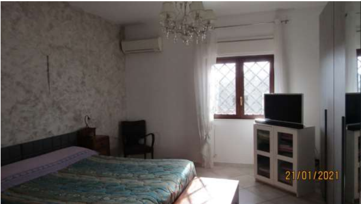
FO-L1-19 –VANO LETTO APPARTAMENTO AL PIANO TERRA SUBALTERNO 2