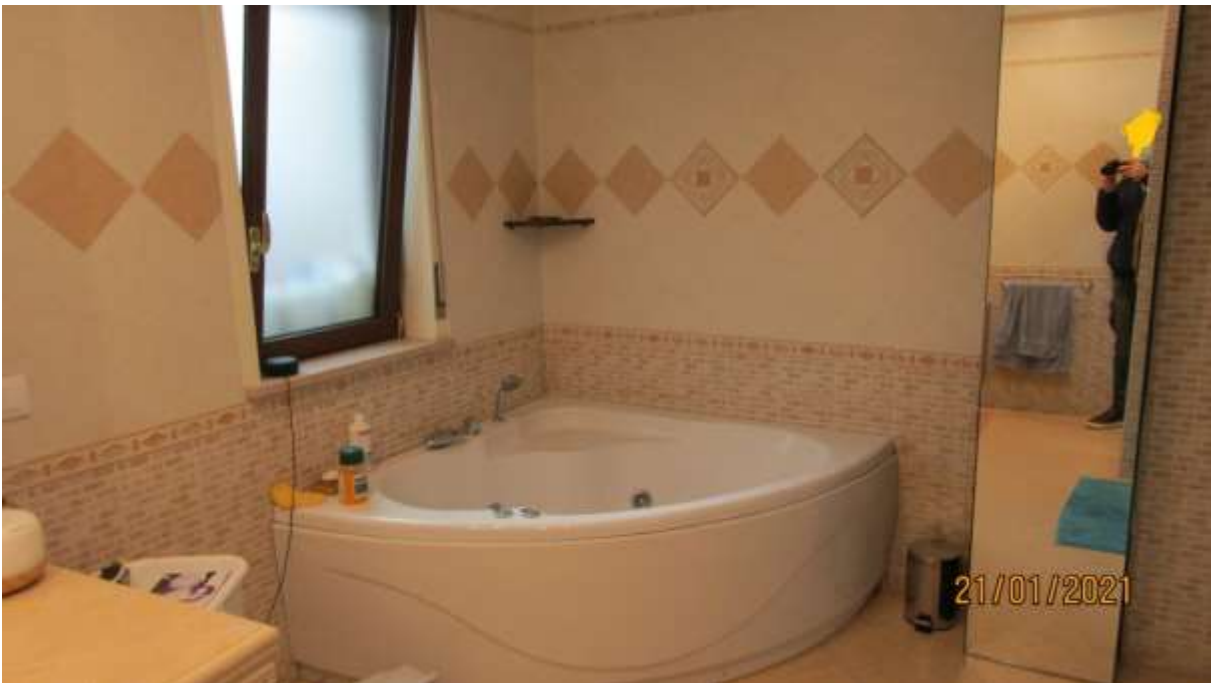
FO-L1-22 LOCALE WC APPARTAMENTO AL PIANO TERRA SUBALTERNO 2