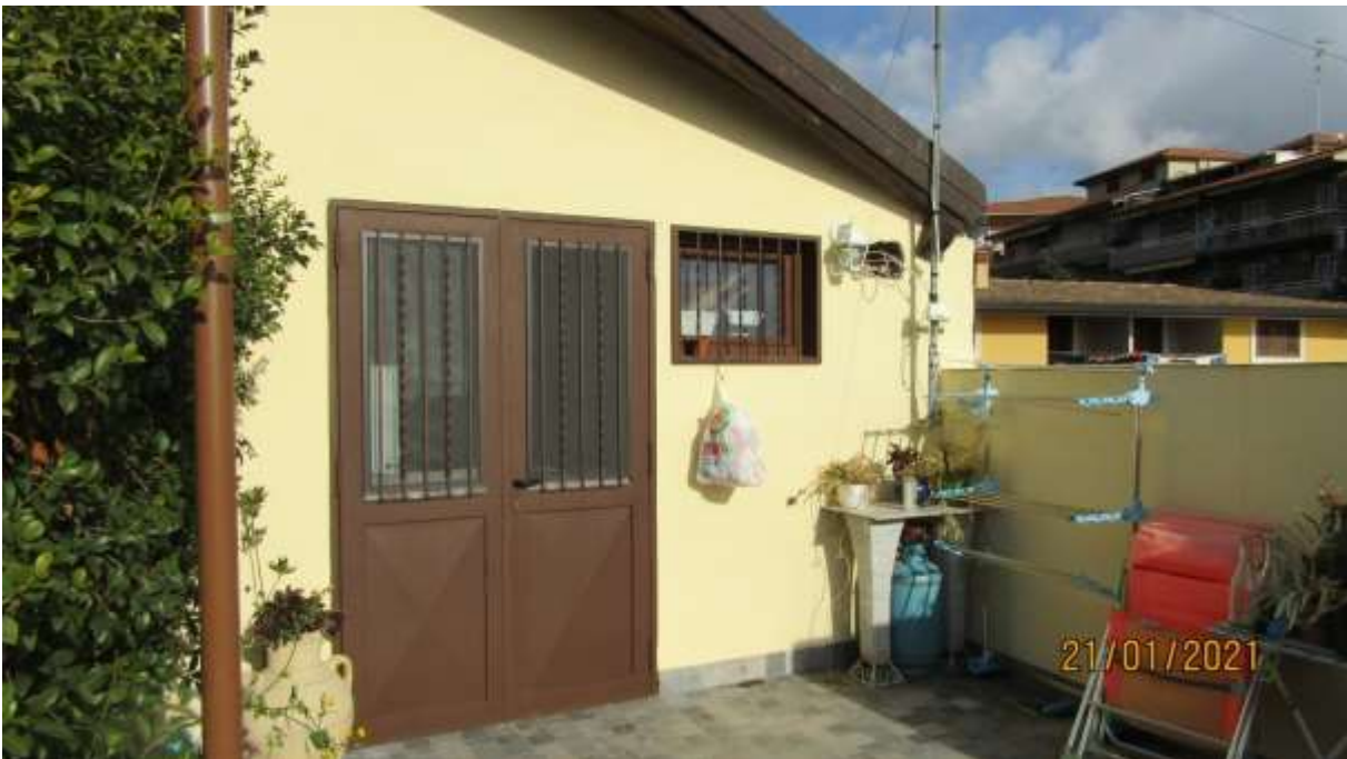
FO-L1-31 INGRESSO APPARTAMENTO LATO EST PIANO PRIMO SUBALTERNO 3