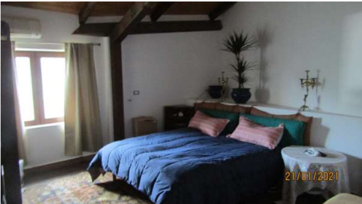
FO-L1-35 VANO LETTO APPARTAMENTO LATO EST PIANO PRIMO SUBALTERNO 3