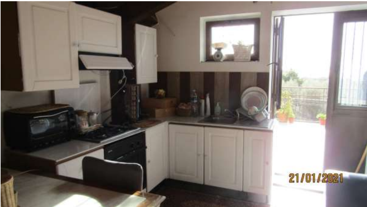
FO-L1-34 INTERNO APPARTAMENTO LATO EST PIANO PRIMO SUBALTERNO 3