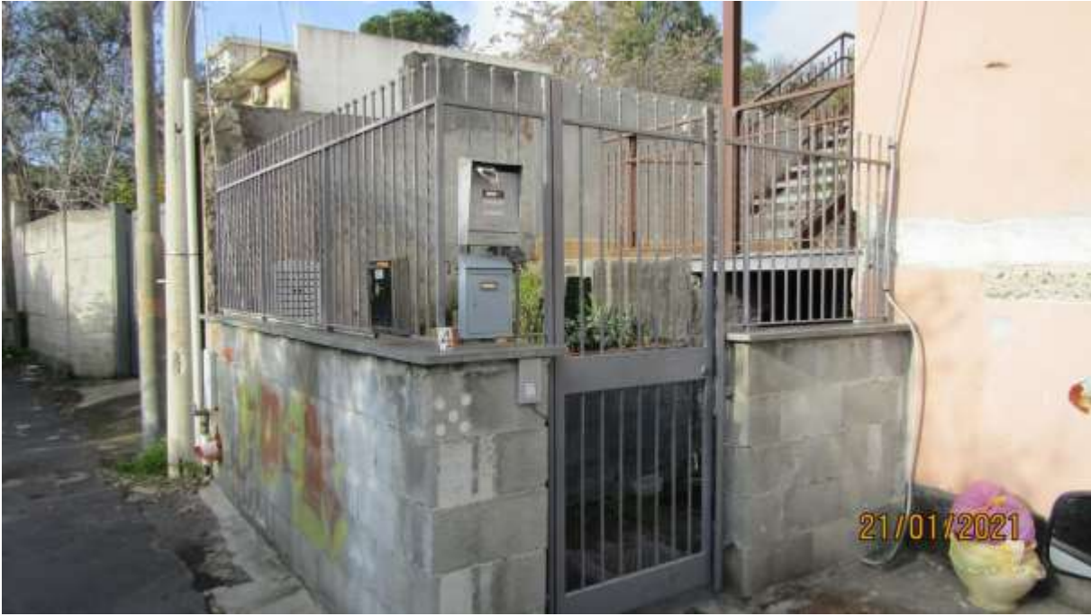
FO-L1-3- ESTERNO DEL CORPO DI FABBRICA – CANCELLETTO DI INGRESSO CIVICO 4 VIA SAN MARCO – FRAZIONE SAN GIOVANNI GALERMO DI CATANIA (CT)