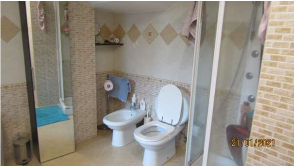
FO-L1-21 LOCALE WC APPARTAMENTO AL PIANO TERRA SUBALTERNO 2