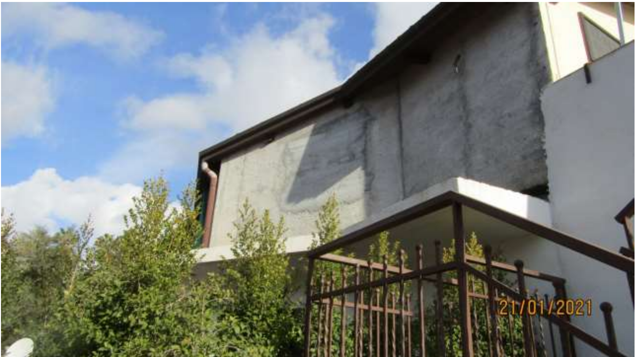
FO-L1-24 SCALA DI ACCESSO ESTERNA E LATO OVEST PIANO PRIMO SUBALTERNO 3