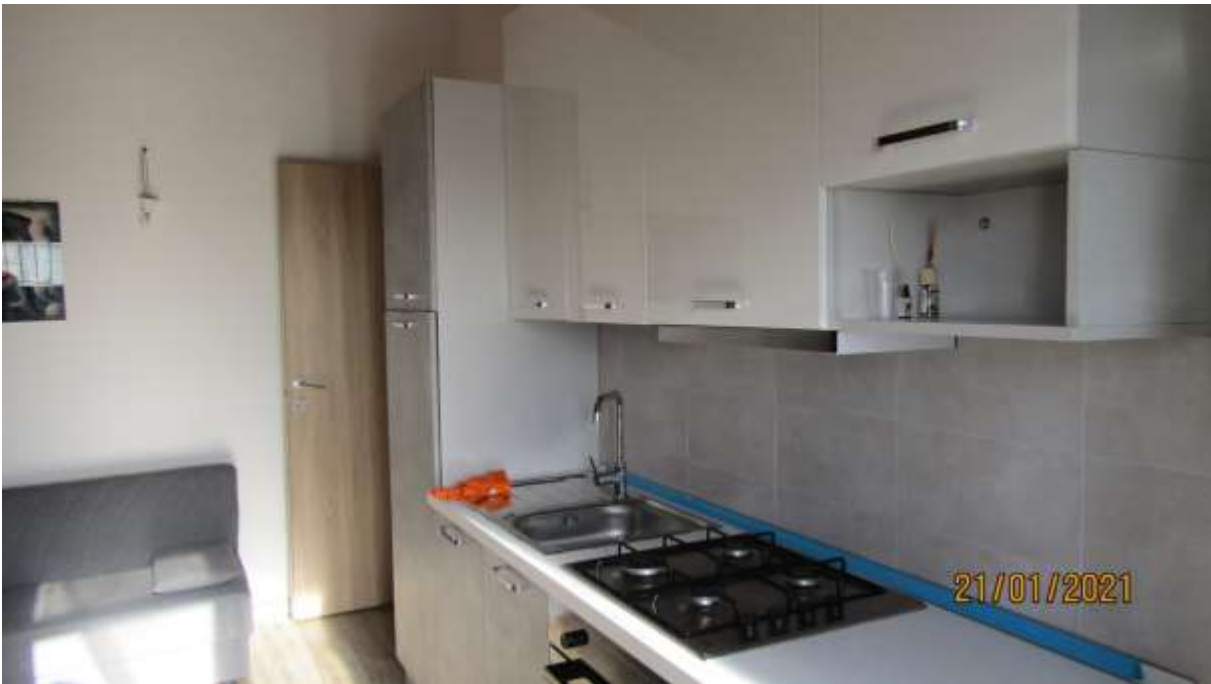
FO-L1-28 INTERNO APPARTAMENTO LATO OVEST PIANO PRIMO SUBALTERNO 3