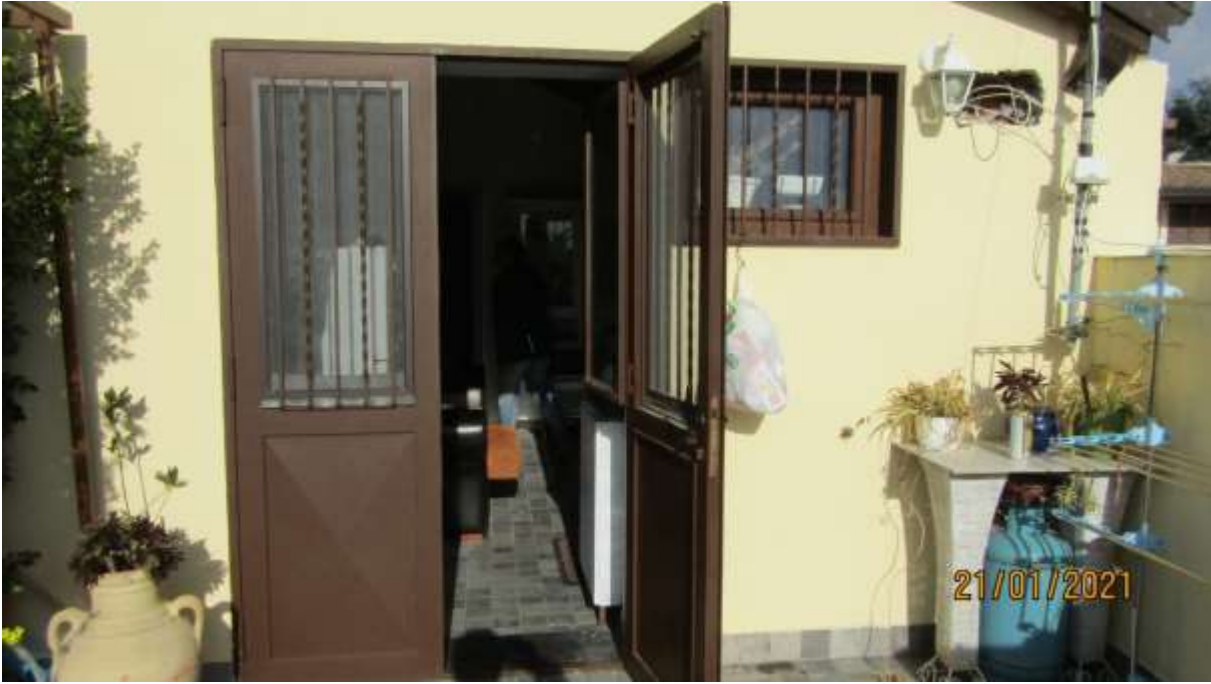
FO-L1-32 INGRESSO APPARTAMENTO LATO EST PIANO PRIMO SUBALTERNO 3