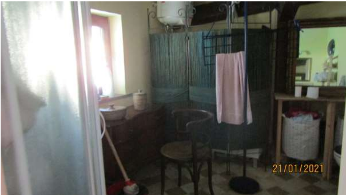
FO-L1-37 INTERNO APPARTAMENTO LATO EST PIANO PRIMO SUBALTERNO 3