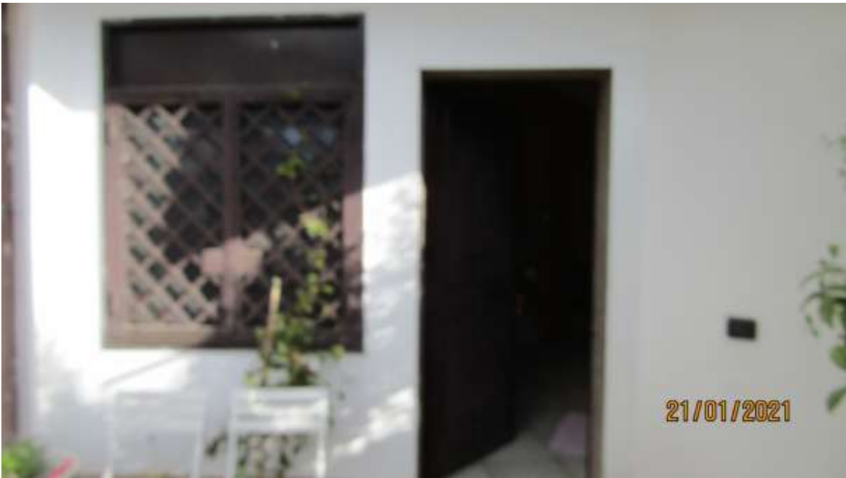
FO-L1-13 PORTA DI INGRESSO APPARTAMENTO AL PIANO TERRA SUBALTERNO 2