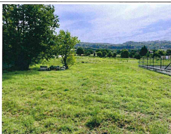
Documentazione fotografica - Vista n.5