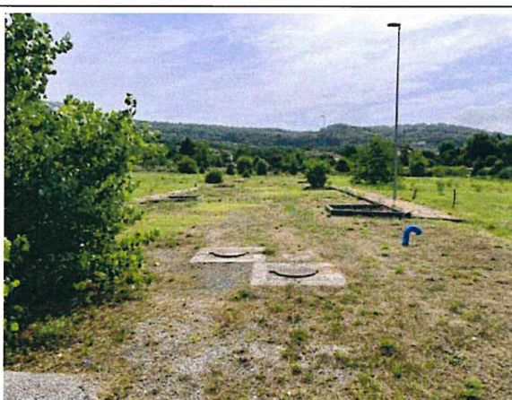
Documentazione fotografica - Vista n.7