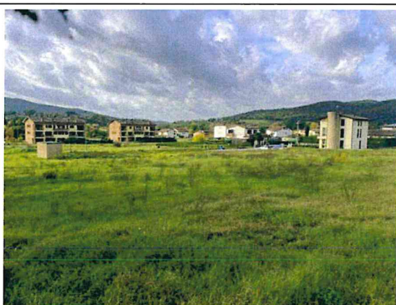
Documentazione fotografica - Vista n.1