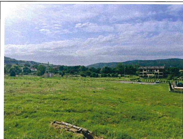
Documentazione fotografica - Vista n.4