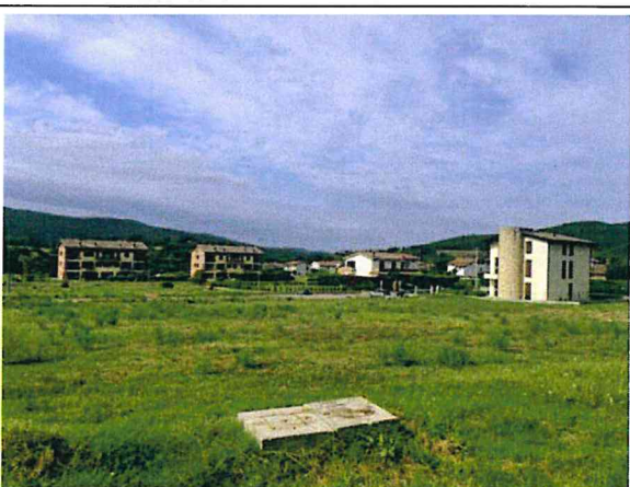
Documentazione fotografica - Vista n.3