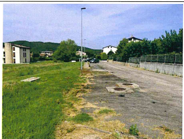
Documentazione fotografica - Vista n.2