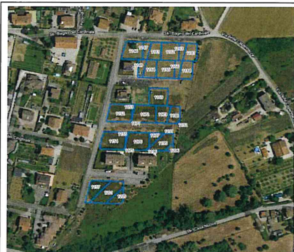
Ortofoto con identificazione dei mappali interessati