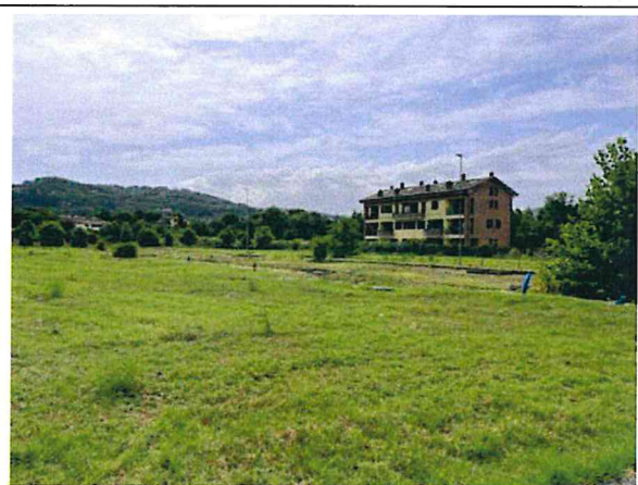
Documentazione fotografica - Vista n.6