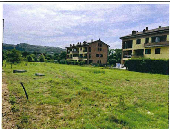
Documentazione fotografica - Vista n.8