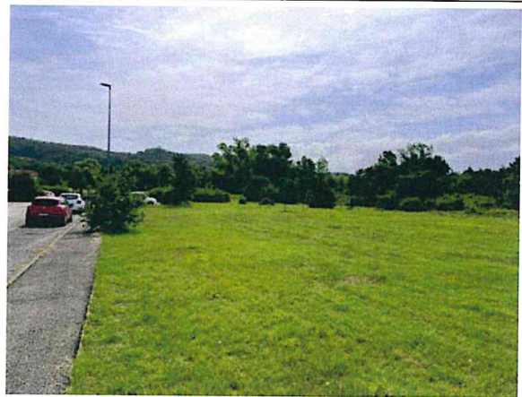
Documentazione fotografica - Vista n.11