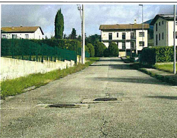
Documentazione fotografica - Vista n.9