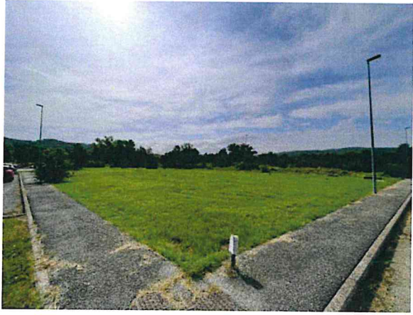
Documentazione fotografica - Vista n.10