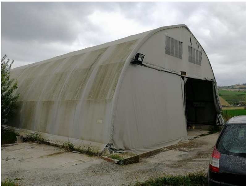
VISTA N.8 Terreno sito a S. Elpidio a Mare S. Elpidio a Mare Via Palombara con accessorio agricolo e Concessione Edilizia a carattere provvisorio