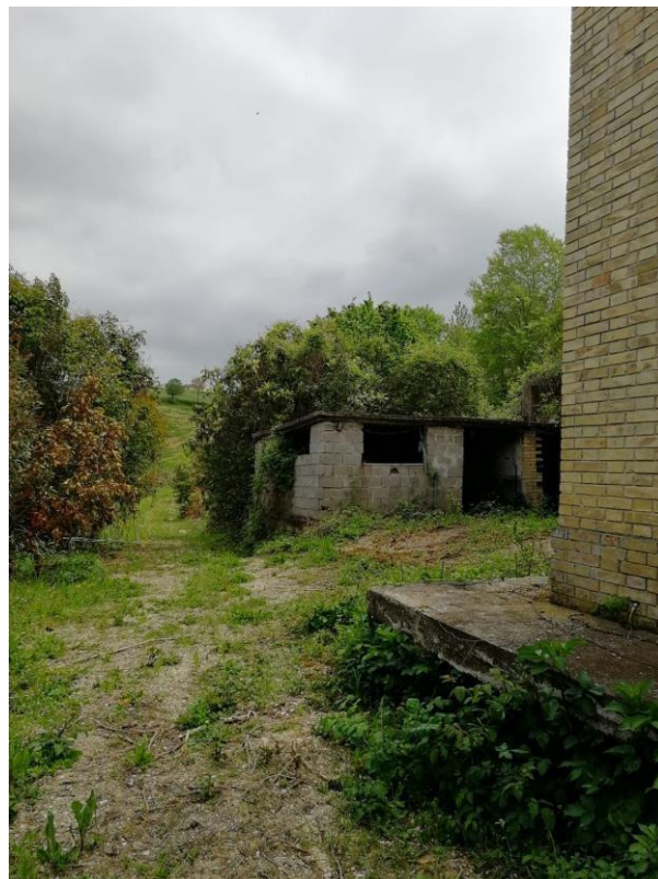
VISTA N.2 Vista esterna (fabbricato sito a Monterubbiano)