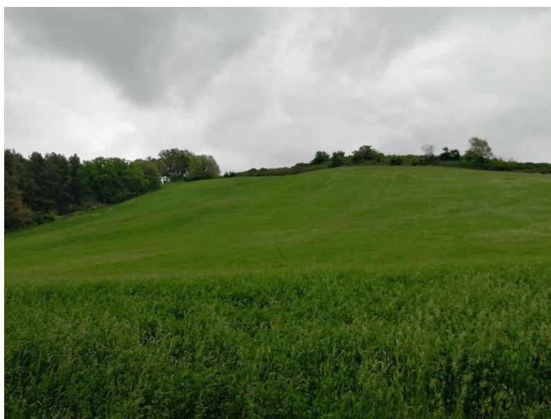
VISTA N.6 Terreno sito a S. Elpidio a Mare strade Cura Mostrapiedi e Cerretino