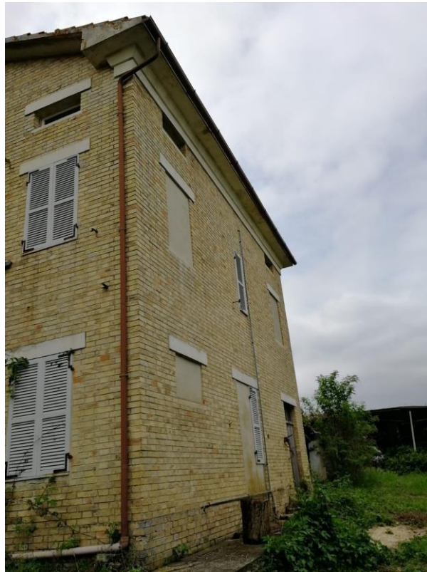
VISTA N.3 Vista esterna (Fermo)