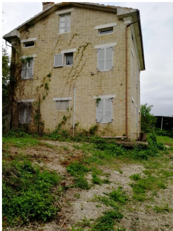
VISTA N.4 Vista esterna (fabbricato sito a Monterubbiano)

STUDIO TECNICO ING. FRANCESCO CICALÈ VIALE DELLA REPUBBLICA 18 - 63814 TORRE S. PATRIZIO (FM) Tel e fax: +390734510184 CELL. +393332523636, C.F.: CCCFNC63L06L279Q P.I.: 01516120449 E-MAIL: francescociccale1@gmail.com