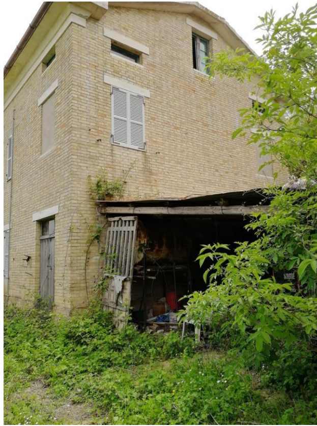
VISTA N.1 Vista esterna (fabbricato sito a Monterubbiano)