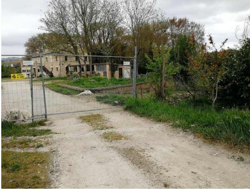
VISTA N.7 Terreno sito a S. Elpidio a Mare S. Elpidio a Mare strade Cura Mostrapiedi e Cerretino (la casa non è di proprietà [REDACTED] [REDACTED])