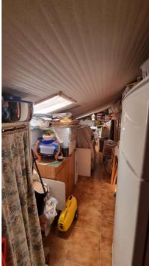
Vista ripostiglio/soffitta collegato direttamente con vano cucina