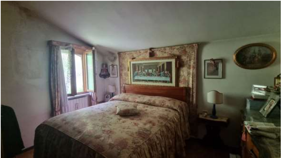
Vista camera letto matrimoniale