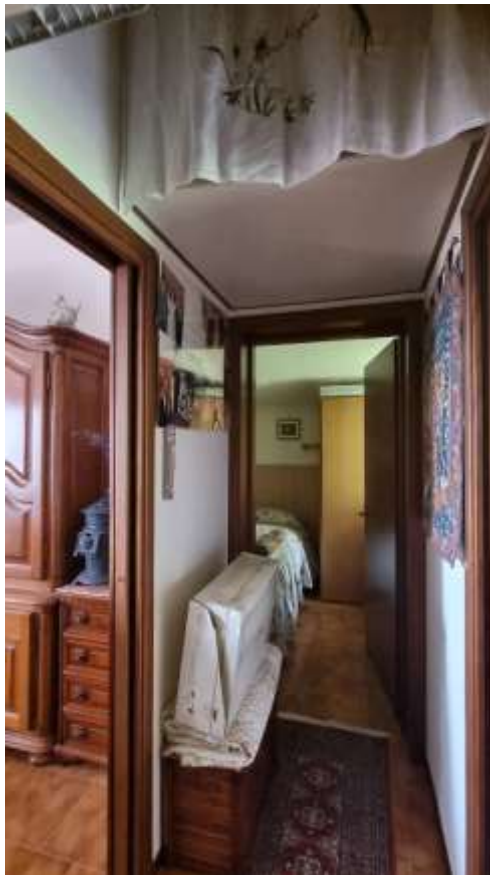
Vista disimpegno zona notte