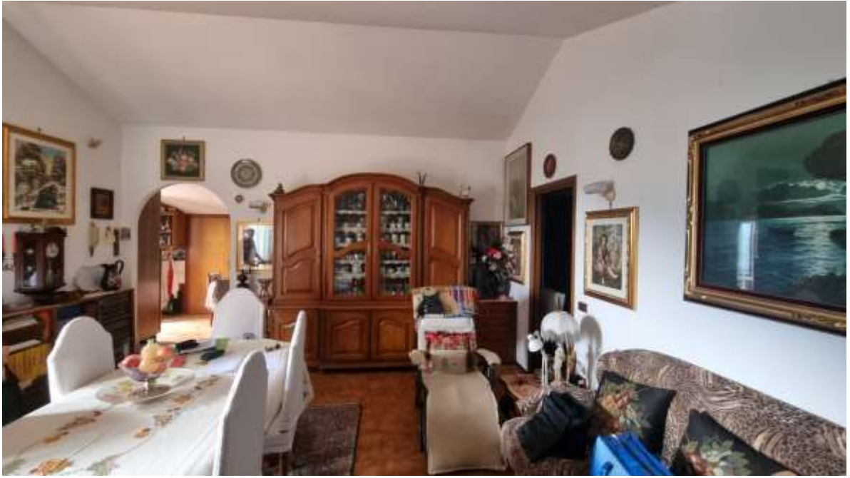
Vista soggiorno-pranzo con accesso a vano cucina e zona notte