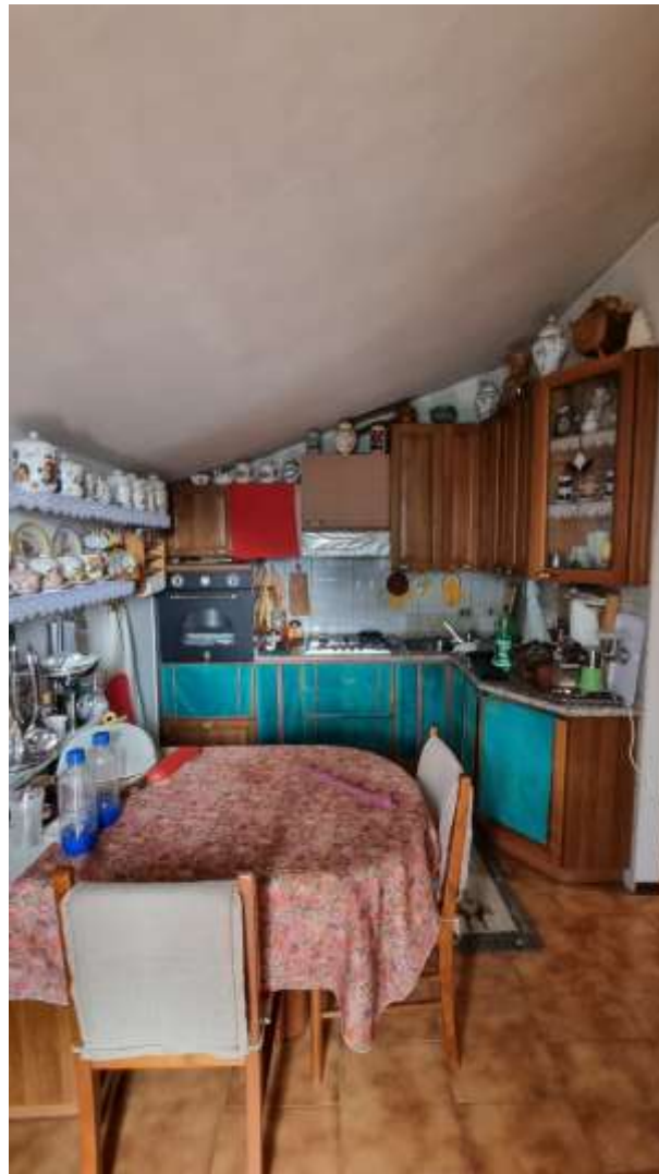
Vista vano cucina