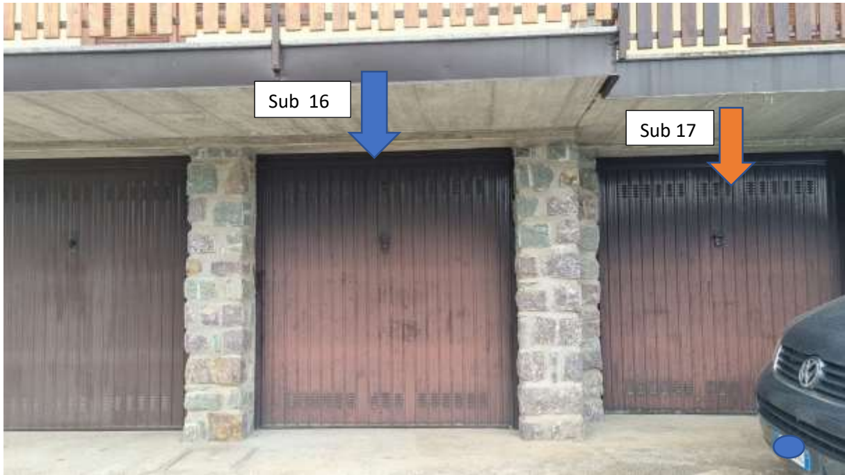
Vista autorimesse sub 16 e sub 17 al piano strada (seminterrato)