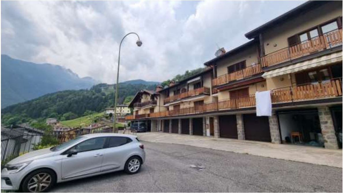
Vista d'insieme condominio Panoramico – via Pizzo Salina, 9-11