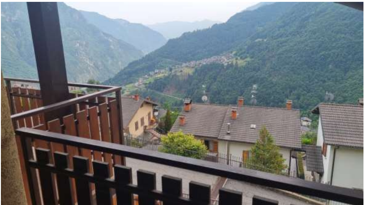
Vista panoramica dai balconi di proprietà (affaccio sud)