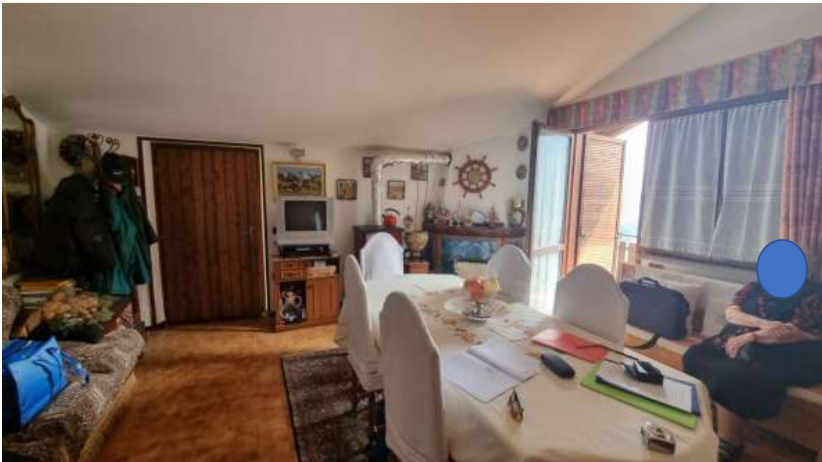
Vista locale soggiorno-pranzo con accesso al balcone