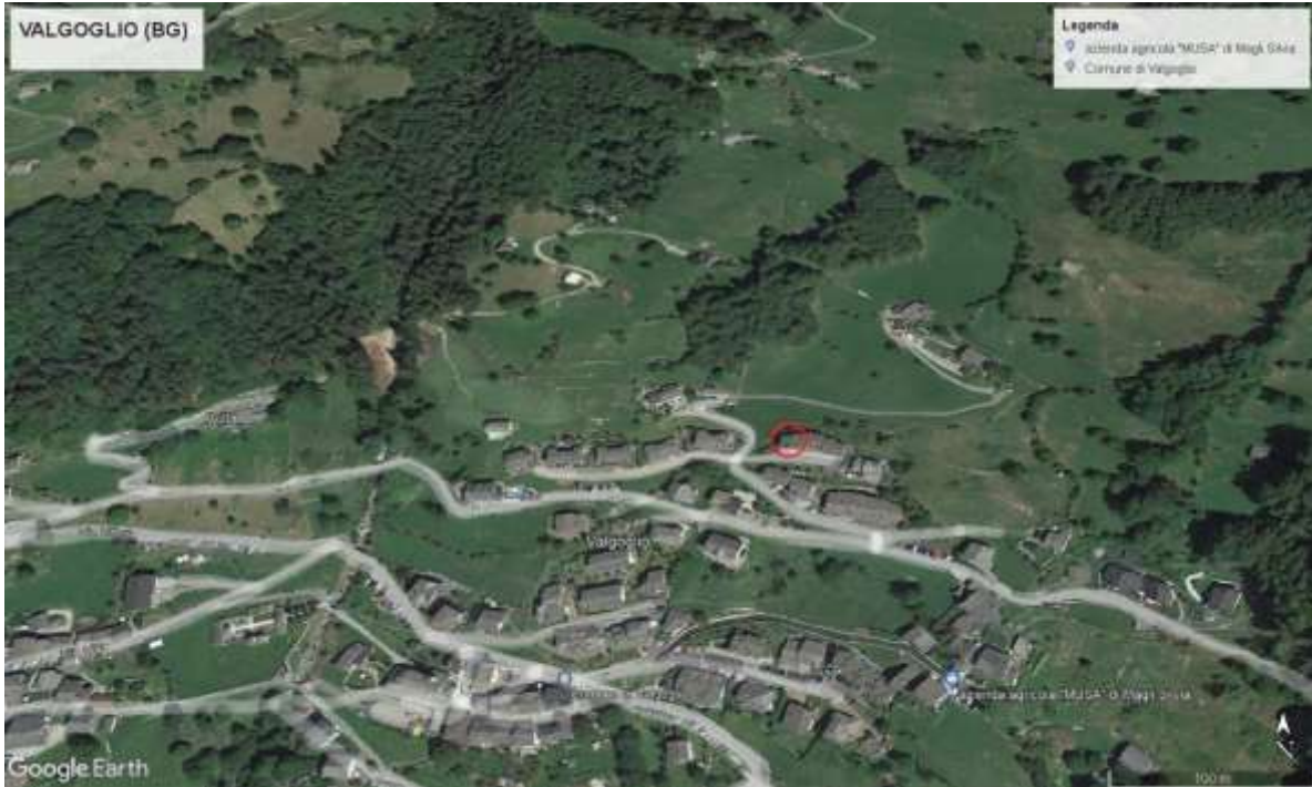
Vista aerea della ubicazione immobile rispetto alla zona centrale di Valgoglio

immobile sito in comune di Valgoglio (BG) – via Pizzo Salina, 9