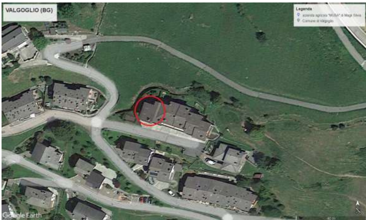
Vista aerea dell'immobile in perizia