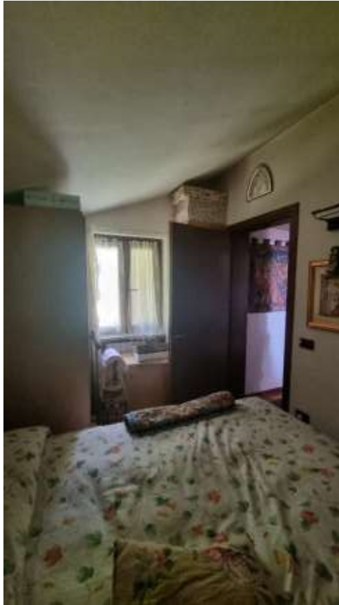
Vista vano ripostiglio/guardaroba usato come seconda camera