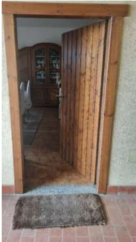
Vista portoncino ingresso appartamento p. 1°