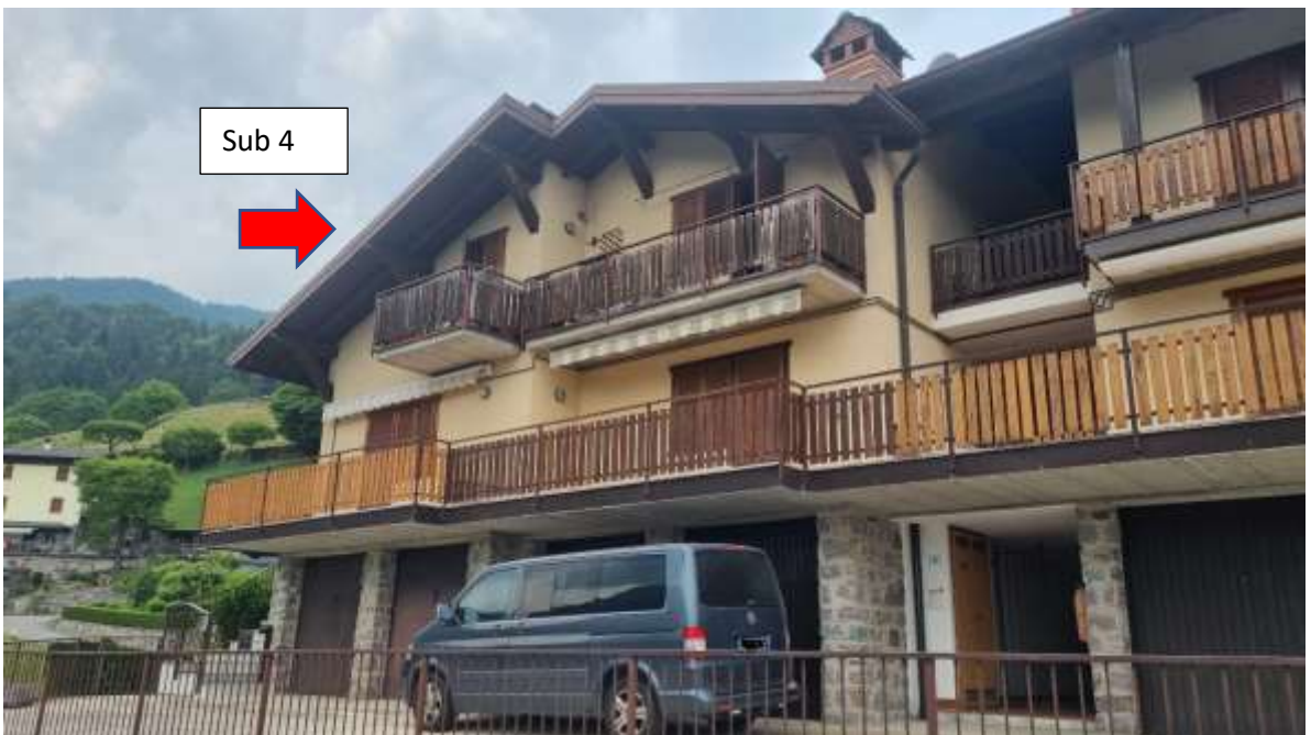
Vista dettaglio immobile pignorato – piano 1°/sottotetto