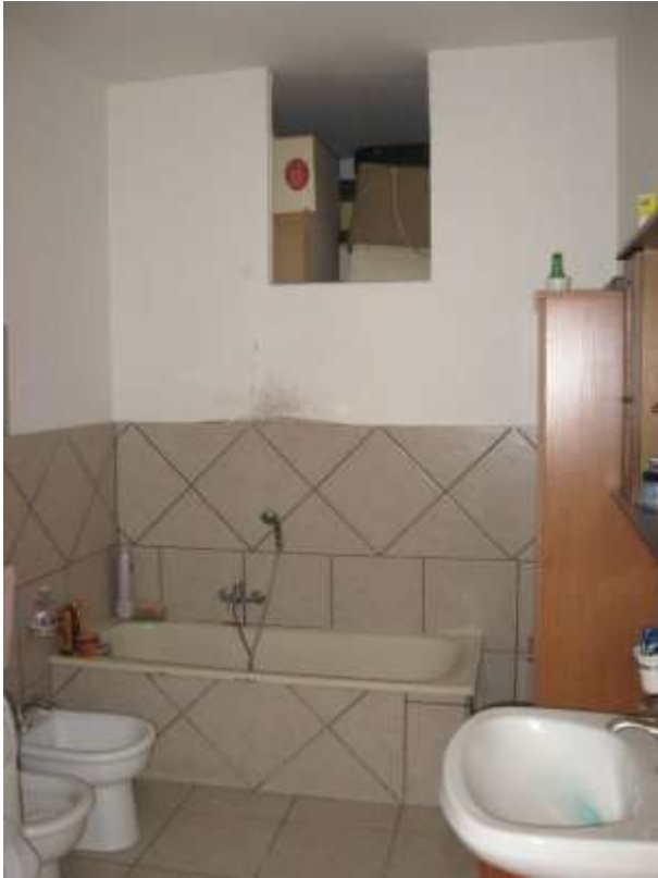
Figura 17 bagno dell'appartamento al piano terra