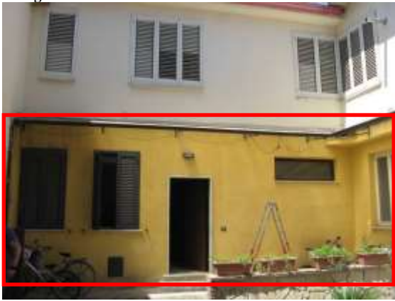
Figura 5 facciata est del fabbricato prospiciente il cortile comune