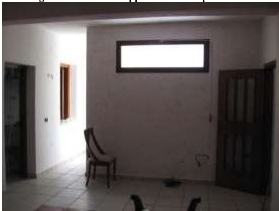
Figura 11 salone dell'appartamento al piano terra