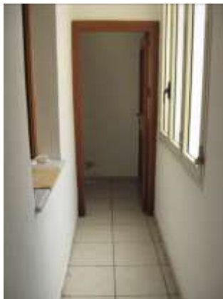
Figura 19 disimpegno dell'appartamento al piano terra