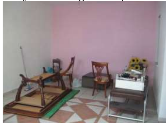
Figura 12 salone dell'appartamento al piano terra