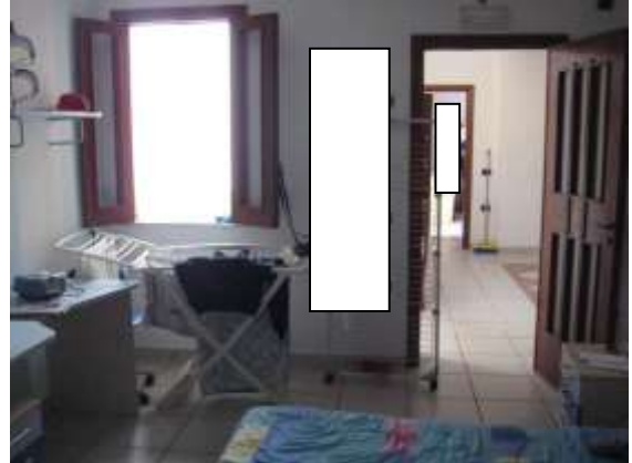
Figura 16 camera da letto 2 dell'appartamento al piano terra