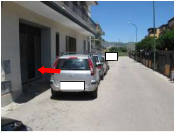
Figura 1 accesso all'androne comune via A. Volta n. 17