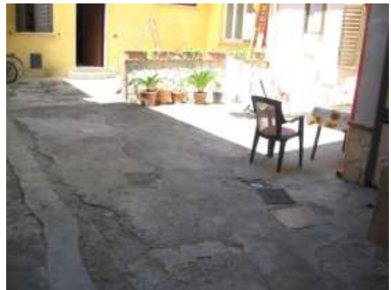
Figura 4 androne e cortile comuni