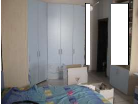
Figura 15 camera da letto 2 dell'appartamento al piano terra