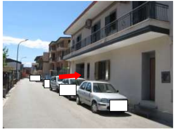
Figura 2 accesso all'androne comune via A. Volta n. 17