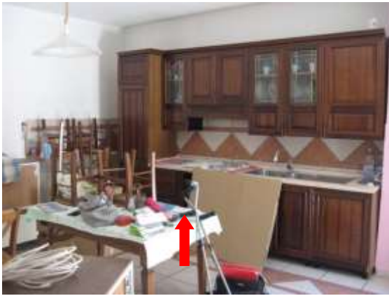
Figura 9 cucina dell'appartamento al piano terra