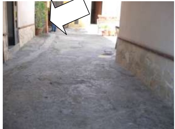
Figura 20 eventuale realizzazione della scala di accesso alla cantinola dal cortile comune