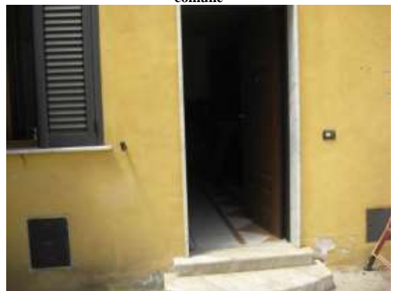
Figura 8 accesso all'appartamento al piano terra