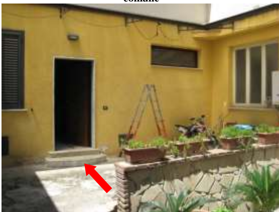
Figura 7 facciata nord/est del fabbricato