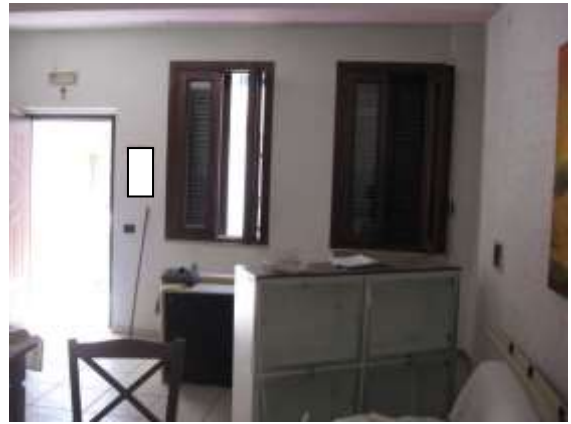
Figura 10 cucina dell'appartamento al piano terra