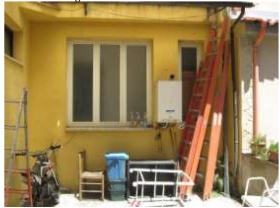
Figura 6 facciata nord del fabbricato prospiciente il cortile comune