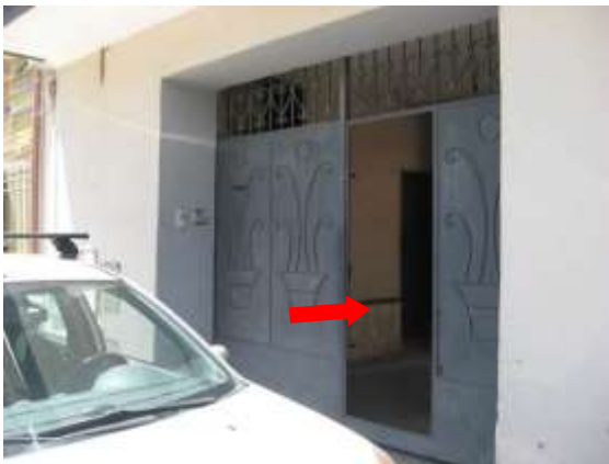
Figura 3 accesso dall'androne comune via A. Volta n.17