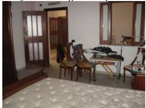
Figura 14 camera da letto 1 dell'appartamento al piano terra