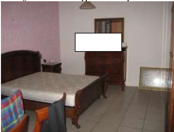
Figura 13 camera da letto 1 dell'appartamento al piano terra