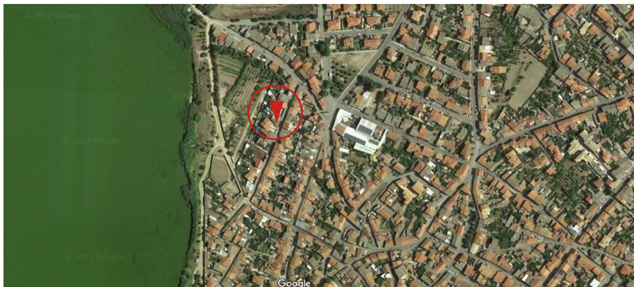
Inquadramento urbanistico su foto aerea

Studio tecnico di ingegneria e architettura: Gianluigi Porcu, Ingegnere