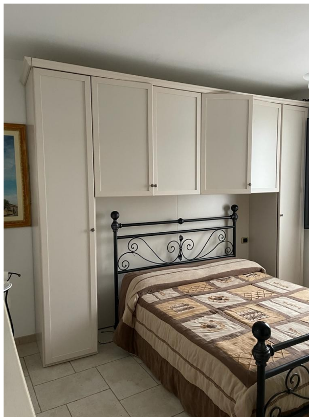
Foto 8_ Vista camera sx cu cortile interno