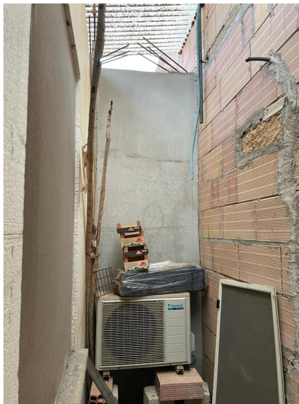
Foto 10_ Vista pozzo luce