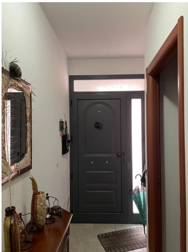
Foto 3 _ Vista ingresso