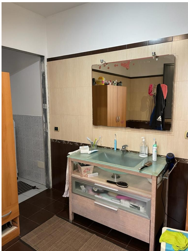
Foto 13_ Vista bagno