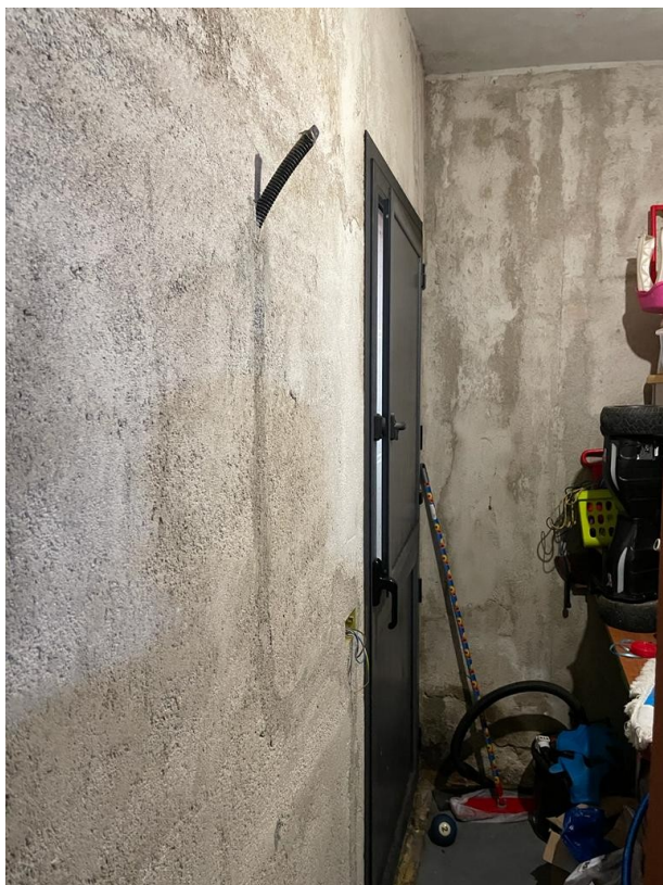
Foto 9_ Vista disimpegno