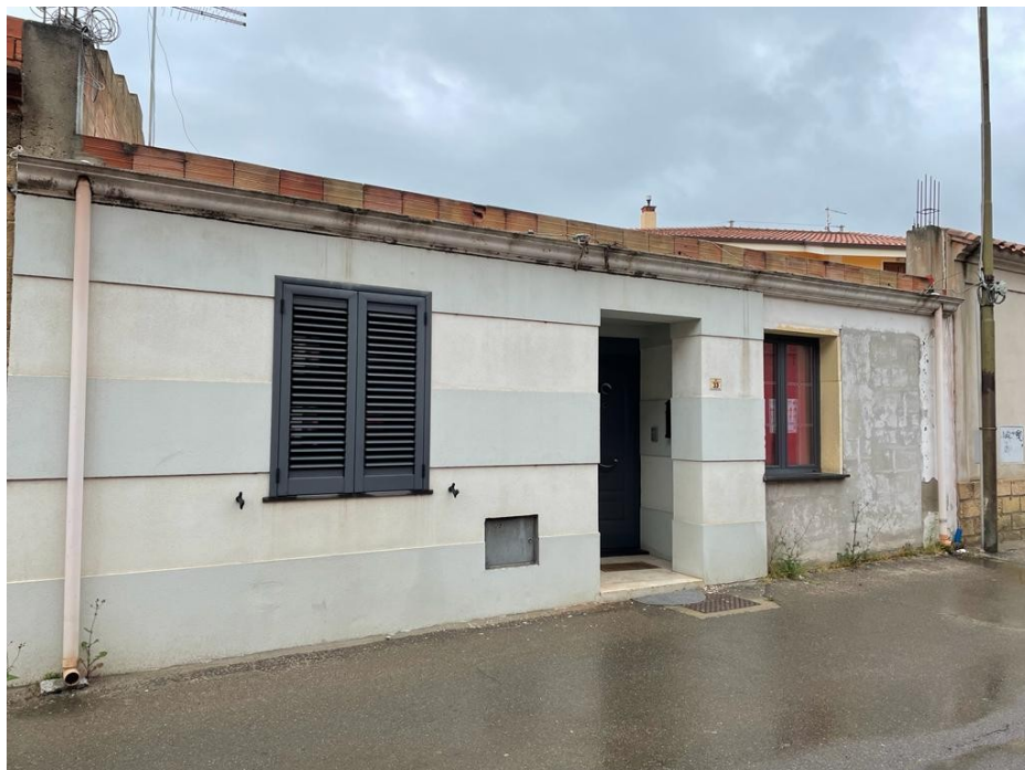
Foto 1_Prospetto su via Alagon