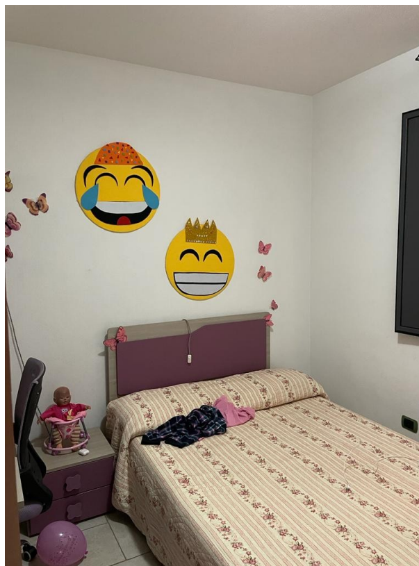
Foto 6 _ Vista camera sx su pozzo luce