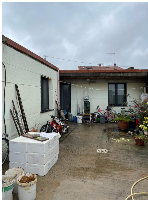
Foto 16_ Prospetto interno da cortile