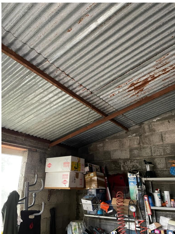
Foto 19_ Vista magazzino