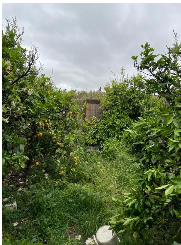
Foto 20_ Vista cortile retrostante