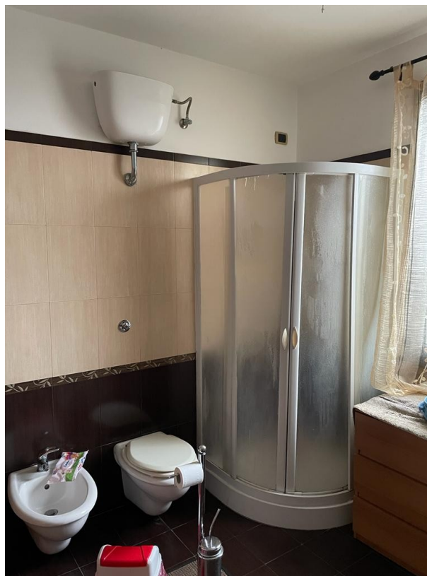
Foto 14_ Vista bagno