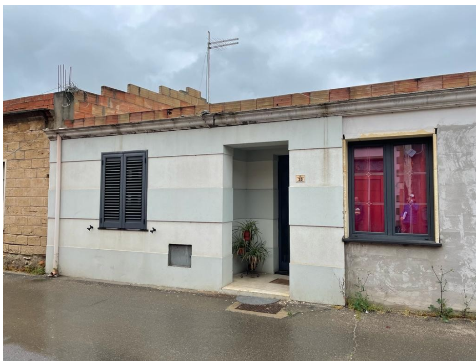
Foto 2_Prospetto su via Alagon