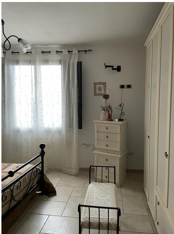
Foto 7_ Vista camera sx cu cortile interno