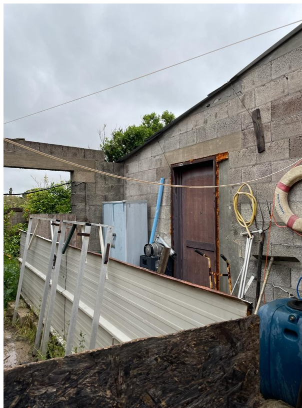
Foto 18_ Vista particolare magazzino