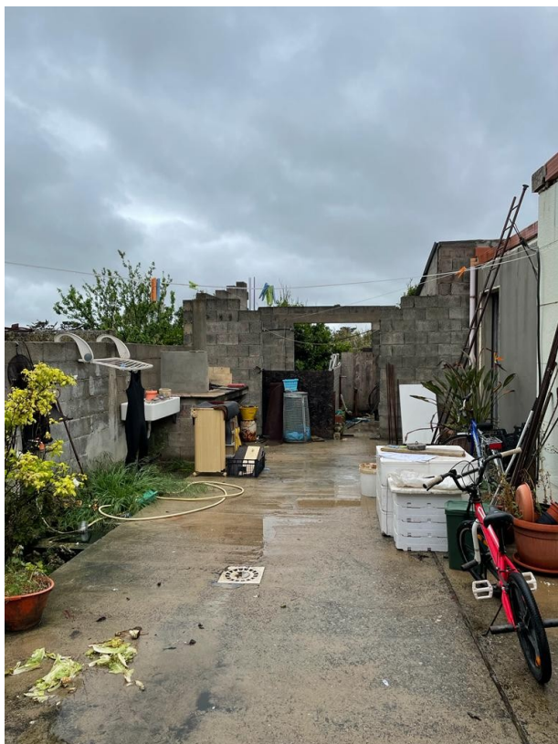
Foto 17_ Vista cortile