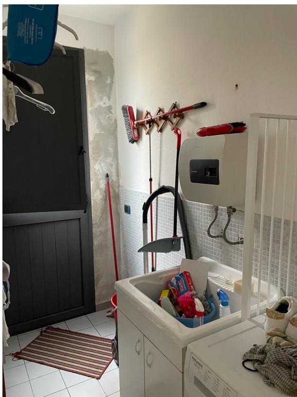
Foto 15_ Vista lavanderia