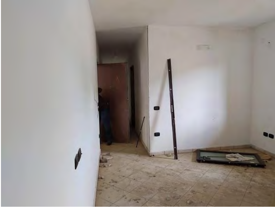
FOTO N. 7 – Vista in controcampo del soggiorno dell'appartamento sub. 23