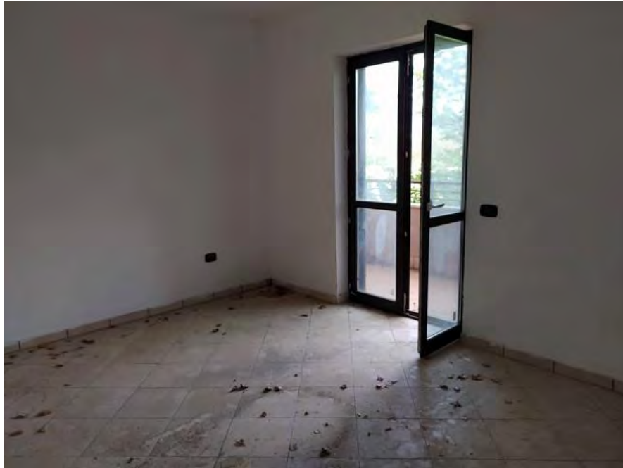
FOTO N. 11 – Terza camera da letto dell'appartamento sub. 23 (annessa dal sub. 22)