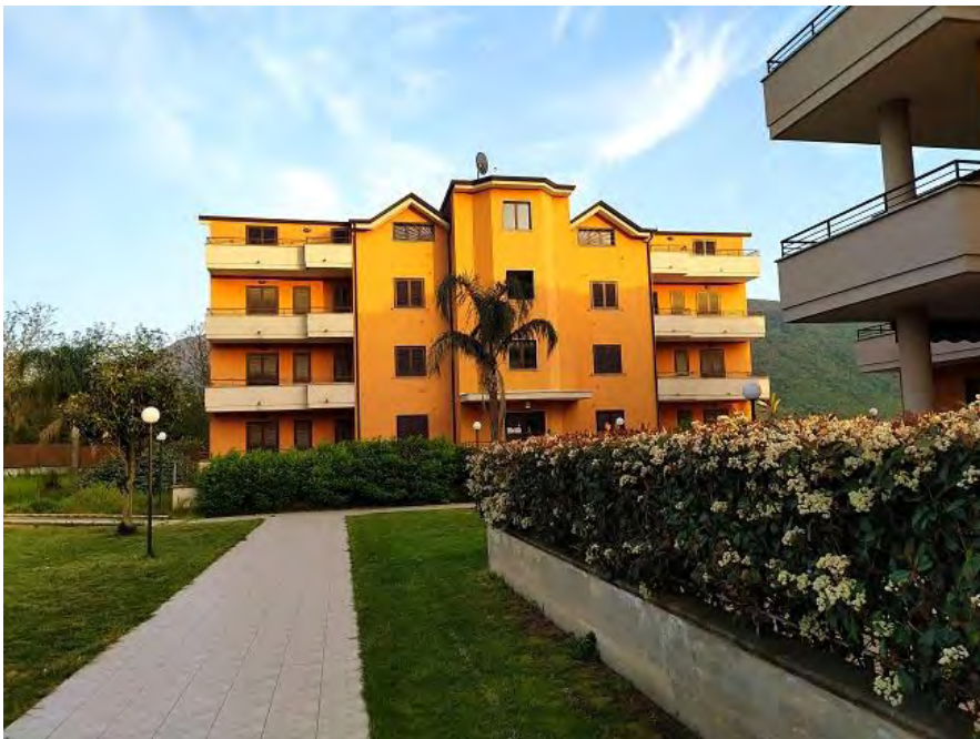
FOTO N. 18 – Il fabbricato di cui fanno parte le unità immobiliari pignorate