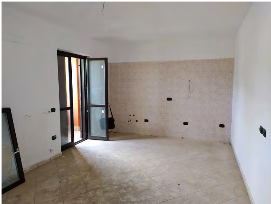
FOTO N. 6 – Soggiorno con angolo cottura dell'appartamento sub. 23