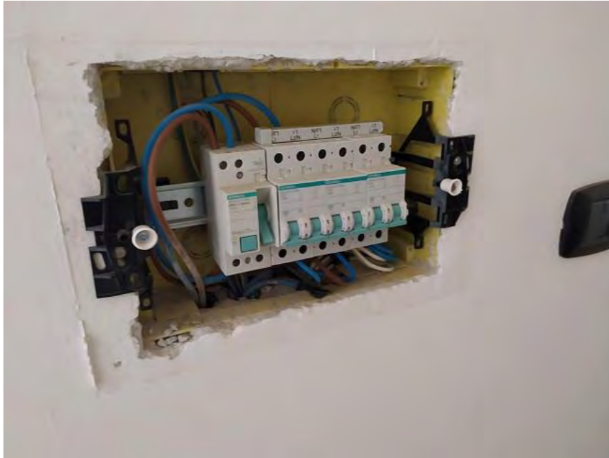
FOTO N. 13 – Dettaglio del quadro elettrico dell'appartamento sub. 23