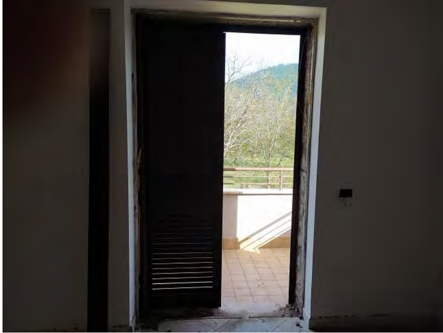
FOTO N. 29 – Dettaglio di una delle porte finestra asportata dell'appartamento sub. 11