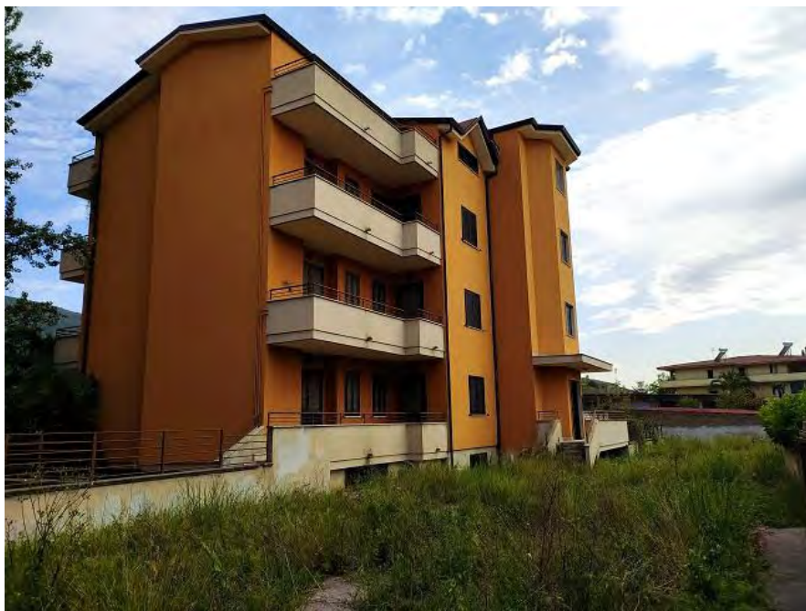
FOTO N. 2 – Il fabbricato di cui fanno parte gli immobili pignorati