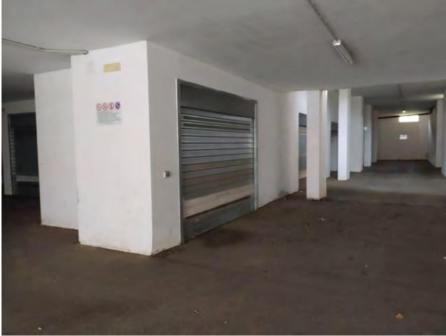
FOTO N. 33 – Vista del box auto sub. 39 dalla corsia comune di manovra