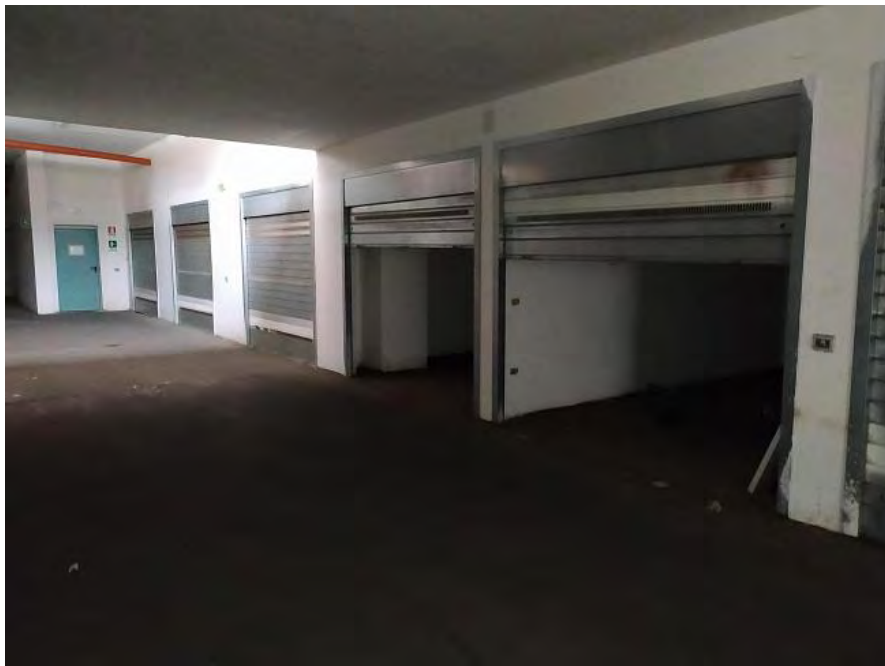
FOTO N. 30 – Vista dei box auto subb. 42 e 43 dalla corsia comune di manovra