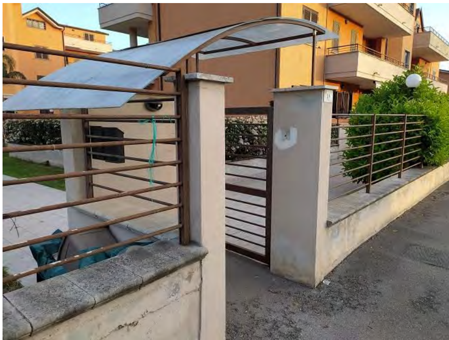
FOTO N. 1 – Uno dei cancelli di ingresso del “Parco Rossella” – Via San Marco 19