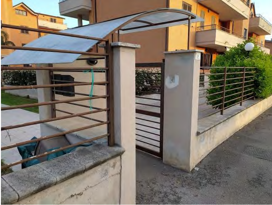
FOTO N. 17 – Uno dei cancelli di ingresso del “Parco Rossella” – Via San Marco 19