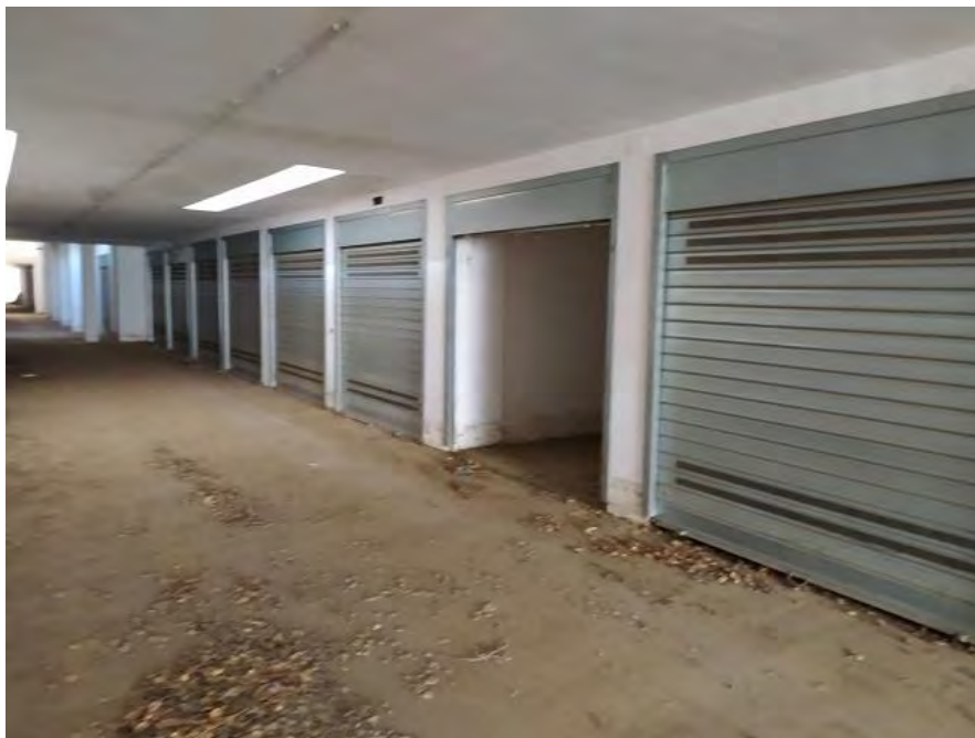
FOTO N. 15 – Vista del box auto sub. 36 dalla corsia comune di manovra