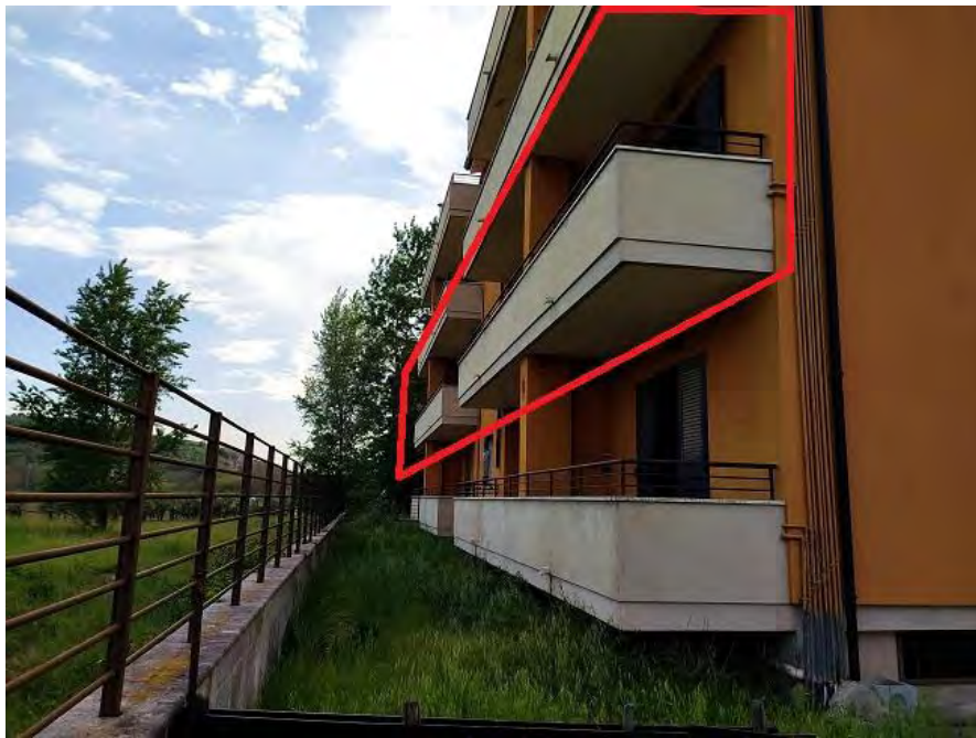
FOTO N. 4 – Evidenziazione grafica della posizione dell'appartamento sub. 23