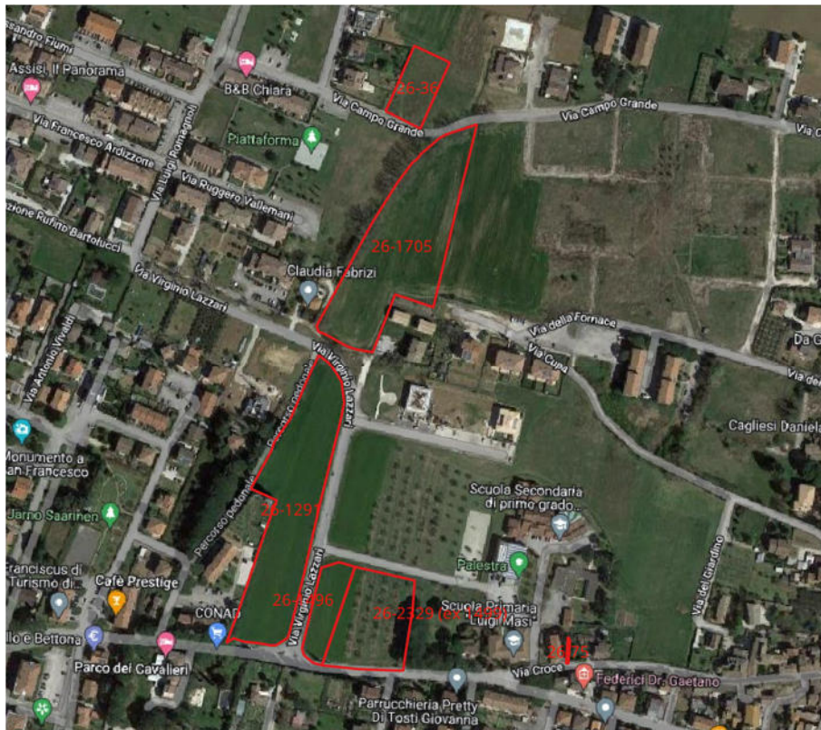
Ortofoto con identificazione dei terreni