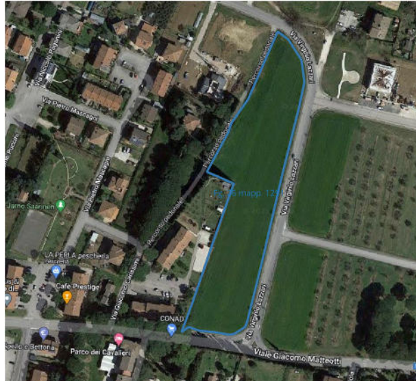
Ortofoto con identificazione del mappale 1291