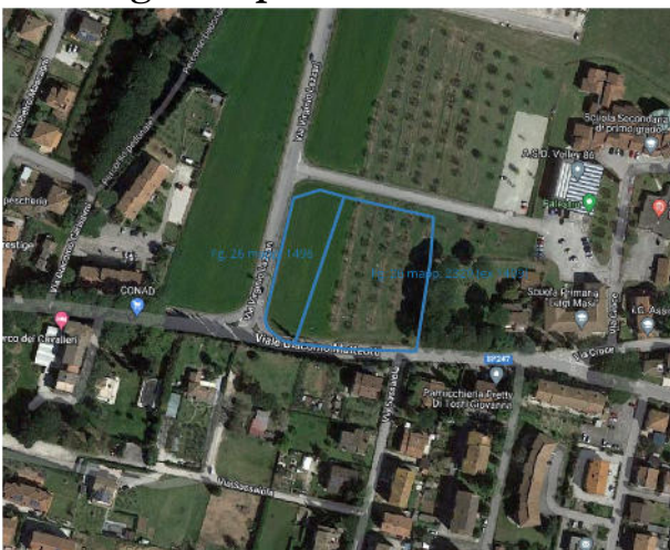
Ortofoto con identificazione del mappale 1496-2329