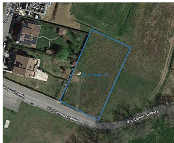
Ortofoto con identificazione del mappale 36