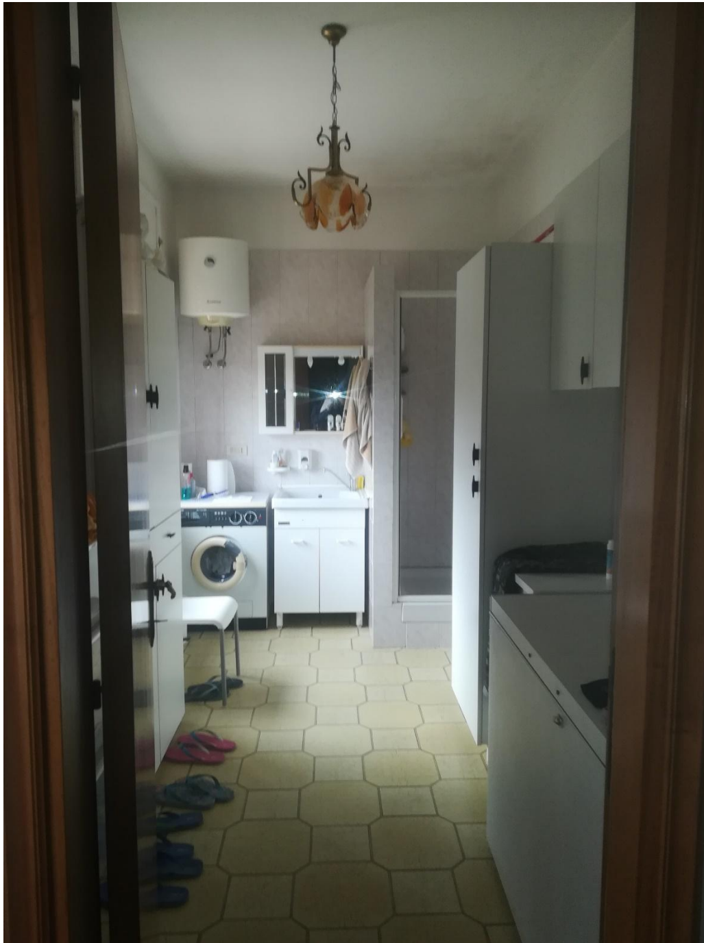
PIANO PRIMO : RIPOSTIGLIO CON ACCESSO DAL VANO SCALE CONDOMINIALE