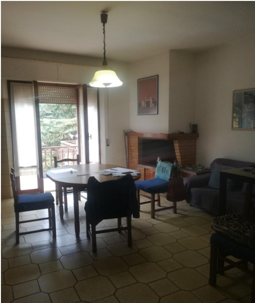
PIANO PRIMO : INGRESSO /CUCINA /ZONA GIORNO