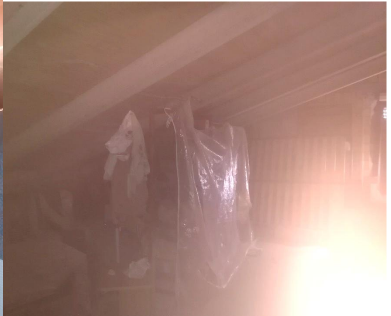
PIANO SECONDO (SOTTOTETTO) : PORZIONE DI SOFFITTA INDIVISA