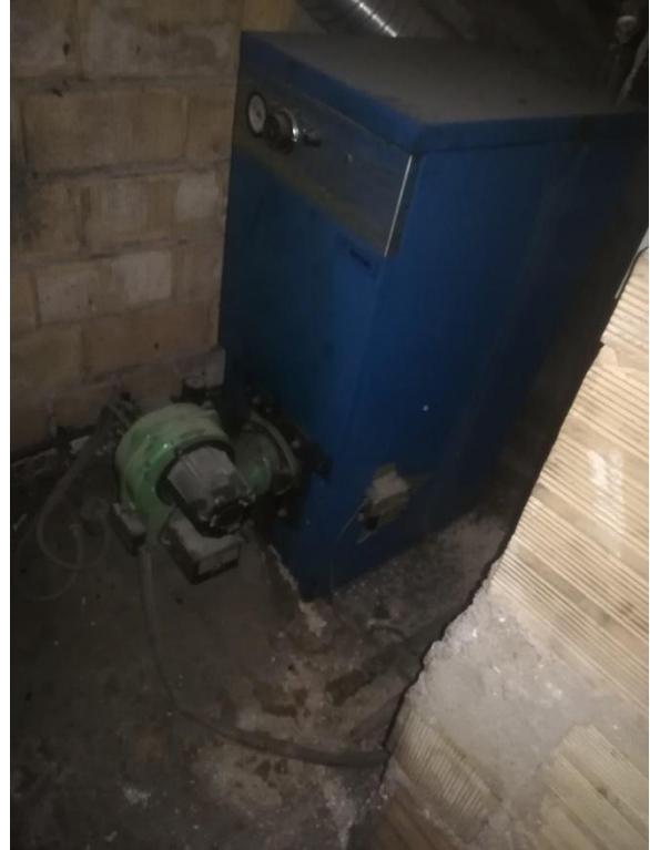
FOTO N.8-9 : PIANO S1 : SOTTOSCALA CON GENERATORE TERMICO A GASOLIO A SERVIZIO DEL PIANO