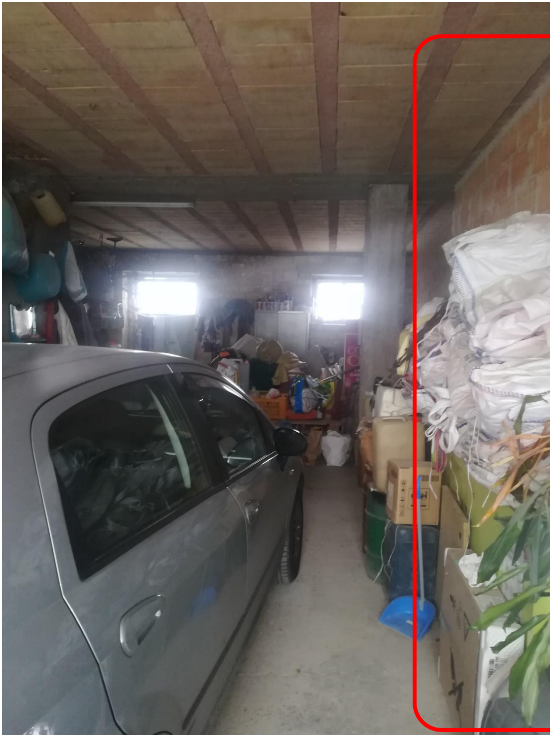
PIANO SOTTOSTRADA S1: CANTINA

N.B.: IL MURO DI SEPARAZIONE TRA UNITA' IMMOBILIARI VISIBILE NELLA FOTO A DESTRA NON E' PRESENTE NELLA PLANIMETRIA DELLO STATO APPROVATO; MENTRE RISULTA NELLA PLANIMETRIA CATASTALE A SEGUITO DI FRAZIONAMENTO