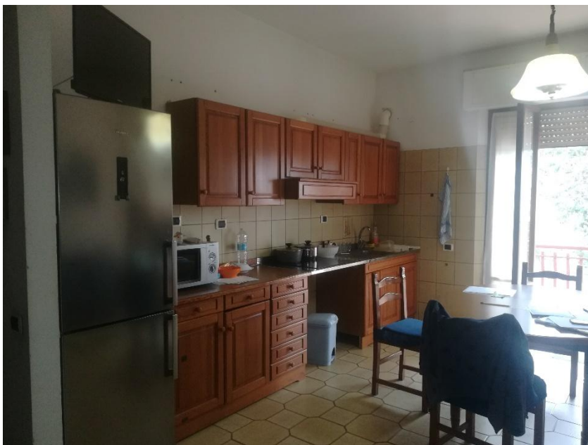
PIANO PRIMO : INGRESSO /CUCINA /ZONA GIORNO