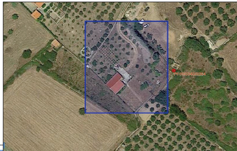
Vista Google Earth