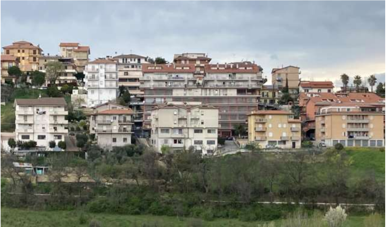
7. Vista da sud