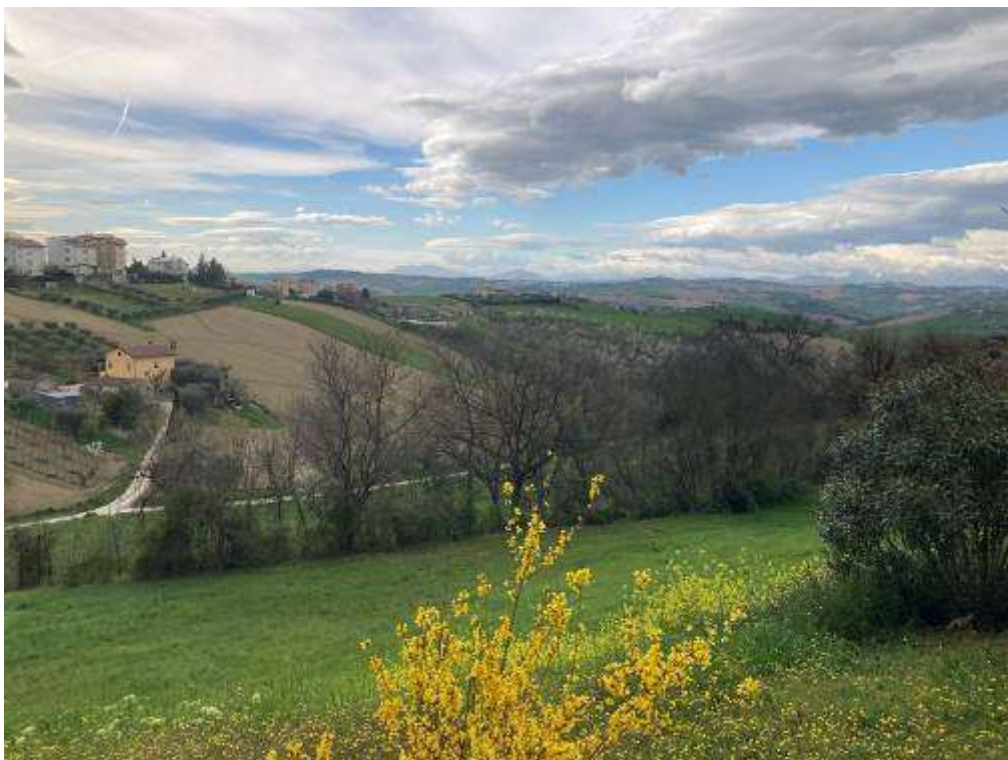
16. Vista da Monte