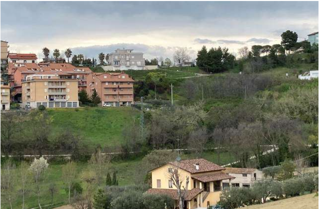
8. Vista da sud