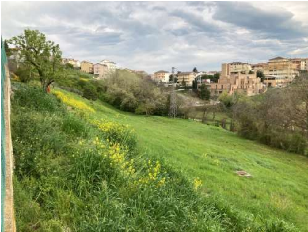
12. Vista da Monte