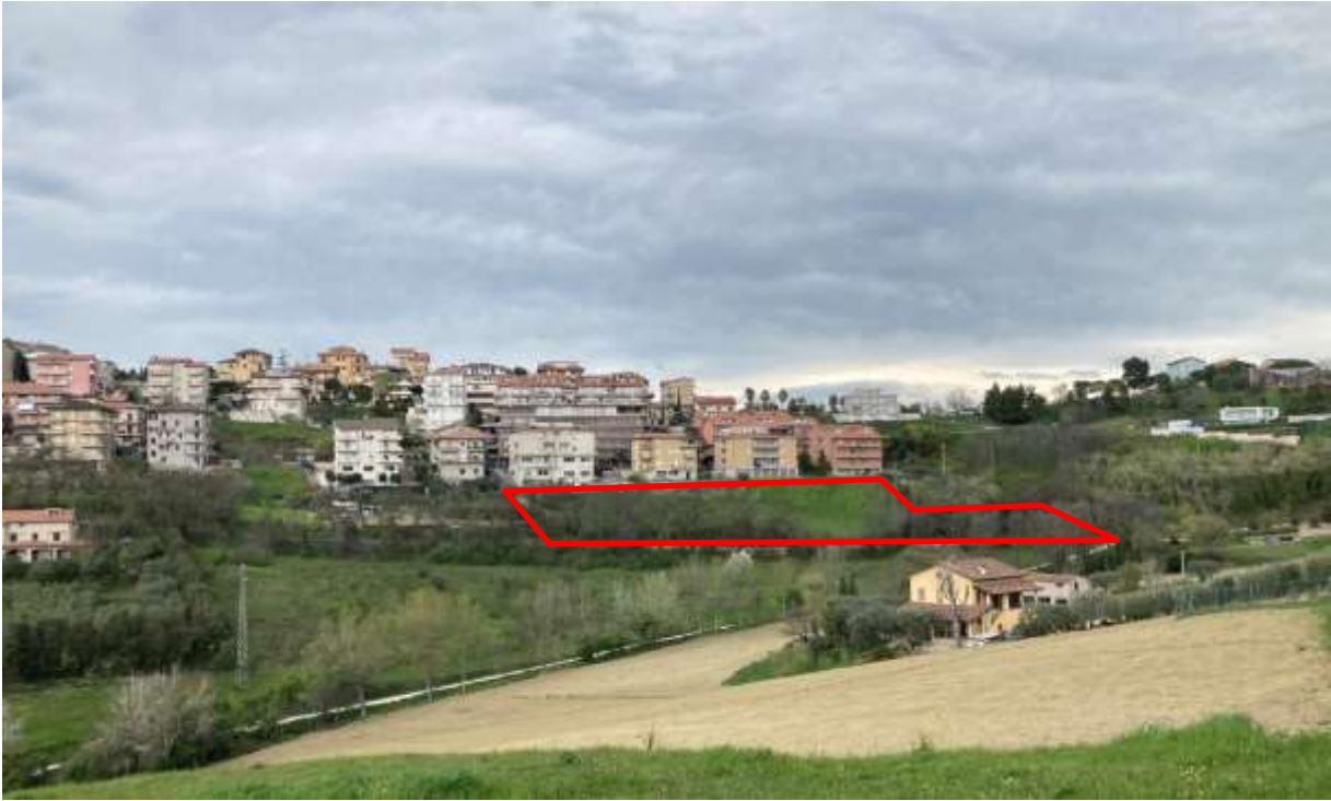
5. Vista da sud