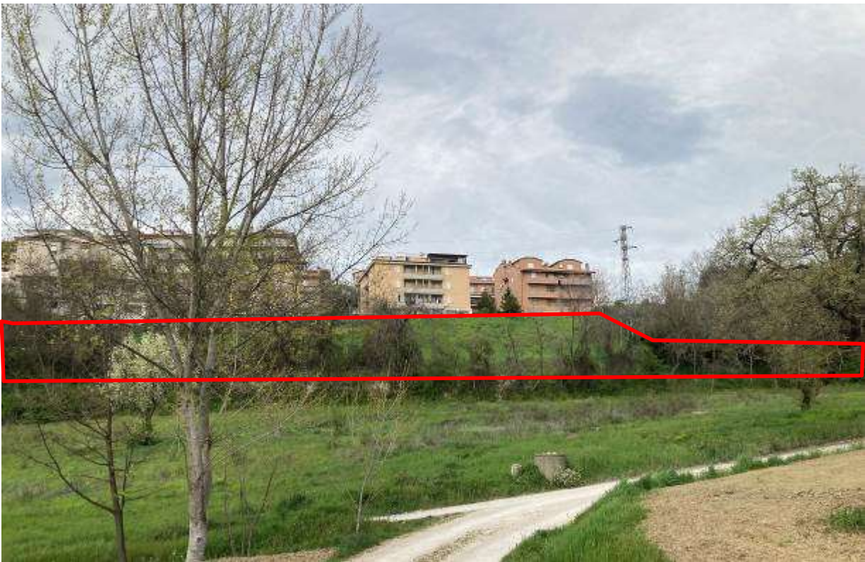
6. Vista da sud