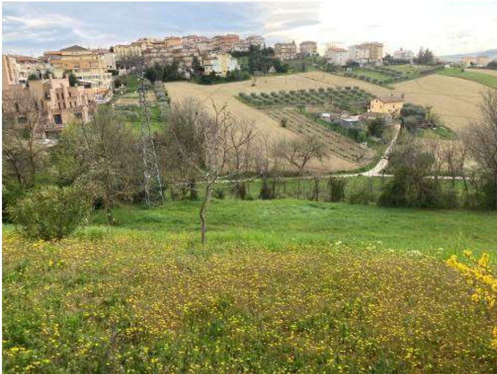
15. Vista da Monte