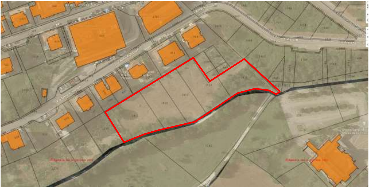
3. Sovrapposizione ortofoto/Catastale