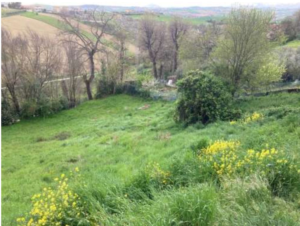
14. Vista da Monte