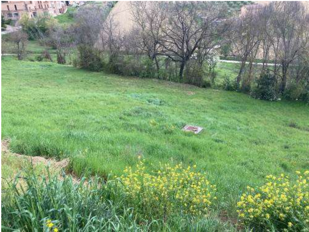
13. Vista da Monte