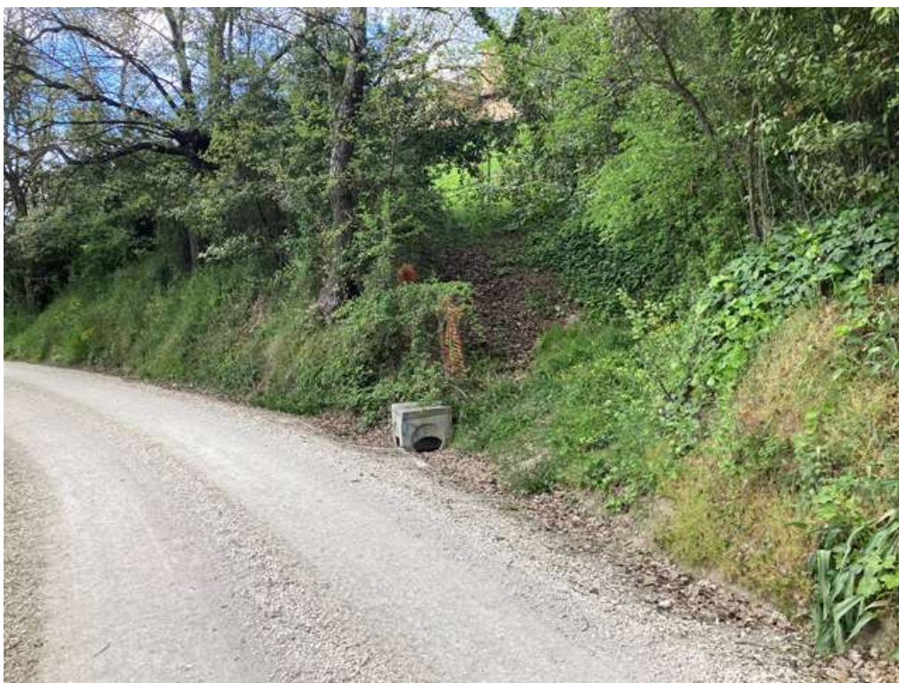
9. Accesso dalla strada vicinale “Sopra Rio Dell’inferno”