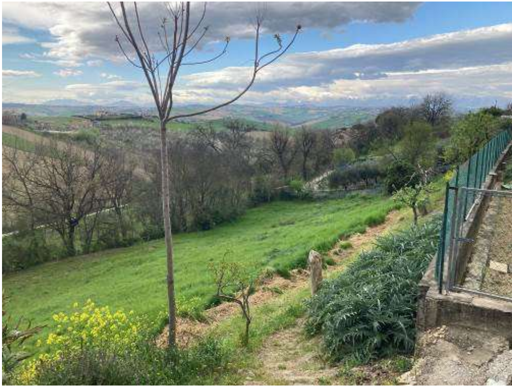
17. Vista da Monte