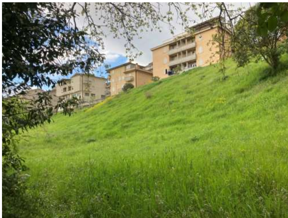
10. Vista da valle in corrispondenza dell’accesso