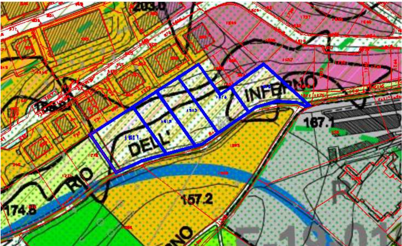
4. Sovrapposizione PRG/Catastale