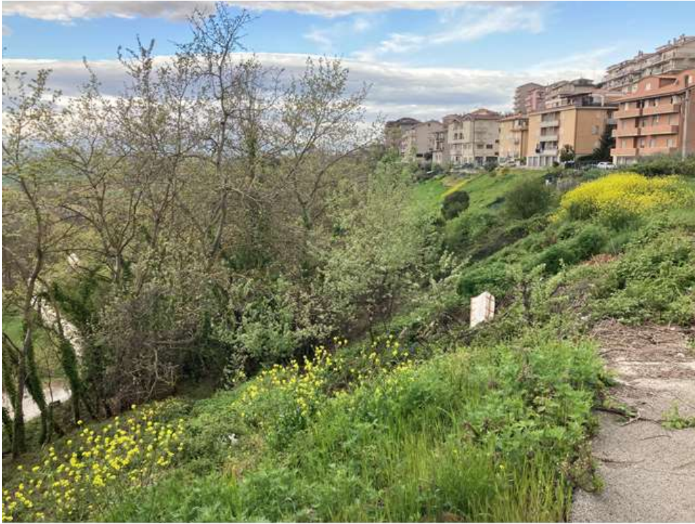
11. Vista da Nord-Est