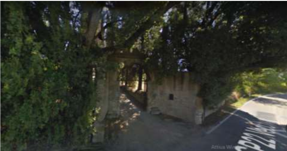
Prima della ristrutturazione