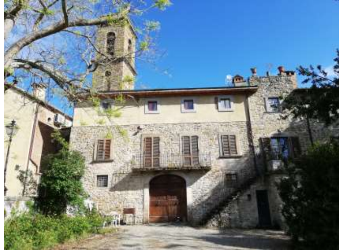
Accesso da Nord p.Ila 409