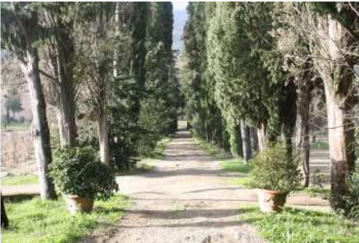
Viale p.lla 209 verso valle