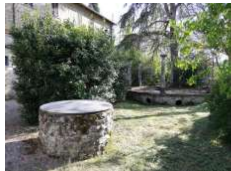
Pozzo nella p.Ila 409