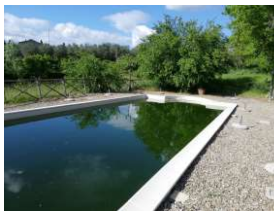
Piscina p.Ila 809