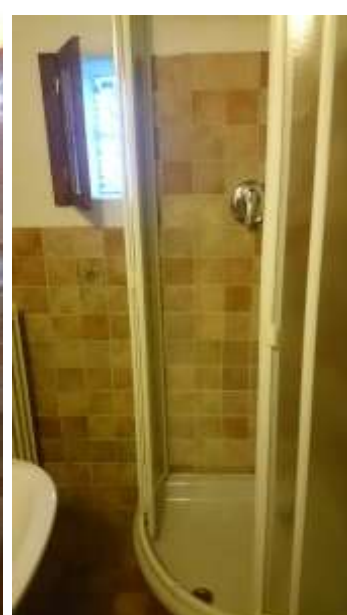
Servizio della camera