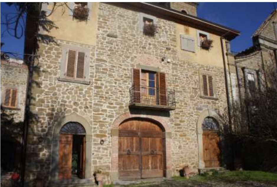
Vista da sud