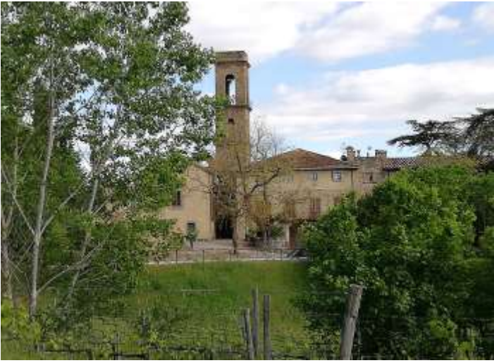
Vista da Nord del complesso