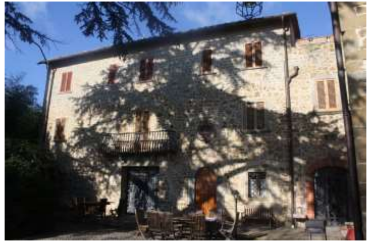
Vista da sud