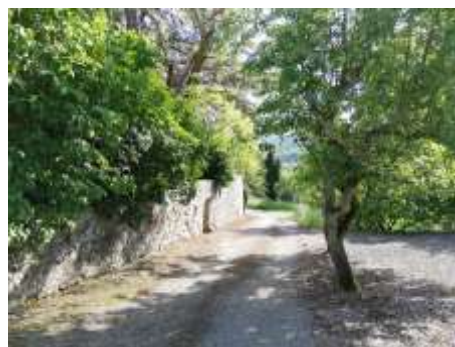
viale di accesso