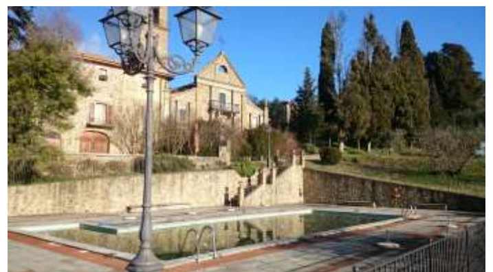
Vista dalla p.lla 211