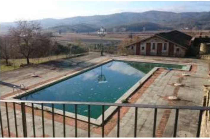
piscina p.lla 211