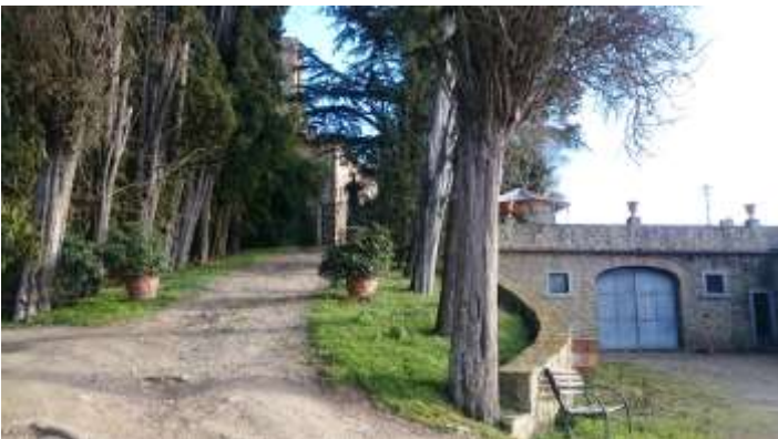
Vista in arrivo dal viale