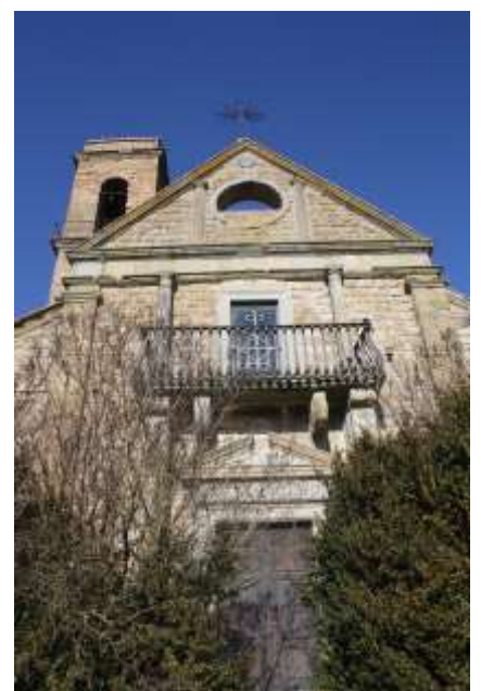
Cappella privata p.lla A