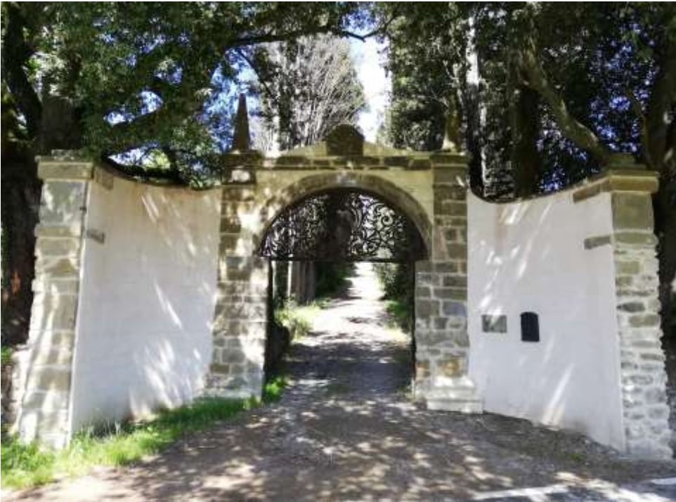
Ingresso alla villa (p.209)