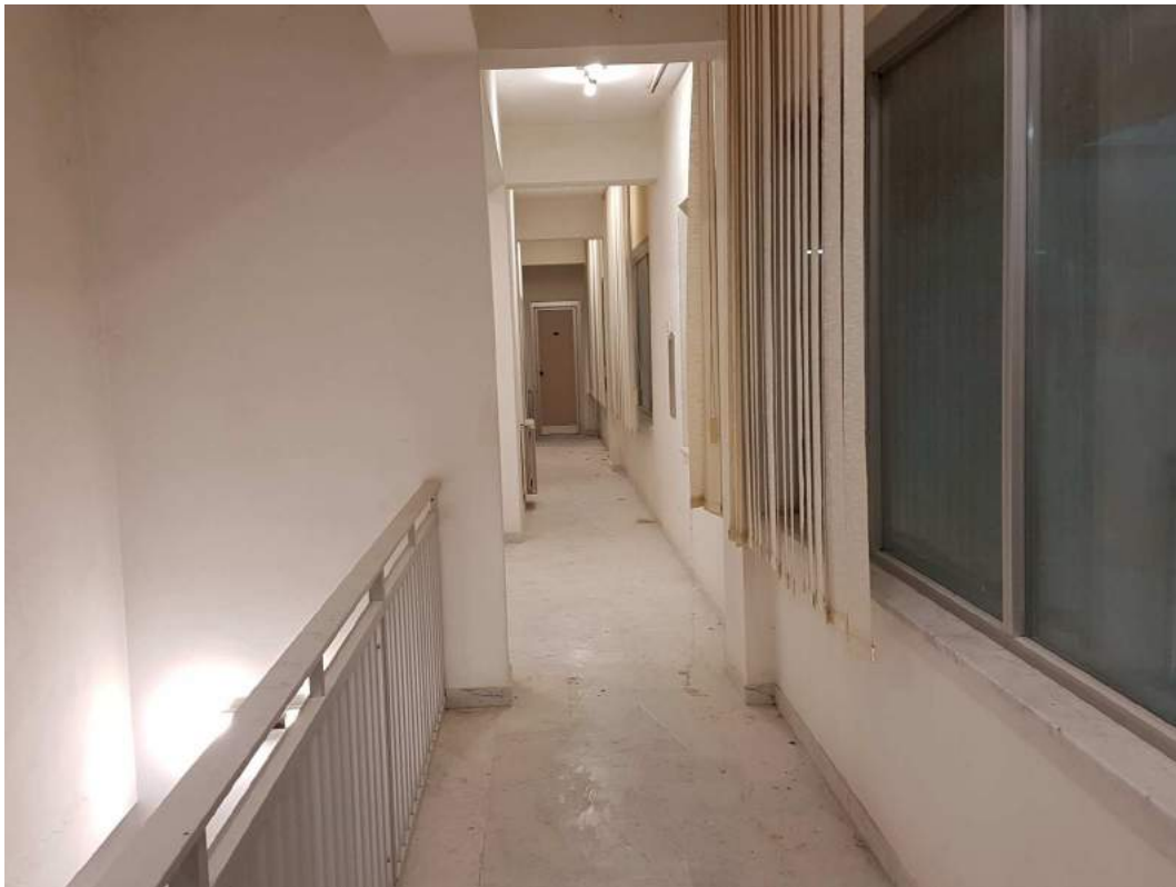
- Foto 8 - Corpo Uffici - Piano Primo