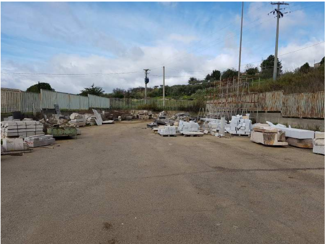
- Foto 34 - Esterno