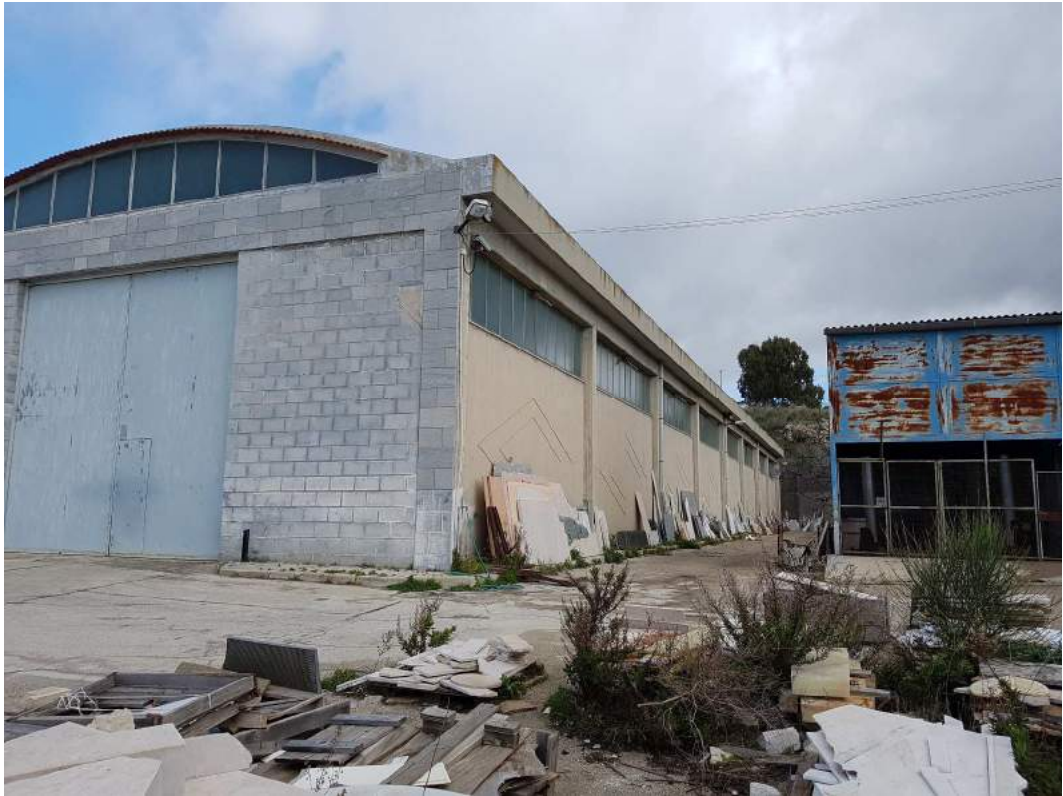
- Foto 31 - Esterno