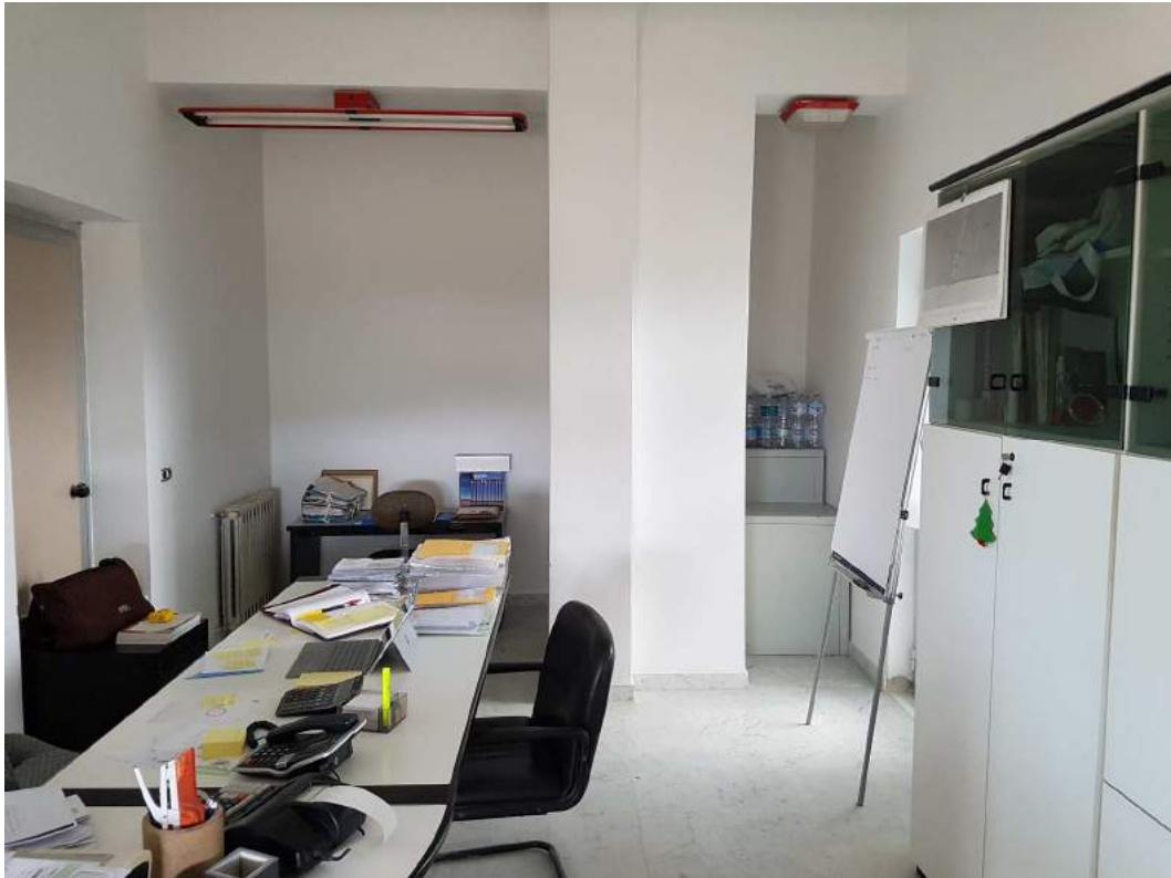
- Foto 11 - Corpo Uffici - Piano Terra