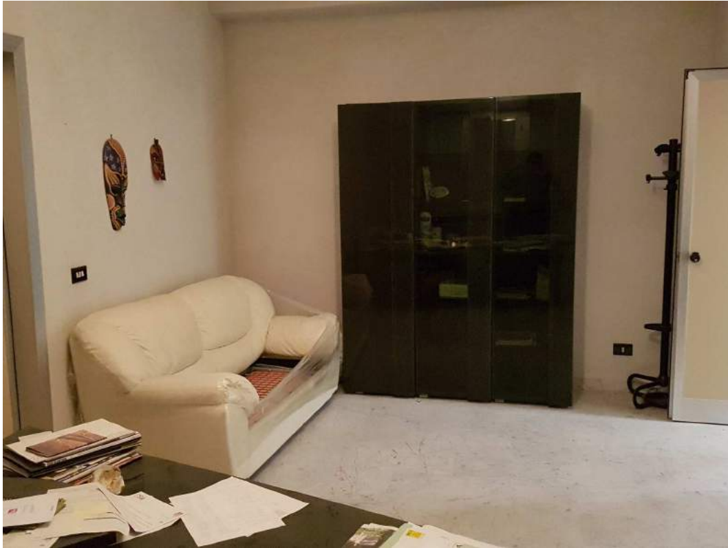
- Foto 5 - Corpo Uffici - Piano Primo