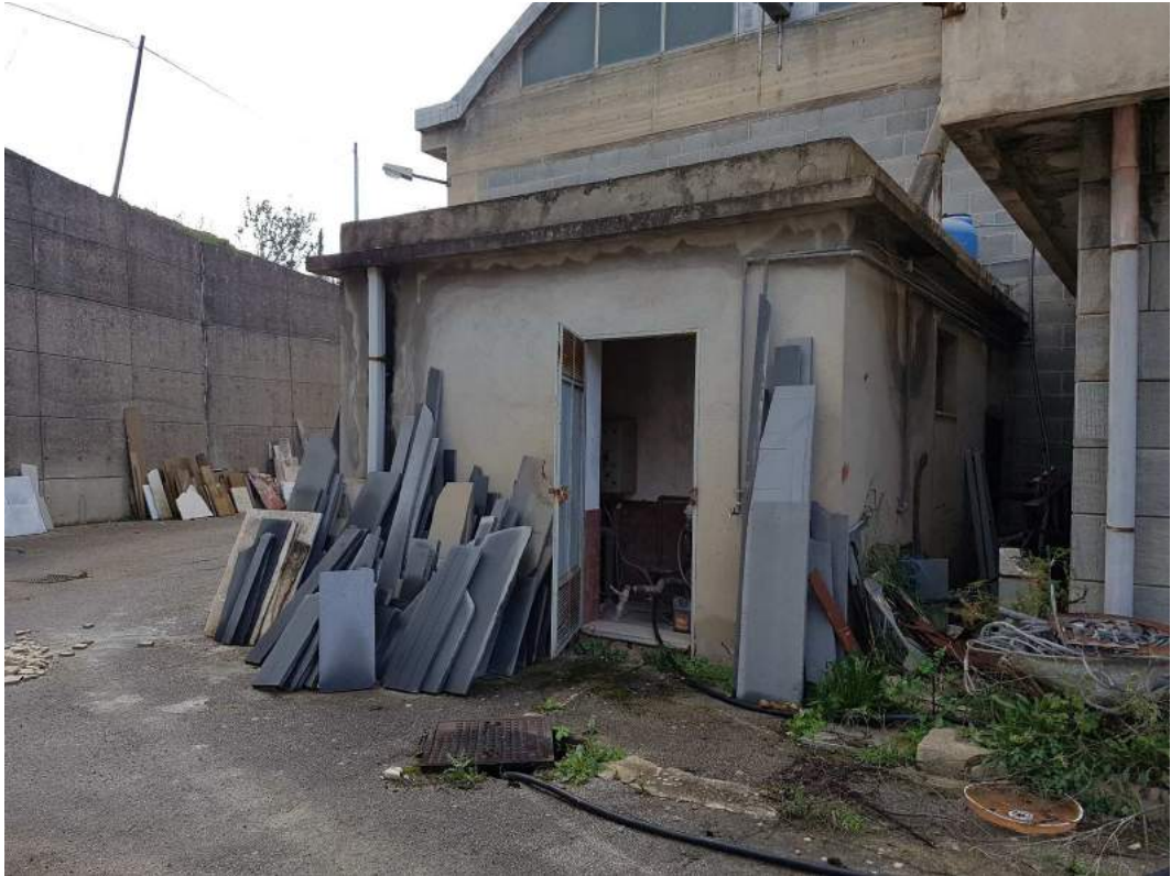
- Foto 37 - Esterno