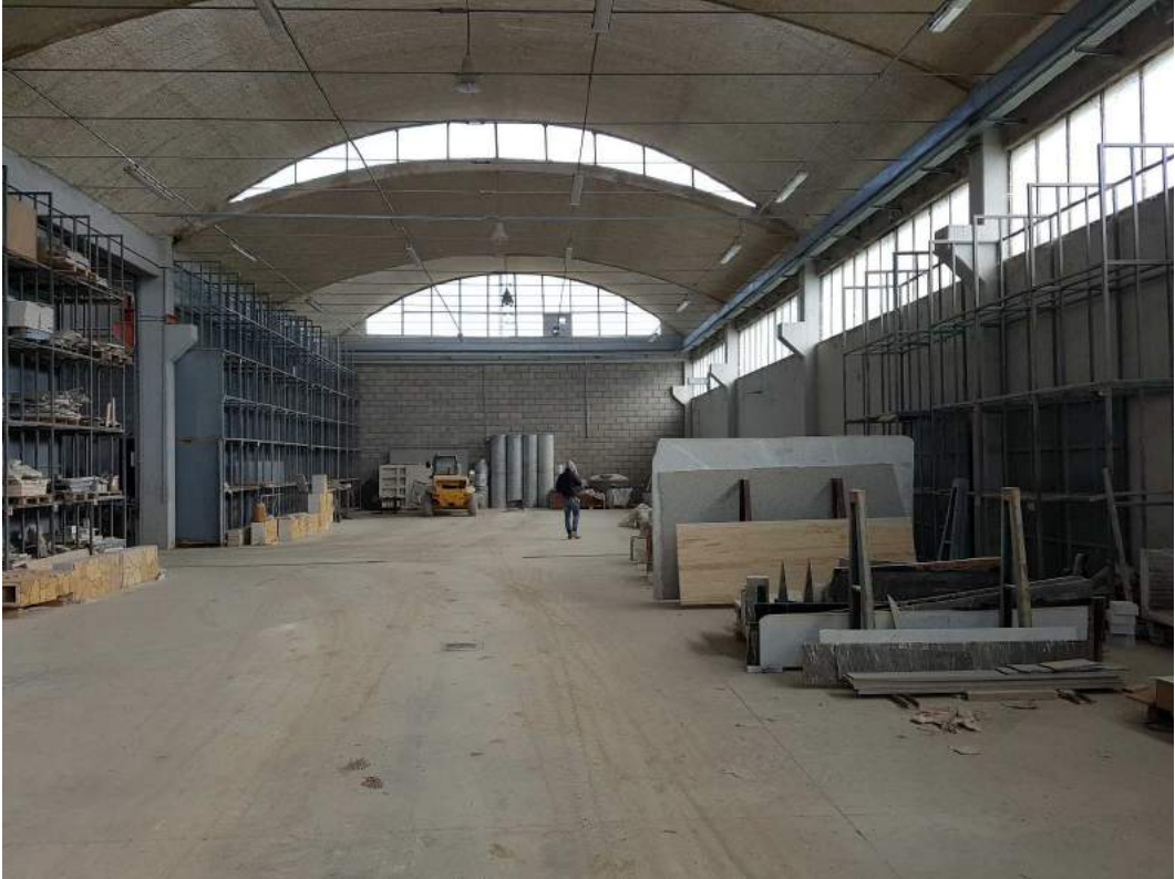
- Foto 21 - Capannone