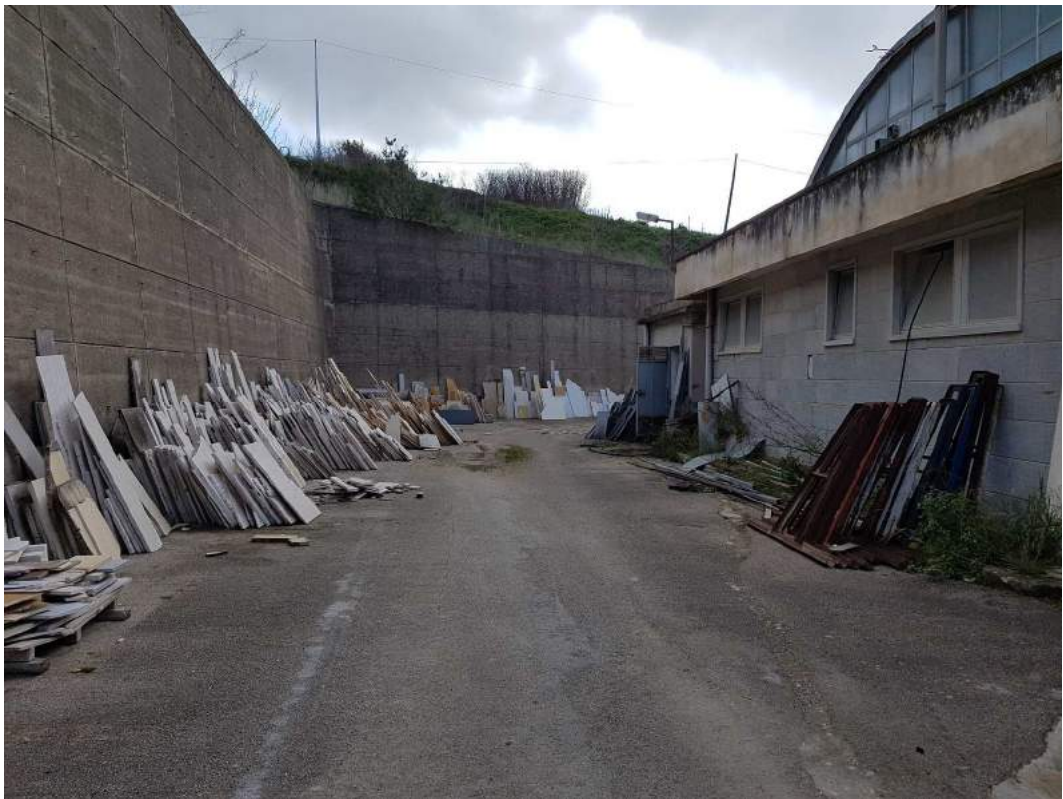
- Foto 36 - Esterno