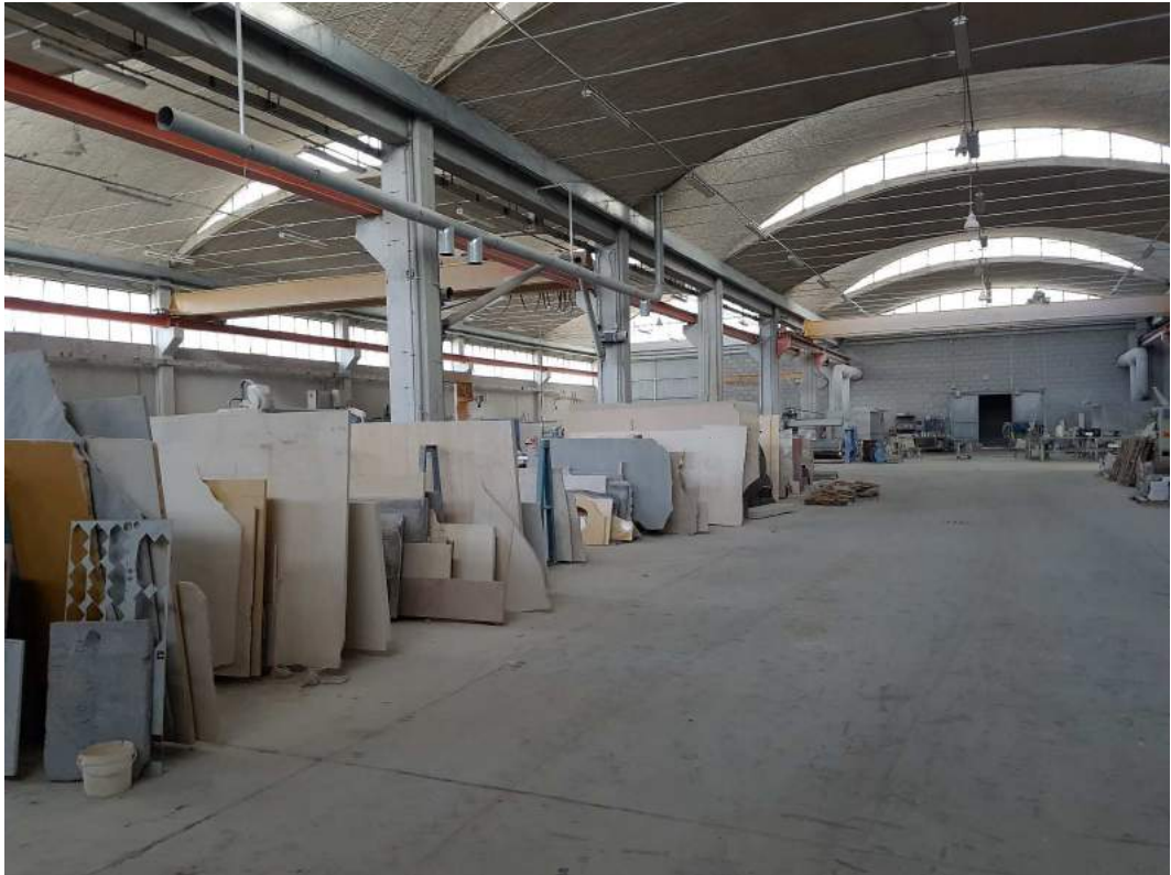
- Foto 23 - Capannone