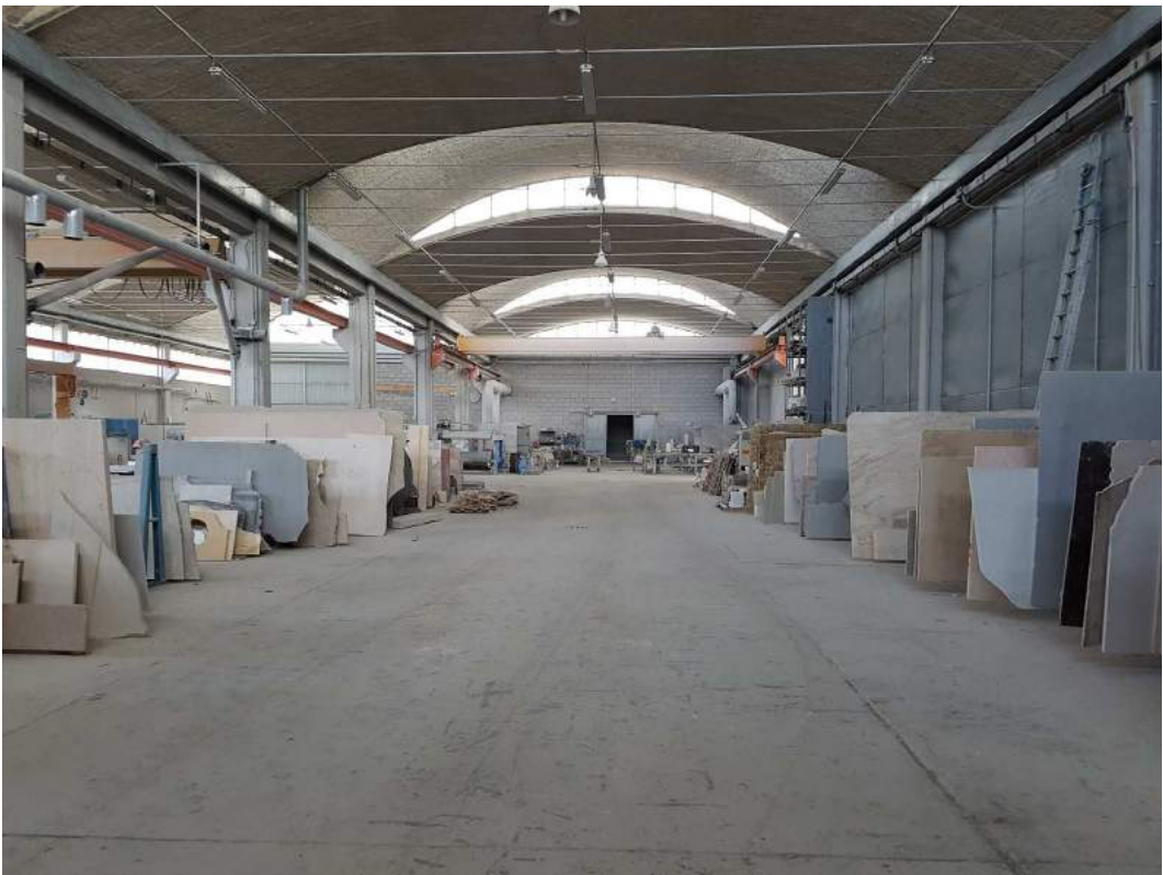
- Foto 22 - Capannone