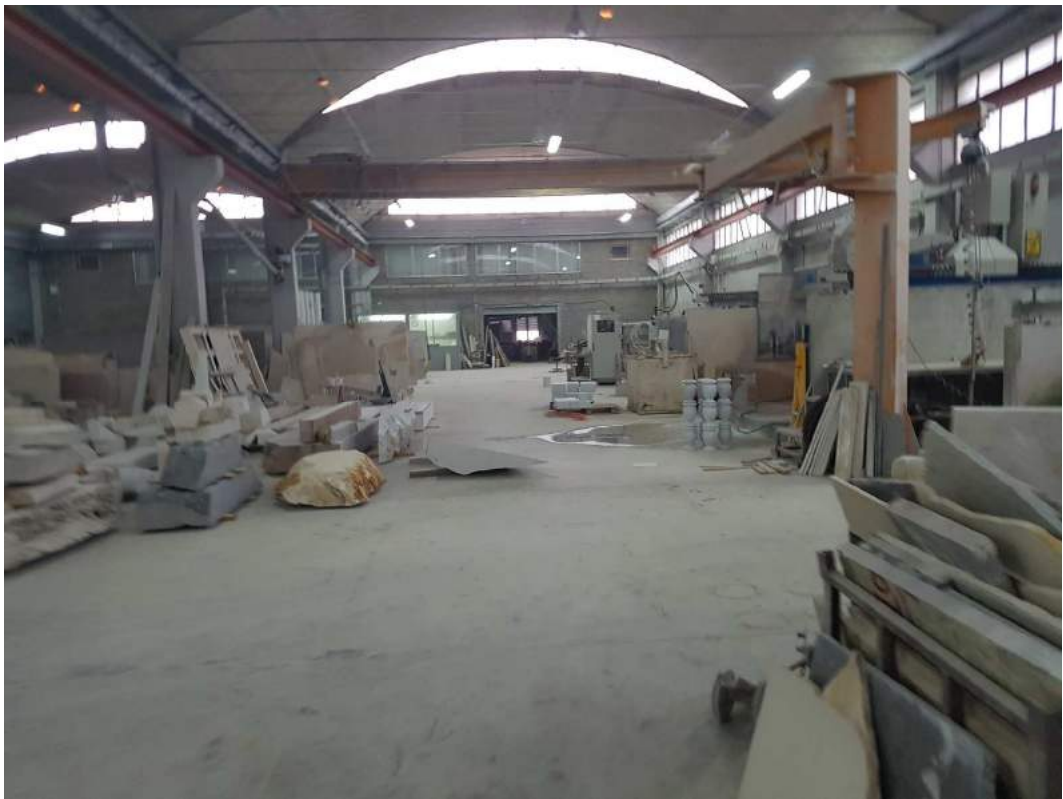
- Foto 26 - Capannone