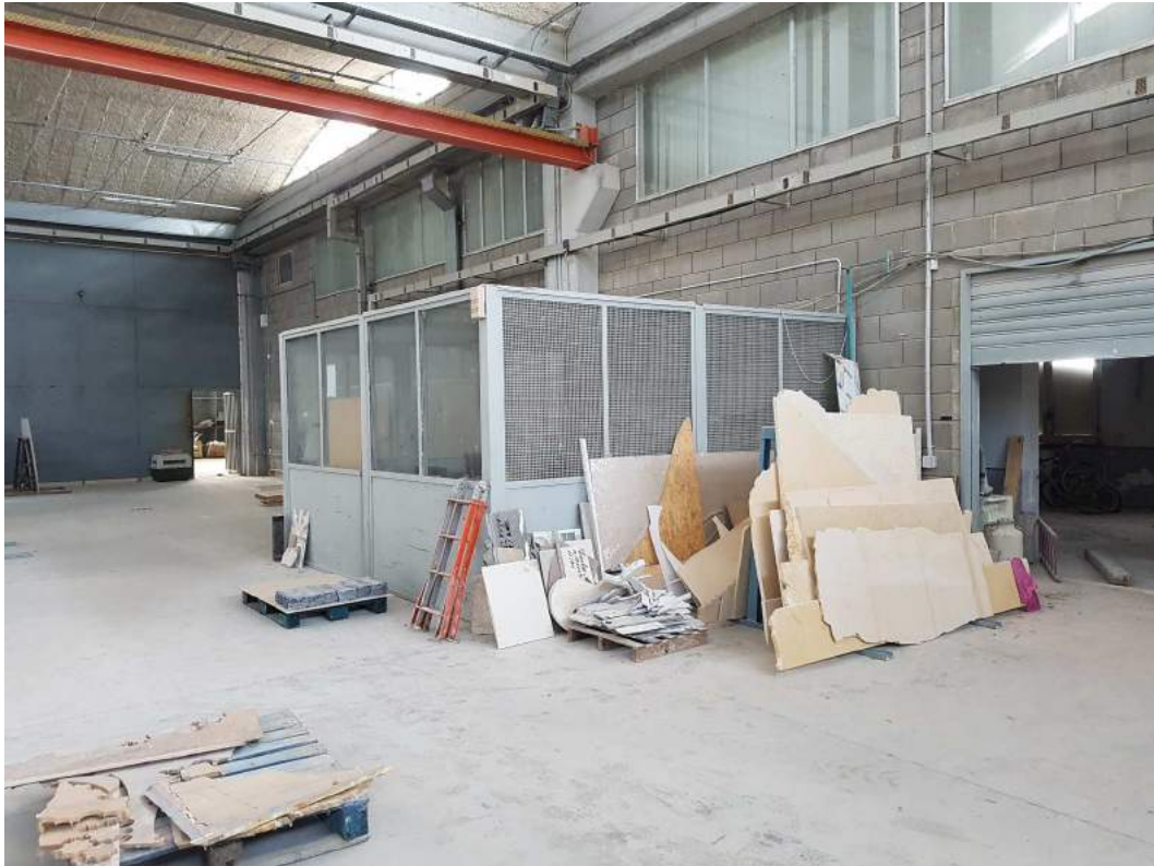
- Foto 13 - Capannone