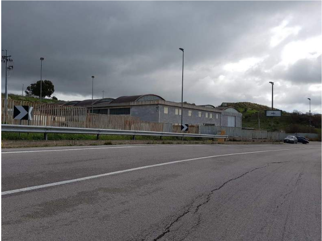
- Foto 1 - Esterno - S.S. 118