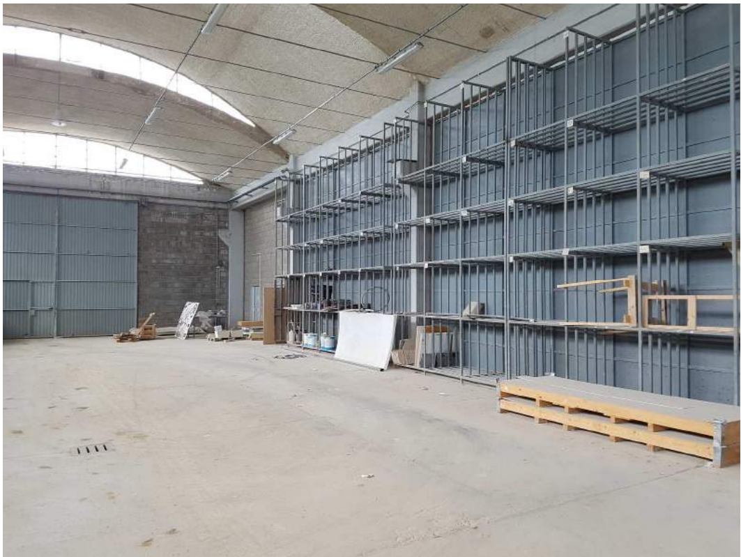
- Foto 20 - Capannone