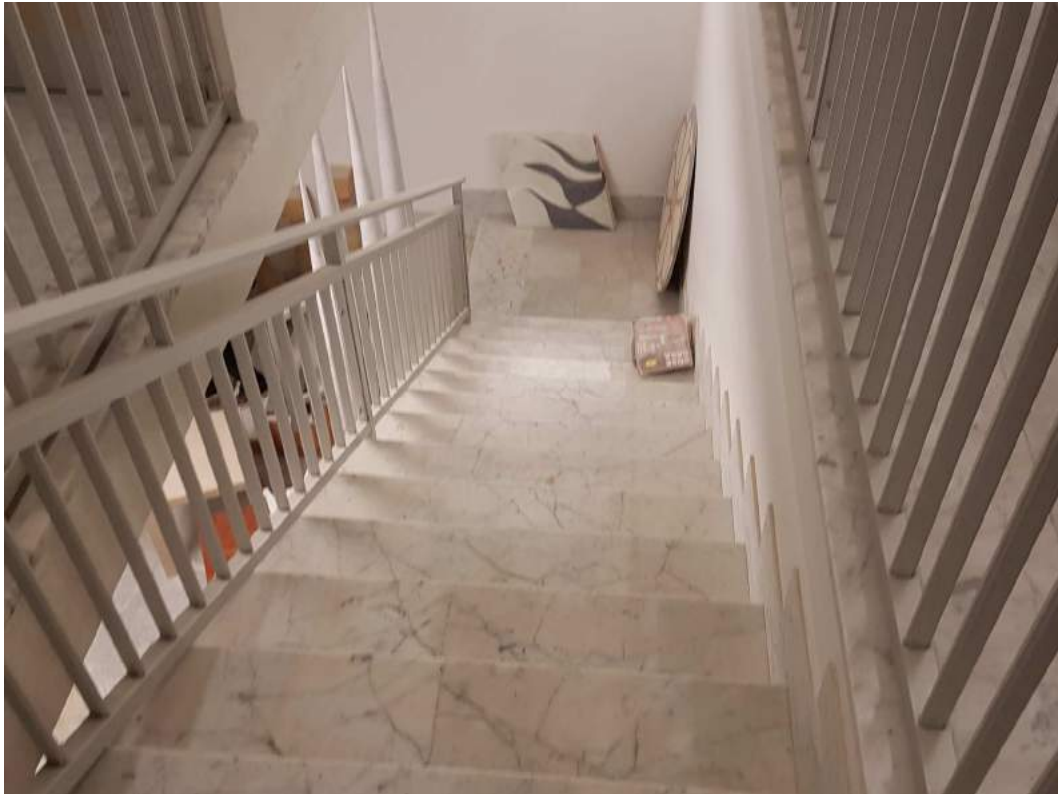
- Foto 9 - Scala di collegamento dei due livelli del Corpo Uffici