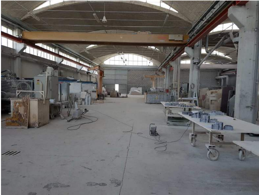
- Foto 15 - Capannone