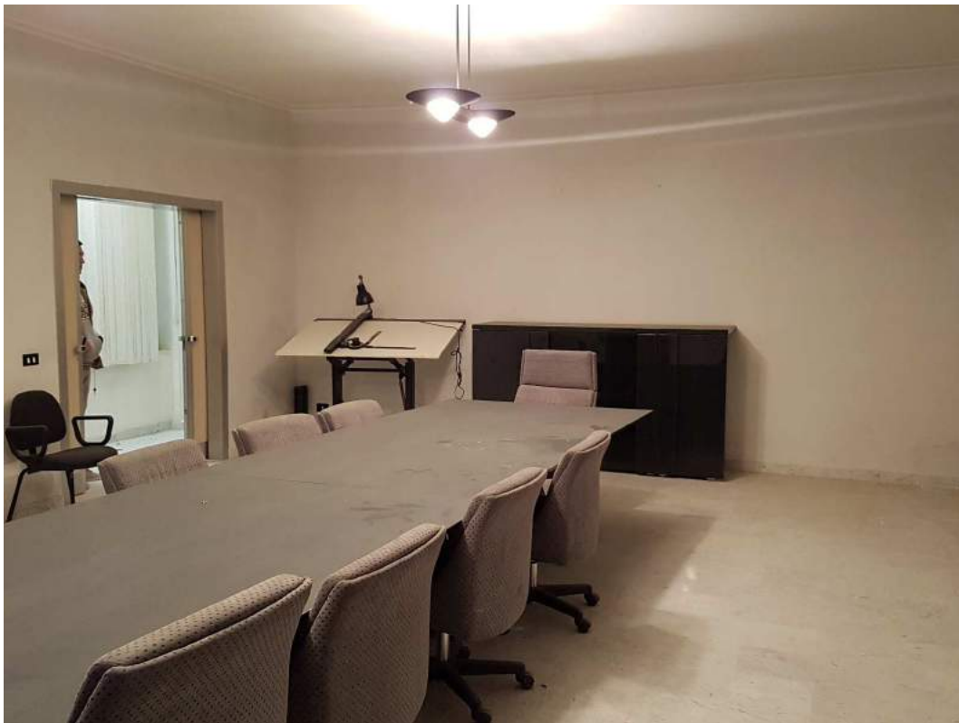
- Foto 4 - Corpo Uffici - Piano Primo