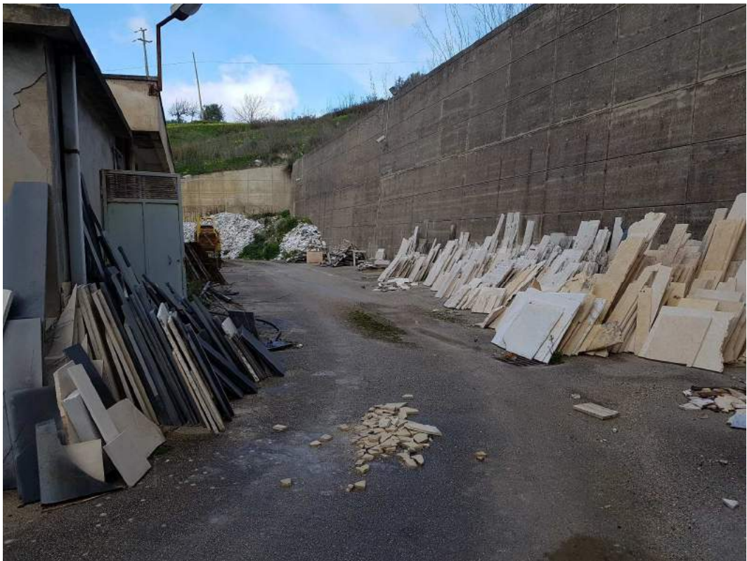
- Foto 38 - Esterno