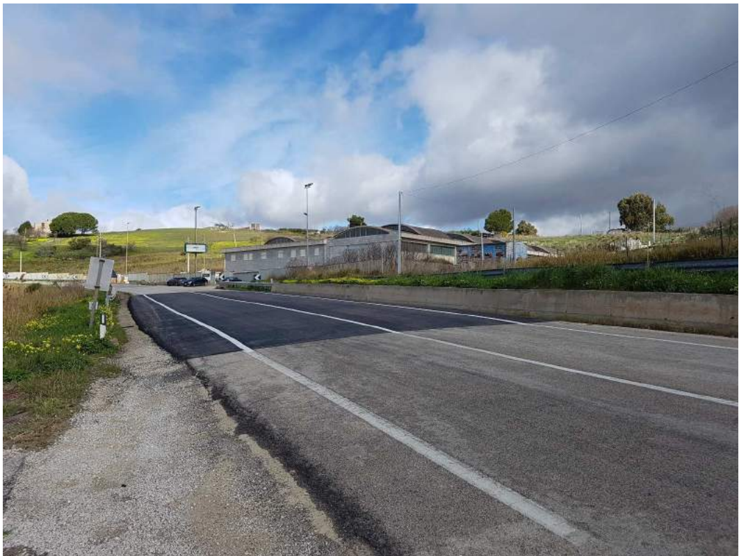
- Foto 2 - Esterno - S.S. 118