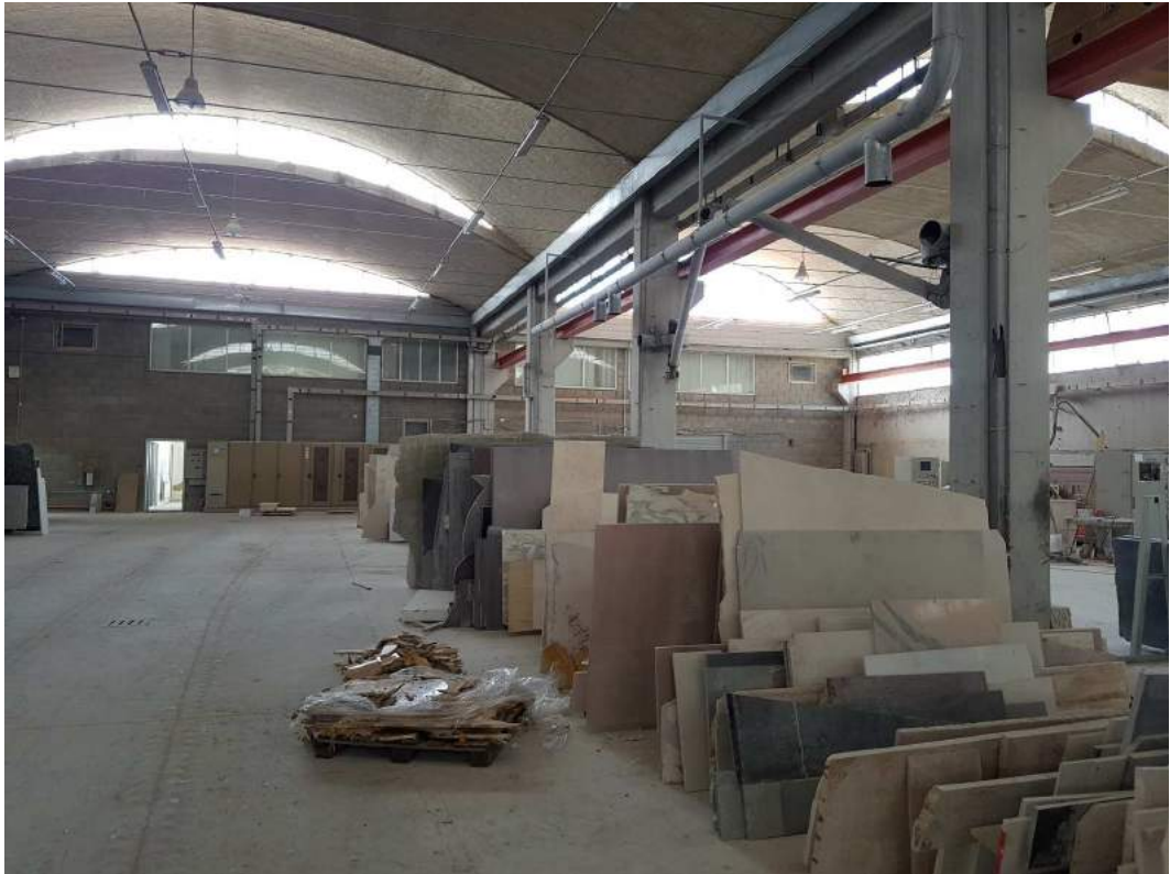
- Foto 25 - Capannone