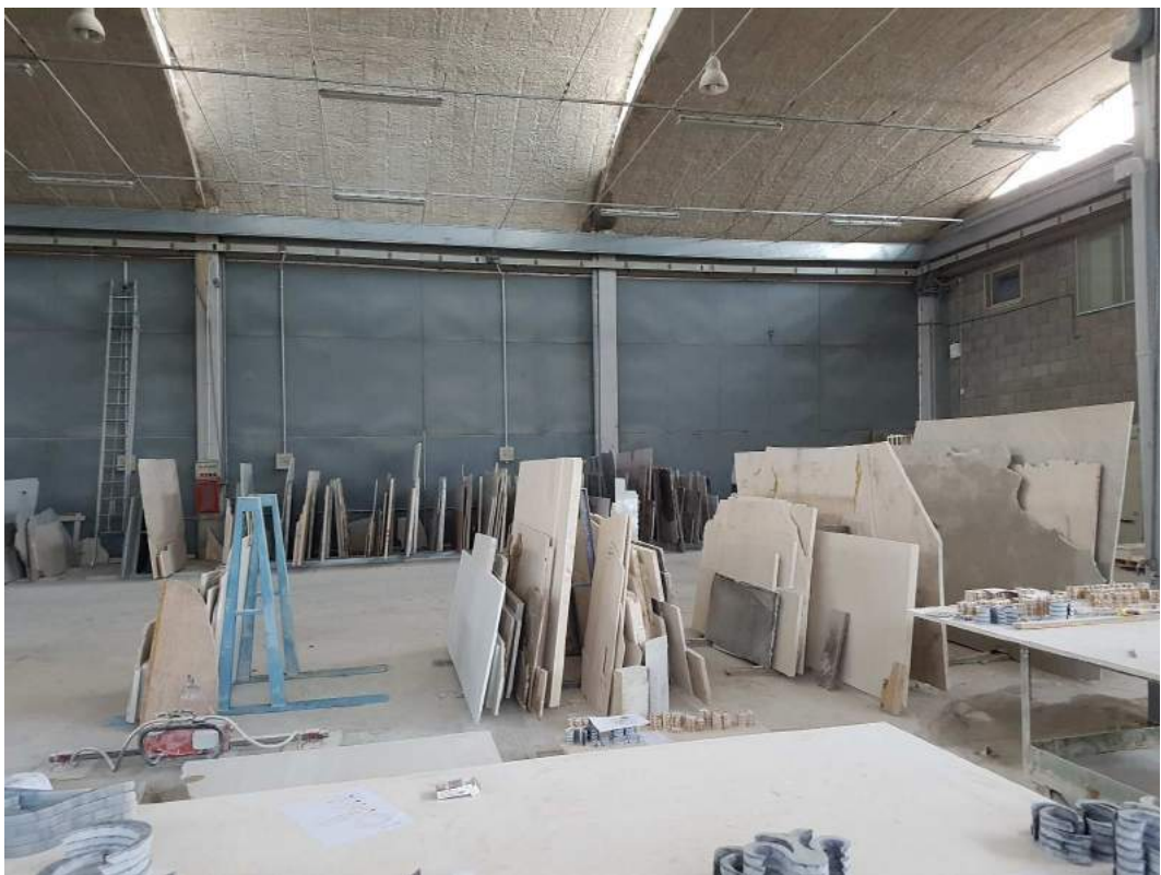
- Foto 18 - Capannone