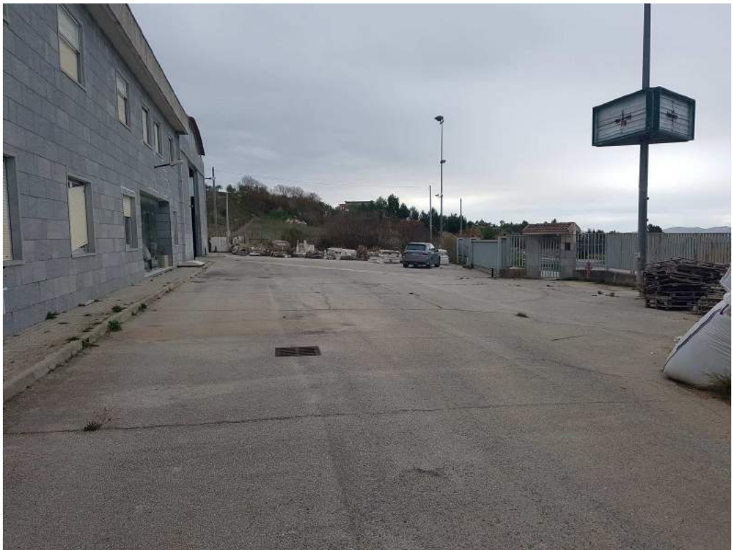
- Foto 32 - Esterno