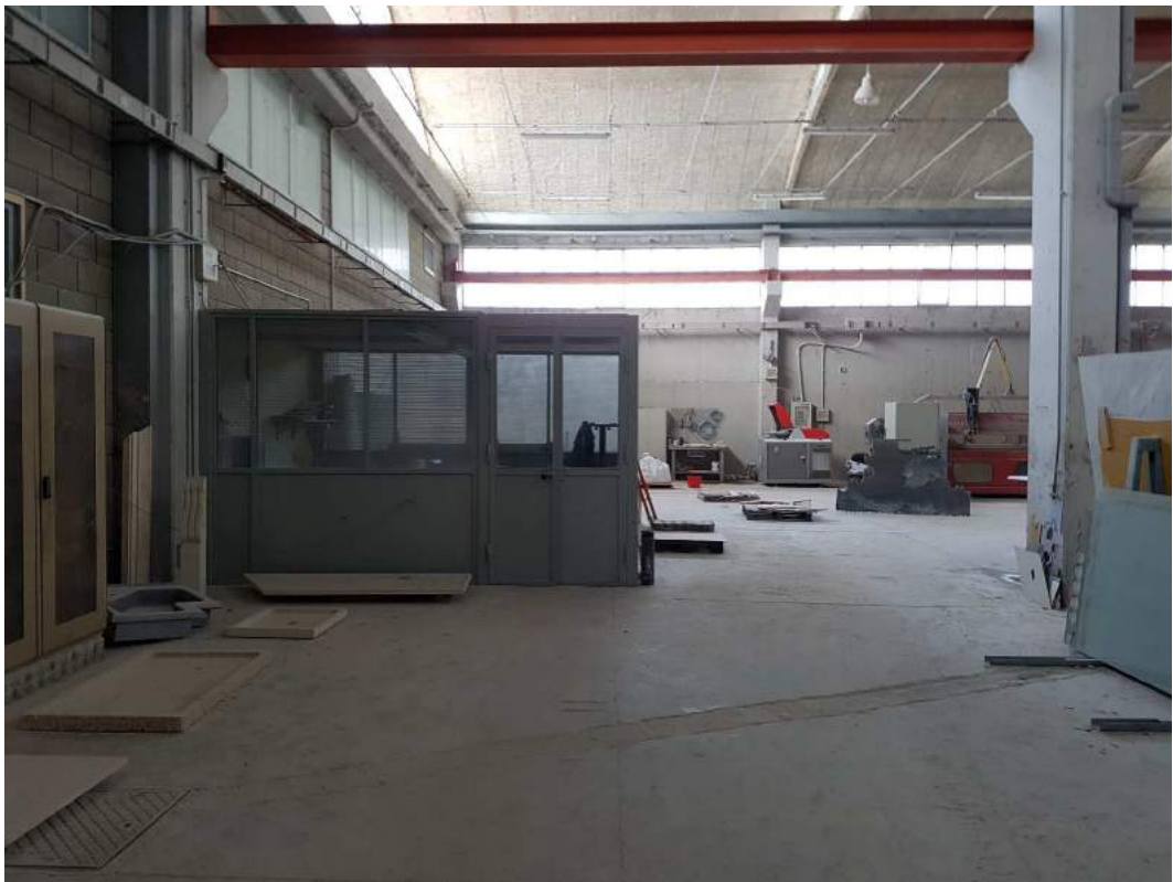
- Foto 24 - Capannone