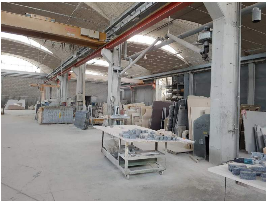
- Foto 16 - Capannone