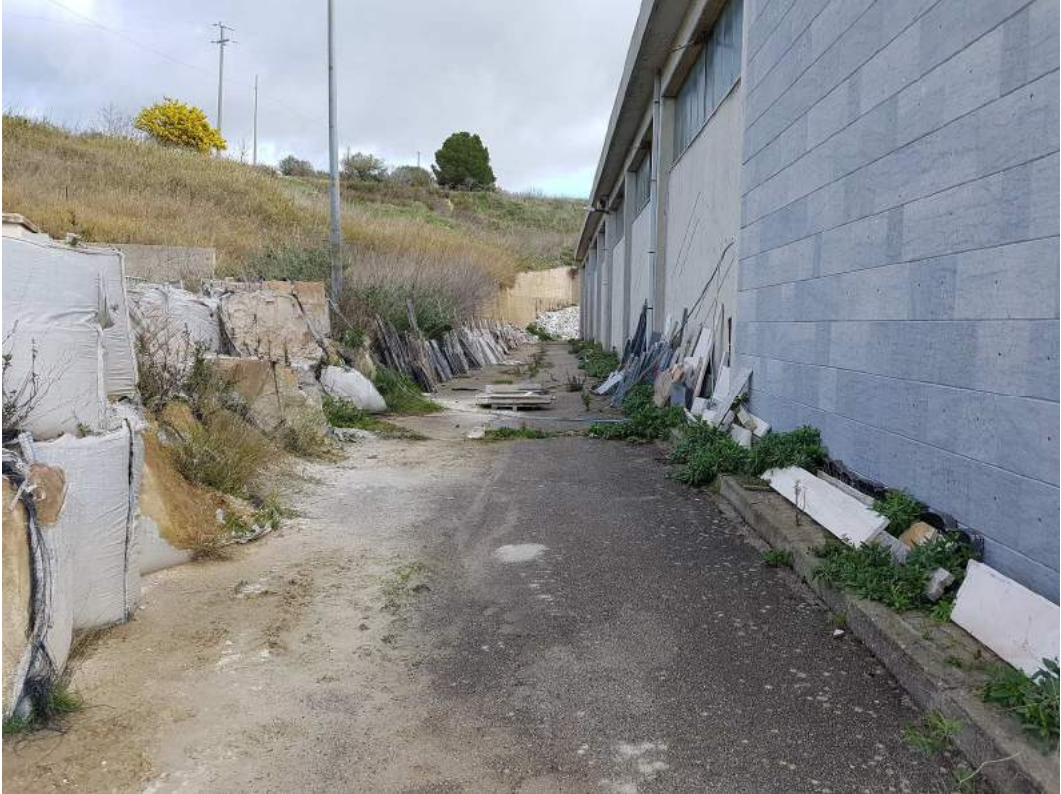
- Foto 33 - Esterno