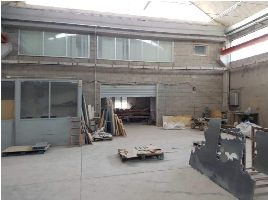
- Foto 19 - Capannone