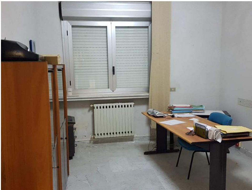
- Foto 6 - Corpo Uffici - Piano Primo