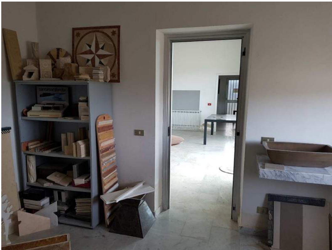
- Foto 12 - Corpo Uffici - Piano Terra