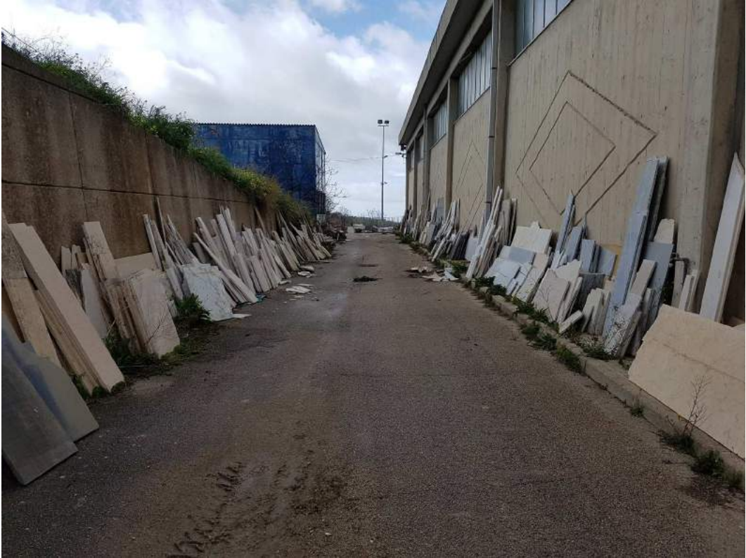
- Foto 39 - Esterno