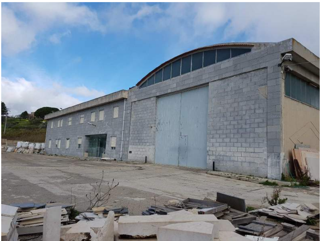
- Foto 30 - Esterno