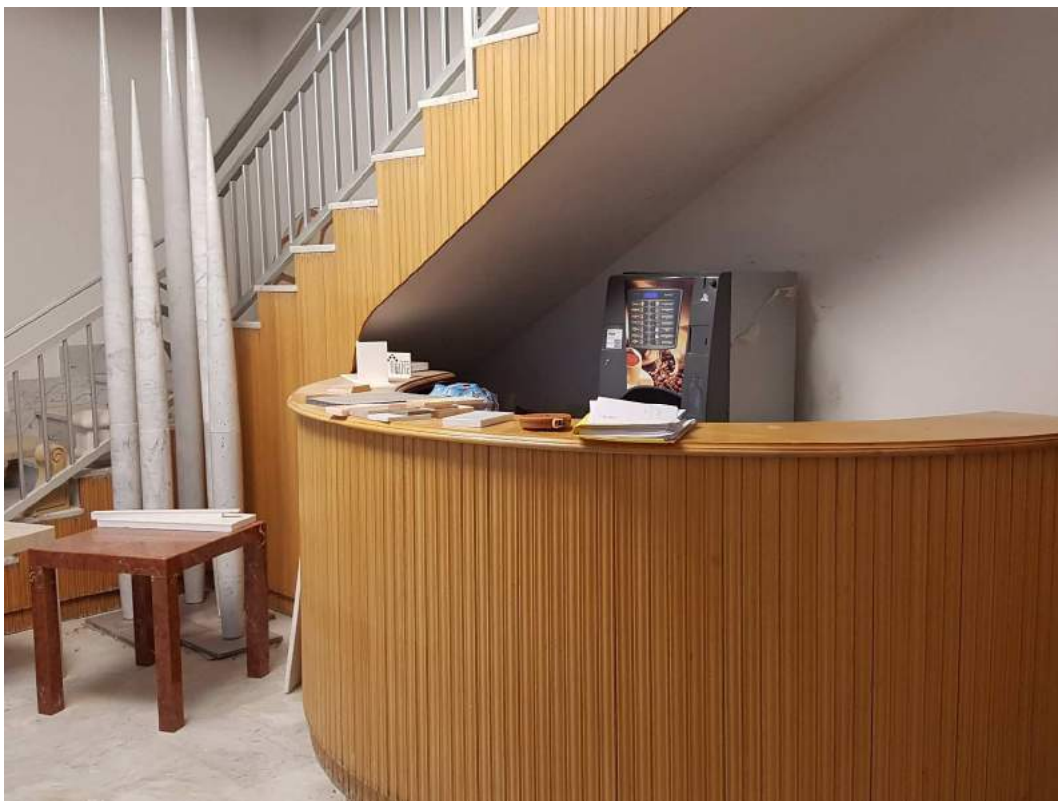
- Foto 10 - Corpo Uffici - Piano Terra