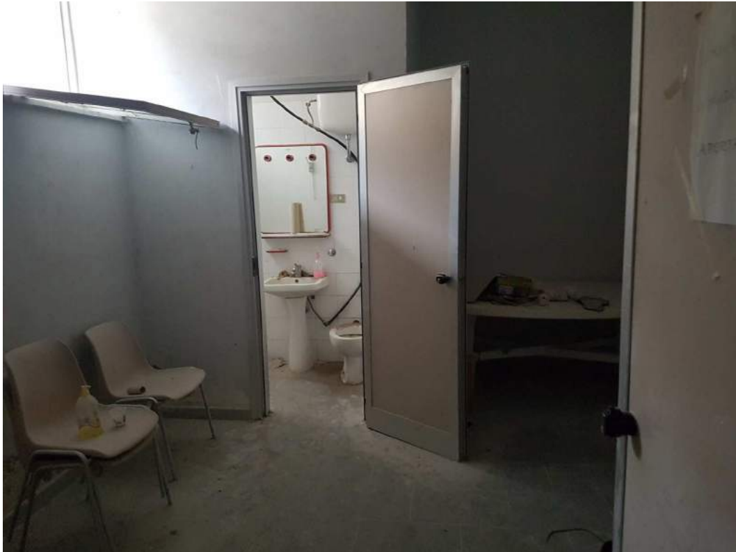
- Foto 27 - Corpo Servizi