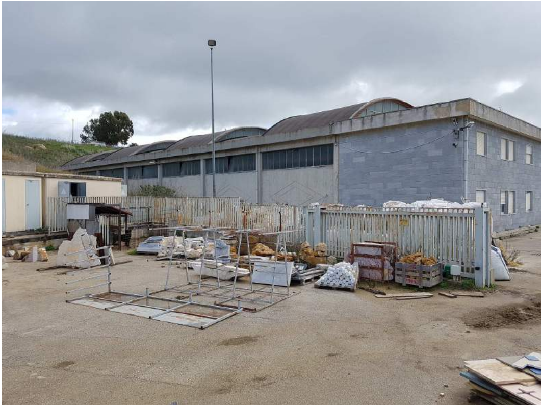
- Foto 35 - Esterno