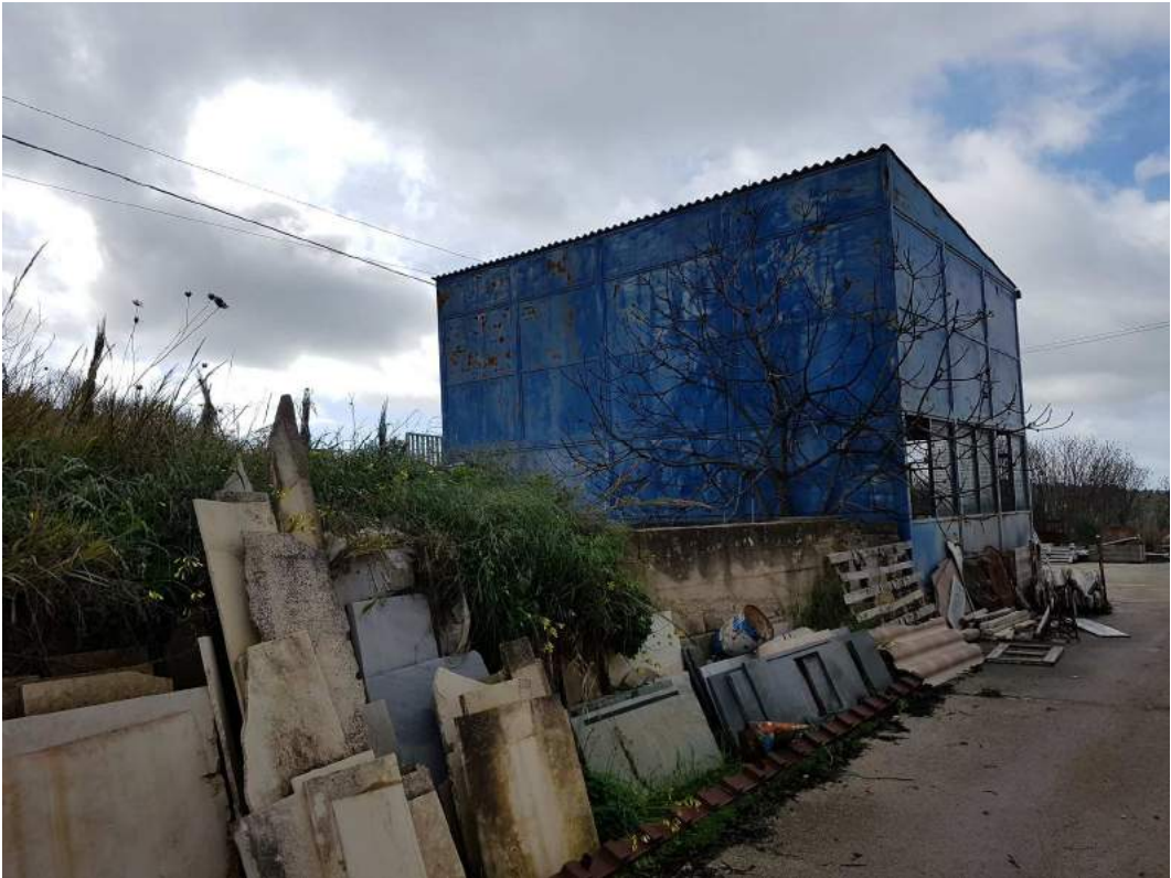
- Foto 40 - Esterno