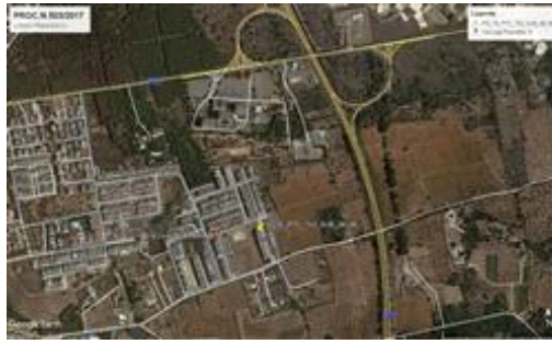
Localizzazione lotto 1

attrazioni storico paesaggistiche: Centro storico della Città di Gallipoli.