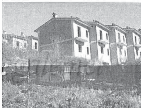
vista panoramica dalla strada sottostante la lottizzazione