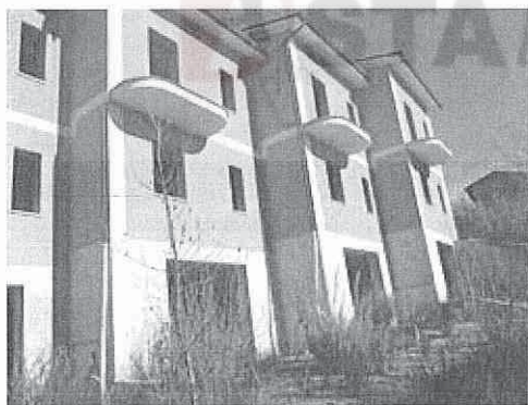
retro della prima palazzina