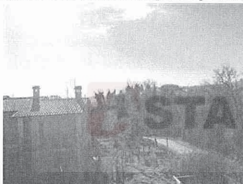
vista panoramica dall'alto

I beni sono ubicati in zona periferica in un'area residenziale, le zone limitrofe si trovano in un'area residenziale (i più importanti centri limitrofi sono San Leo, San Marino, Urbino). Il traffico nella zona è scorrevole, i parcheggi sono scarsi. Sono inoltre presenti i servizi di urbanizzazione primaria, i seguenti servizi ad alta tecnologia: non presenti.