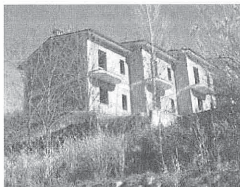
Veduta Palazzina dalla strada "Cà Guerra"