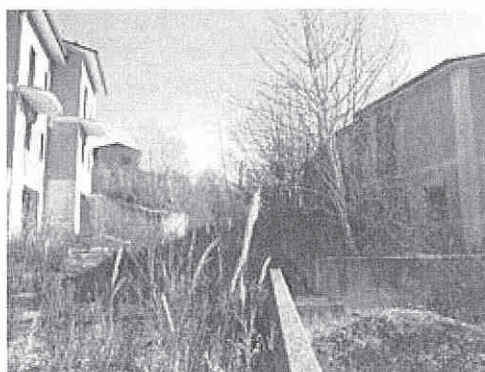
vista dei due edifici