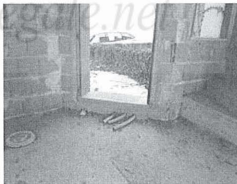
particolare interno della zona giorno