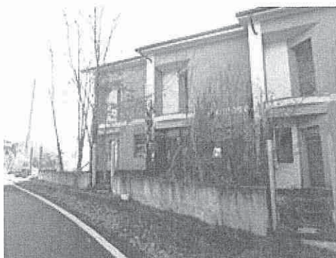
vista del primo immobile a ridosso della strada pubblica

Le unità immobiliari sono allo stato grezzo quindi prive di impianti, non è possibile redigere l'attestato di prestazione energetica.