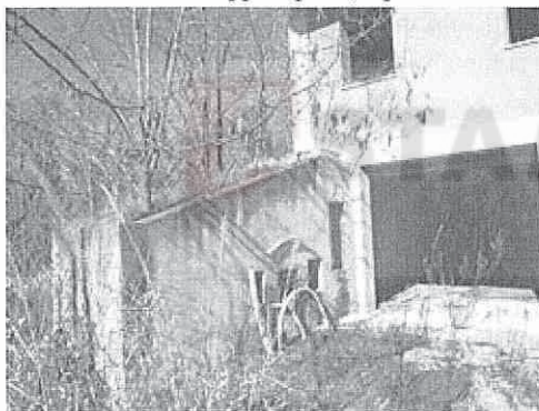
Veduta ingresso garage

L'intero edificio sviluppa 3 piani, 2 piani fuori terra, 1 piano interrato. Immobile costruito nel 2008.