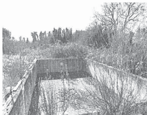
vasca per piscina allo stato grezzo