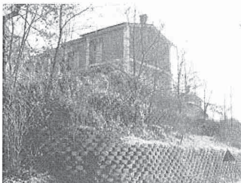
Vista altra palazzina strada "Cà Guerra"