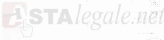
Planimetria standard piano interrato