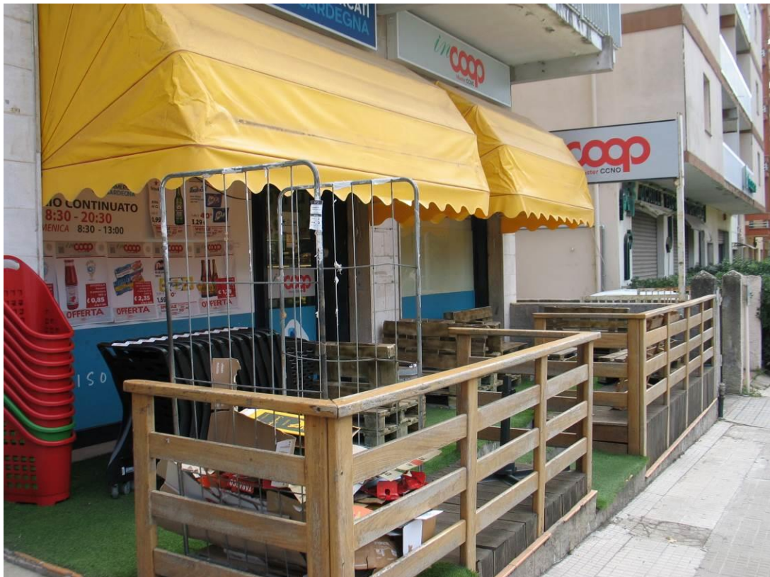
Foto 6 - ingresso