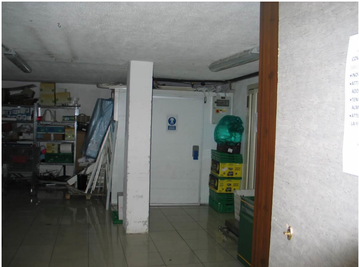
Foto 13 - Magazzino