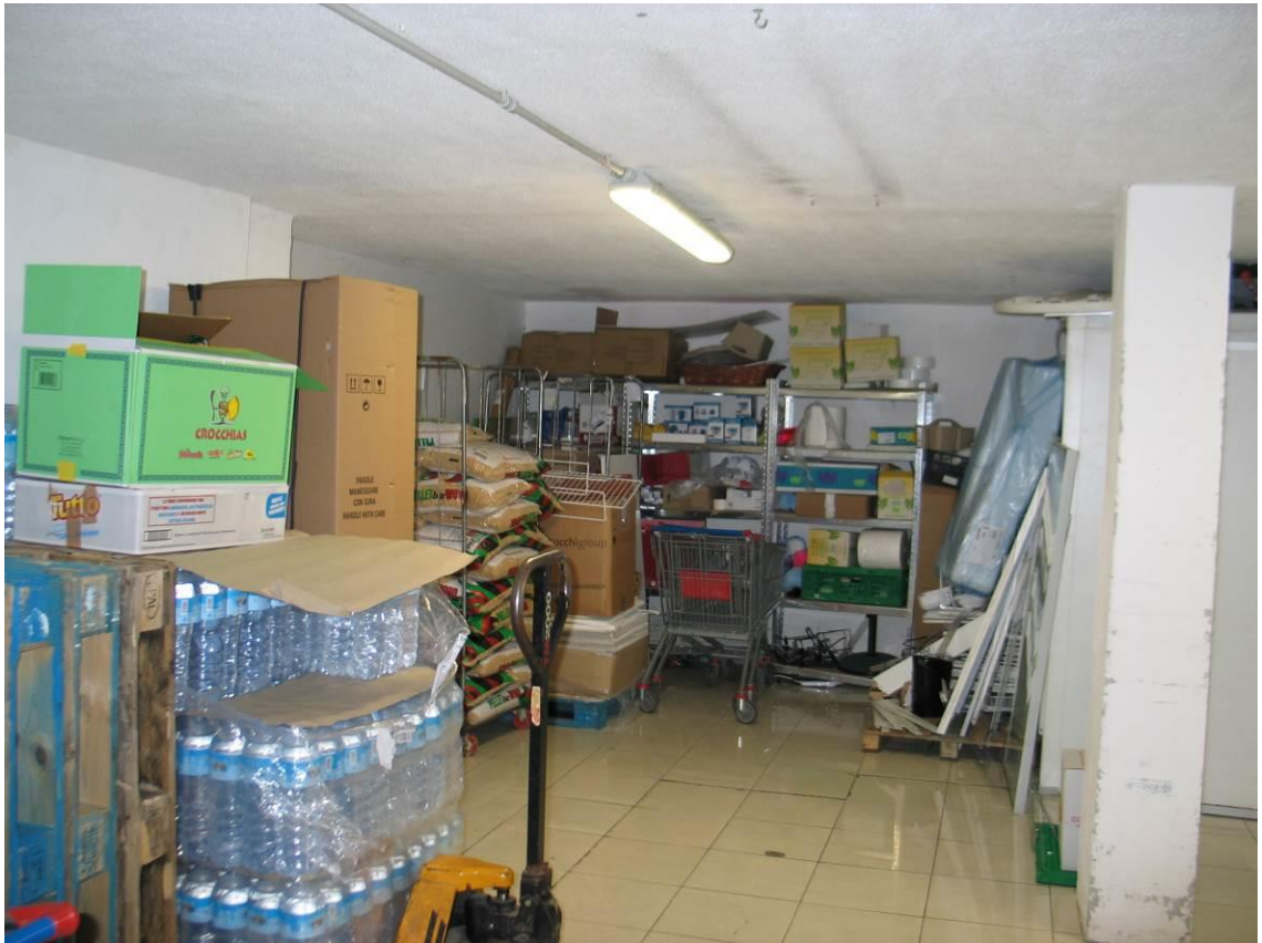
Foto 12 - Magazzino