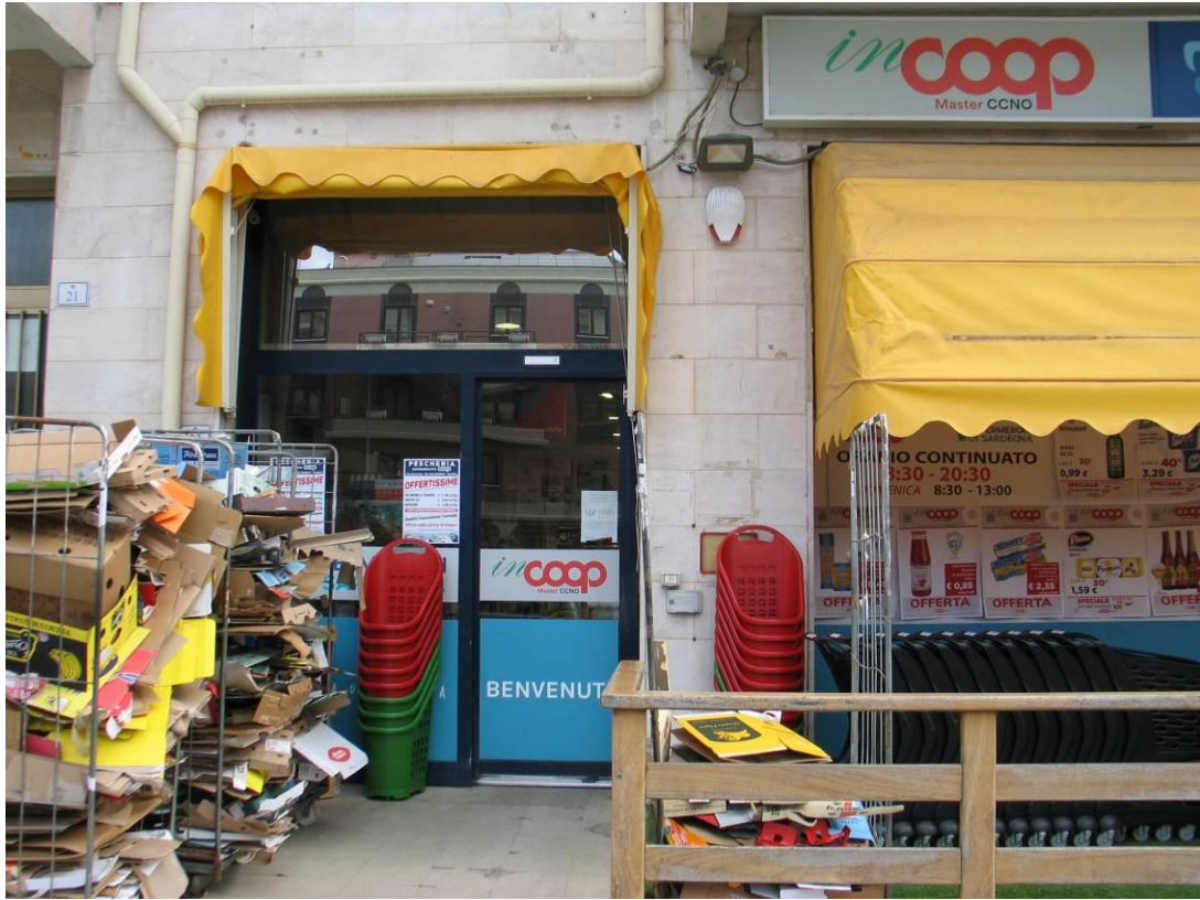
Foto 5 - ingresso