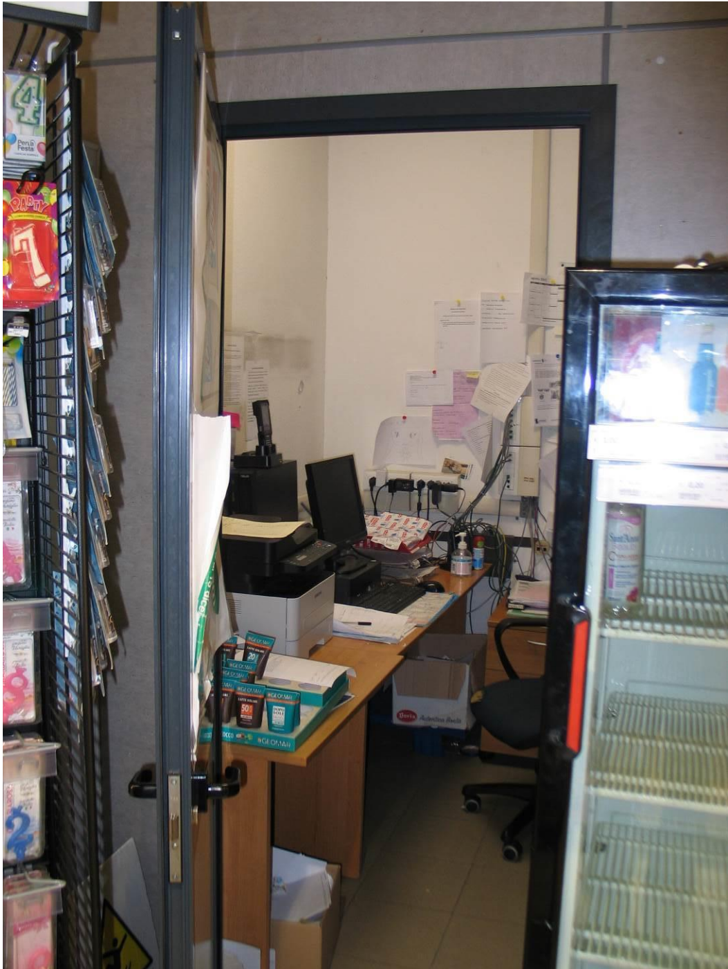
Foto 9 - Uffici